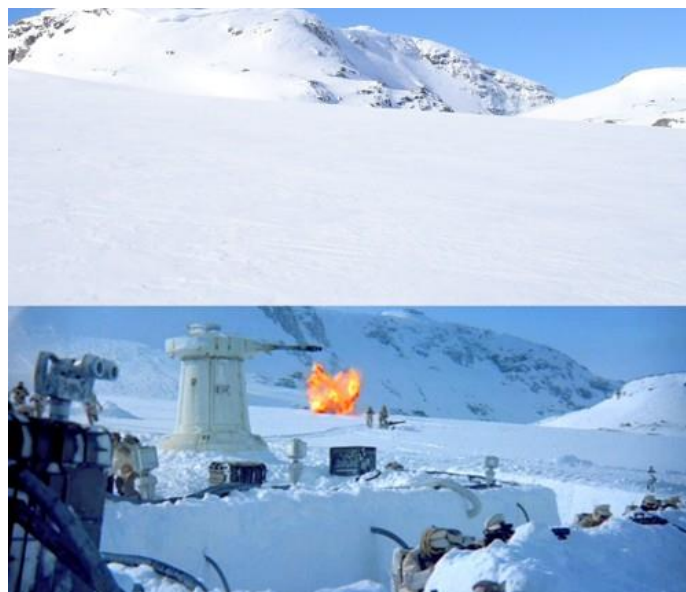
Slika 2.3 Filmski set Hoth

U drugome filmu iz 1980, Ratovi Zvijezda: Epizoda V Imperij Uzvrća Udarac snježna bitka koja se odvija na ledenome planetu Hoth snimljena je na ledenjaku Hardangerjøkulen, šestom najvećem ledenjaku u Norveškoj. Tijekom snimanja 1979., snježna mećava pogodila je gradić u podnožju ledenjaka, omogućivši redatelju Irvinu Kershneru da snimi dvije ključne scene koje su bile bijeg Lukea Skywalkerera iz pećine Wampa, kao i interakcija mladog junaka s duhom Obi-Wan Kenobija prije nego što je spašen od Hana Sola. (Nayak, 2020.)[14]