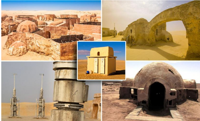
Slika 2.2:Filmski setovi Tatooine

Kako bi u prvom filmu predstavili pješčani planet Tatooine. Filmska ekipa od 130 ljudi odletjela je u Tunis, državu u Sjevernoj Africi. Prije toga teretni avioni i veliki kombiji za selidbu donijeli su tisuće komada opreme i rekvizita u pustinju i građevinska ekipa je 2 mjeseca gradila gradove. (Schickel, 1977.)[20]