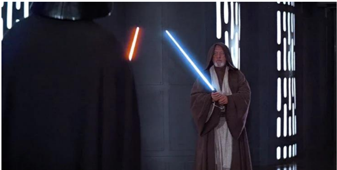
Slika 4.1: Svjetlosni mačevi u starijim filmovima

Iako se efekti svjetlonosnih mačeva možda i ne čine kao velika stvar u usporedbi s ostalim ogromnim digitalnim efektima koji ulaze u stvaranje filmova, oni su ključni dio u stvaranju stvarnog osjećaja. Osvijetljene oštrice mača u novijim filmovima Star Wars ispunjavaju ulogu pomažući premostiti jaz između fantastije i stvarnosti na način da izgledaju realističnije. (Gartenberg, 2019.) [5]