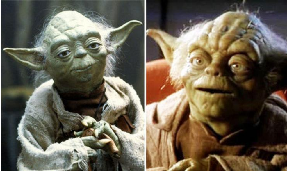
Slika 3.2: Usporedba lutke Yoda u originalnoj trilogiji i prednastavcima (Izvor: Simpson, 2018.)

Nick Maley, Šminker za specijalne efekte Yode iz Ratova Zvijezda: Imperij uzvraća udarac tvrdi da je ažuriranje Yode za Fantomsku prijetnju bila pogreška. "Rekonstruirali su ga i napravili od drugačijeg materijala koji je bio teži. "Onda, budući da je bio proziran umjesto neproziran, to je značilo da ga svjetlost ne pogađa na isti način pa mu boja nije bila ista." Rezultat je bio Yoda koji je izgledao sasvim drugačije i izazvao je mnogo kritika. (Simpson, 2018.)[22]