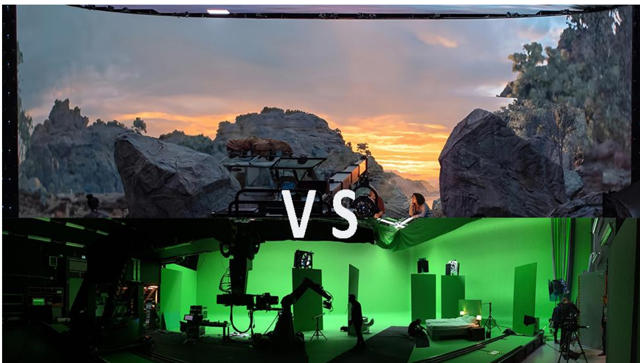
Slika 8: Zeleni ekran vs led wall

Jedna od najtežih stvari za glumca u modernom filmskom stvaralaštvu je ulazak u lik dok je okružen zelenim zidovima, pjenastim blokovima koji označavaju prepreke koje će se kasnije obojiti i ljudima s točkama na licu i odijelima s pričvršćenim lopticama za ping-pong. Da ne spominjemo da sve ima zelene refleksije koje je potrebno obojati. Štoviše, zbog ograničenja u renderiranju CGI sadržaja, pokreti kamere često su ograničeni na traku ili nekoliko unaprijed odabranih snimaka za koje je sadržaj i osvjetljenje pripremljeno. (Tech Crunch, 2020.) [23]