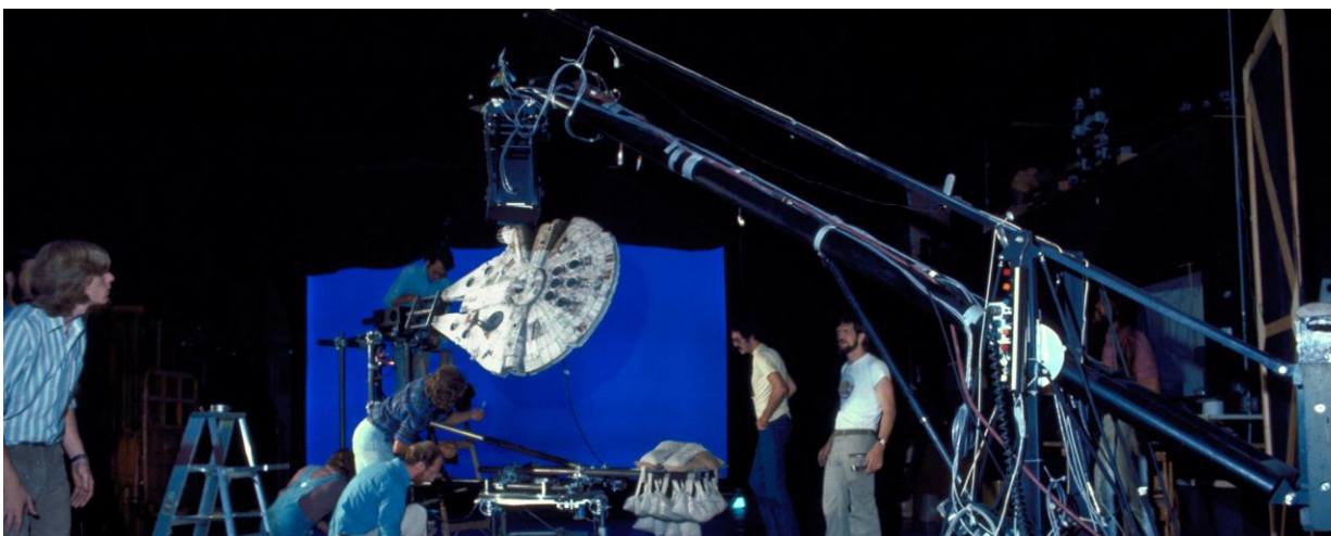
Slika 2.1: Dykstraflex

ILM je napravio revoluciju izgradnjom novog računalno kontroliranog sustava kamera nazvanog Dykstraflex . To je omogućilo ILM-u da doda plavi zaslon iza modela i zadrži model stabilnim, dok pomiče kameru oko objekta kako bi simulirao kretanje. Neke od najpoznatijih scena Ratova zvijezda napravljene su ovom tehnologijom, uključujući početnu scenu filma Nova nada . S ovim efektom, scene svemirskih bitaka djeluju realistično. Dio izazova s korištenjem ove tehnike je da su sve morali napraviti ručno. Na kraju se mukotrpan rad isplatilo jer specijalni efekti u filmu nisu bili ništa što su ljudi prije vidjeli. (Montante, 2018.)[13]