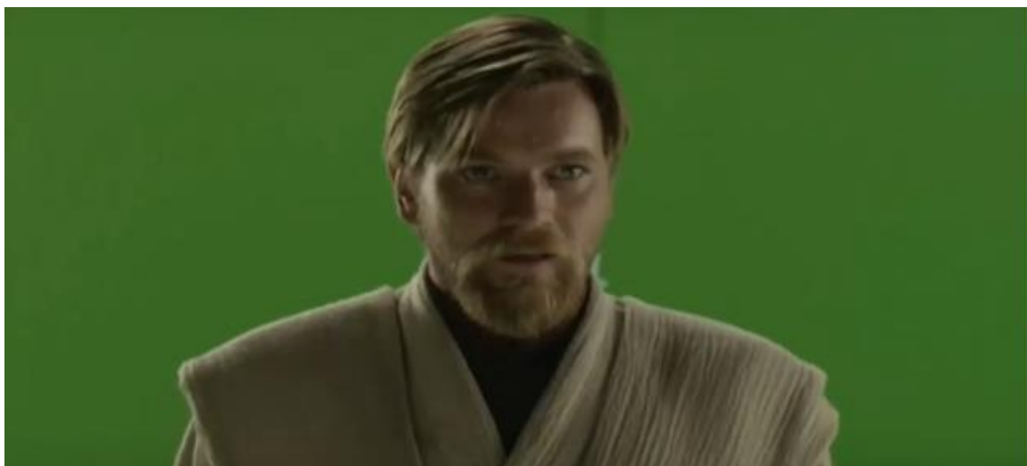
Slika 3.5: McGregor ispred zelenog ekrana

Zvijezda Obi-Wan Kenobija, Ewan McGregor, smatra da su scenariji prednastavka Ratova zvijezda i oslanjanje na zeleni ekran pravi izazov. Tijekom dubinskog intervjua, McGregor je govorio o glumačkim izazovima prednastavka zbog Lucasovog pisanja i zalaganja za više CGI-ja i zelenih ekrana. Objasnio je da je u početku bio jako uzbuđen kada je dobio ulogu Obi-Wana. Na kraju je shvatio da će CGI i zeleni ekrani postati mnogo dominantniji aspekti, "jer George voli tehnologiju i voli guranje u to područje." Ipak, McGregor je najbolje iskoristio situaciju, iako priznaje da bi bolje pisanje olakšalo rad s toliko digitalnih aspekata. U dijalogu nema nečega što bi moglo zadovoljiti kad nema okruženja. Bilo je to prilično teško izvedivo. Unatoč tome što je smatrao da su uvjeti snimanja prednastavka Ratova zvijezda bili teški, McGregor je ipak uspio izvesti tri snažne izvedbe i ostati zapamćen kao vrhunac trilogije preddastavka. (Graff, 2021.)[6]