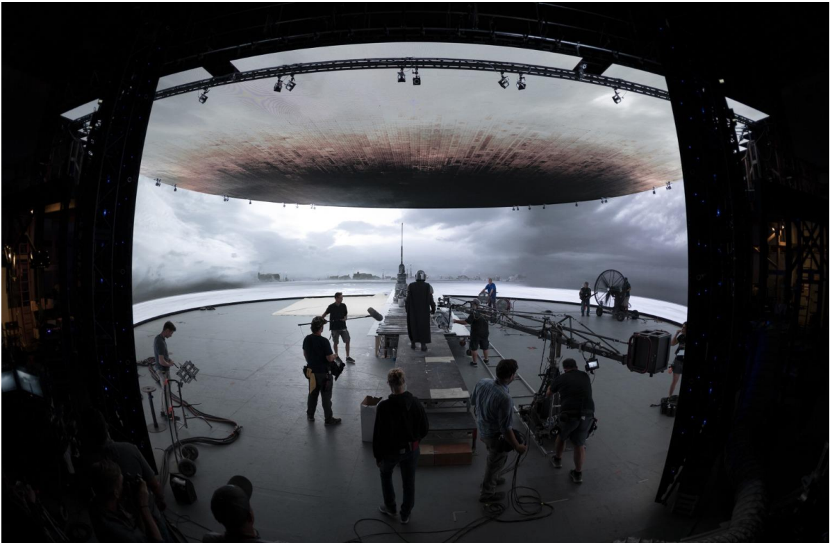
Slika 5.1: Snimanje Mandaloriana

Način na koji je ova serija napravljena predstavlja veliku promjenu i stvara novi standard. Koja je to nova tehnologija? To je evolucija tehnike koja se koristi gotovo stoljeće u ovom ili onom obliku: prikazivanje slike iza glumaca. Sam napredak nije u ideji nego u njenoj izvedbi. Nije dovoljno samo pokazati sliku iza glumaca. Filmaši to rade s projiciranim pozadinama još od nijeme ere. To je u redu ako samo želite lažirati lokaciju iza statične snimke. Problem nastaje kada želite pomicati kameru, jer kad se kamera pomakne, odmah postaje jasno da je pozadina slika.