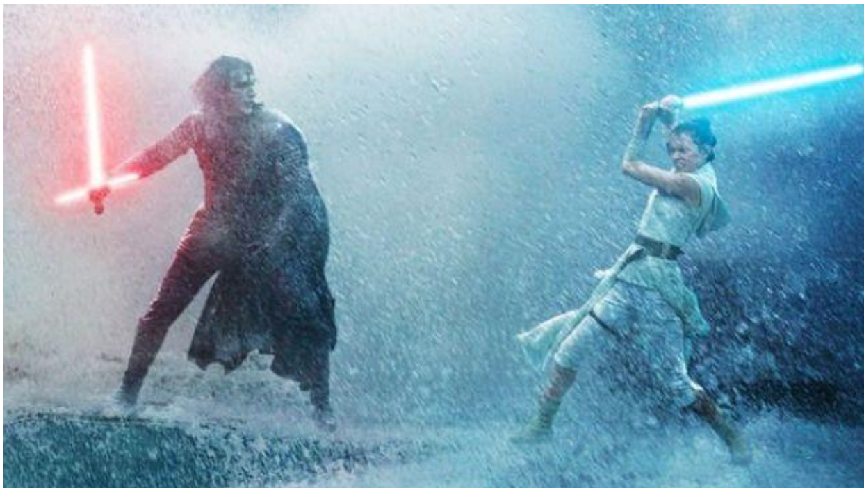
Slika 4.3: Vodena borba