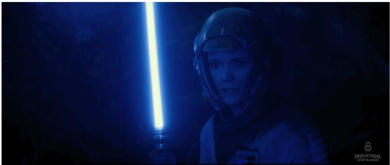
Slika 4.5: Flashback scena treninga princeze Leie

U sceni flashbaca, duh Lukea Skywalkerera govori o obučavanju njegove sestre Leie o načinima Sile nakon pada Carstva u Povratku Jedijsa . Tim ILM-a koristio je kadrove iz tog filma iz 1983. kako bi stvorio mlada lica likova za ovu scenu. "Snimke smo uzeli iz originalnih filmova", rekao je Abrams za Vanity Fair. Tijela likova, očito, igrali su zamjenski izvođači. Jedna od onih koji su pomogli utjeloviti Leiu, odnosno Carrie bila je njezina kći, Billie Lourd. (Vanity Fair, 2020.) [1]