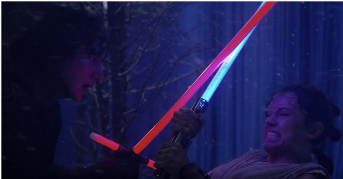
Slika 4.2: Svjetlosni mačevi u novijim filmovima