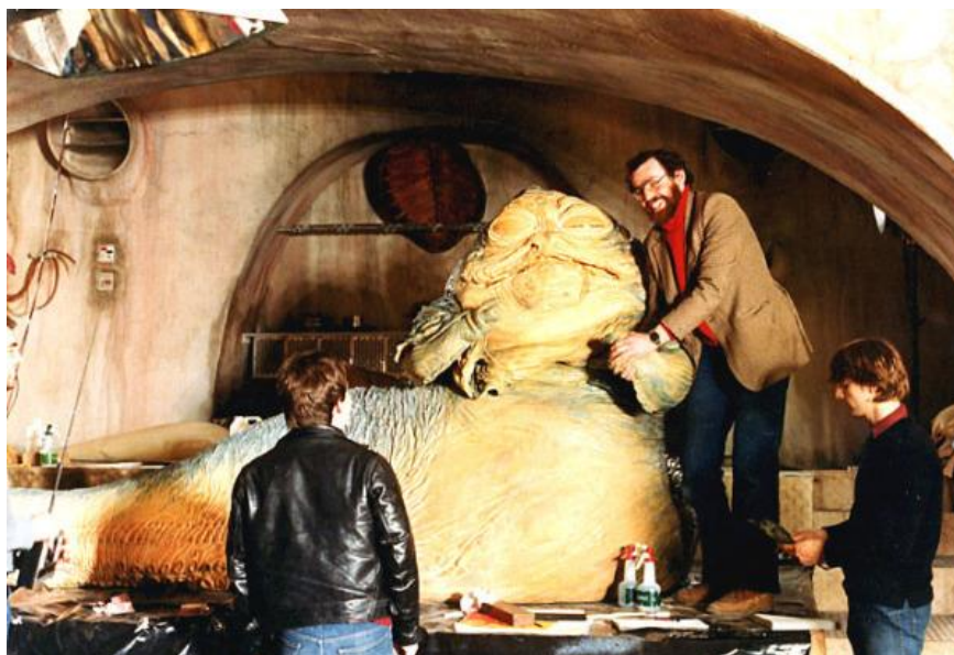
Slika 2.6: Lutka Jabba The Hutta

Jabba The Hutt bio je jedan od najvećih i najskupljih animatronika ikada. Jedan od aspekta Jabbe bio je koliko je ljudi bilo potrebno da ga oživi. Uvijek su najmanje tri osobe upravljale njegovim licem izvana, ne uključujući Davida Barclaya i Tobyja Philpotta koji su bili unutra kao lutkari. Pomicali su mu ruke, glavu, tijelo, čeljust i jezik. (Coppinger, 2006.) [4]