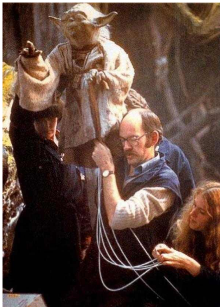
Slika 2.5: Lutka Yode

U filmovima Imperij uzvraća udarac iz 1980. i Povrak Jedija iz 1983. godine Yoda je u cijelosti realiziran pomoću lutkarstva. Naime, u to vrijeme tehnologija nije bila tako napredna i morali su koristiti praktične efekte, za razliku od danas kada se to može napraviti pomoću kompjuterski generiranih specijalnih vizualnih efekata. Čovjek je morao kontrolirati lutku i fizički joj pomaknuti usne svaki put kad bi Yoda govorio. Čovjek koji je u pitanju bio je Frank Oz, poznat po svojim legendarnim lutkarskim i glasovnim izvedbama. (Chichizola ,2020.)[3]