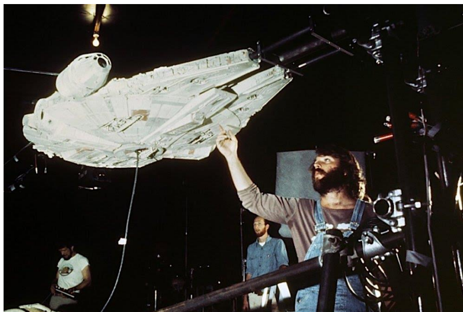
Slika 2.4: Model Millennium Falcona