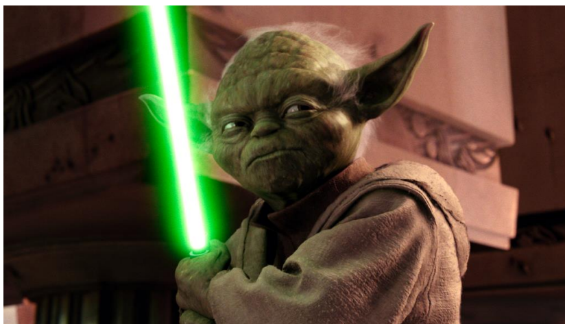
Slika 3.3: CGI Yoda

„U prvom filmu koji sam napravio, imao sam sreću da svoje scene radim s lutkom Yoda", rekao je McGregor. "I bilo je izvanredno, jer sam glumio s njim. Nisam mogao vjerovati da glumim s Yodom. Toliko ljudi upravlja s njime, a pozornica je podignuta tako da su ispod poda i mi smo doslovno hodali jedno pored drugog. On je živ. McGregor je nastavio: "Onda su ga za naš drugi i treći film zamijenili njegovom digitalnom verzijom, i nije ni približno tako simpatična. Također, znamo Yodu kao lutku. Znamo ga iz originalnih filmova kao lutku. Dakle, kada je iznenada generirano računalom, više mi se nije činilo kao Yoda. (Sharf, 2021.)[21]