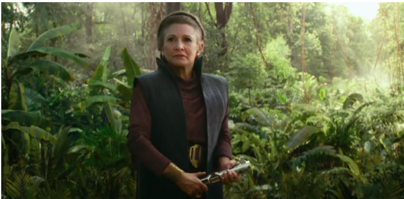
Slika 7: Princeza Leia u zadnjem filmu

Roger Guyett, supervizor vizualnih efekata, u intervjuu za DigitalTrends navodi: „Kada smo razgovarali o tome kako bismo mogli pristupiti dovođenju Leie u film, očiti pristup bi bio da napravimo njezinu digitalnu verziju. Tehnologija je na točki u kojoj se to može učiniti, ali da smo zauzeli taj pristup, autorica izvedbe ne bi bila Carrie Fisher. Direktor J.J. Abrams bio je vrlo uporan da koristimo izvedbe Carrie, što je značilo da smo bili ograničeni na izvedbe iz filmova Sila se budi i Posljednji Jedi i morali smo koristiti te izvedbe. Dakle, jednom kada smo se ograničili na određene linije dijaloga, J.J. je bio posvećen da napiše scenarij po tekstu koji su mu bili dostupni iz izvedba Carrie. To je bio prvi korak, a onda morali smo stvoriti dojam kao da su Carriene scene jedinstvene za film, tako da je u osnovi ono što vidite na ekranu Carrie preuzeta iz prethodnih snimaka, sve zajedno uklopljeno u njezinu digitalnu verziju koja ima novu frizuru, novi kostim i sve ono što bi imala u novom filmu.“ (Digital Trends, 2020.) [10]