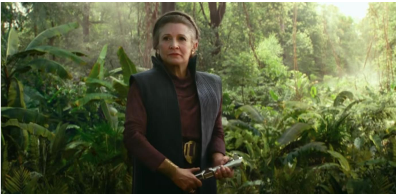
Slika 7: Princeza Leia u zadnjem filmu

Roger Guyett, supervizor vizualnih efekata, u intervjuu za DigitalTrends navodi: „Kada smo razgovarali o tome kako bismo mogli pristupiti dovođenju Leie u film, očiti pristup bi bio da napravimo njezinu digitalnu verziju. Tehnologija je na točki u kojoj se to može učiniti, ali da smo zauzeli taj pristup, autorica izvedbe ne bi bila Carrie Fisher. Direktor J.J. Abrams bio je vrlo uporan da koristimo izvedbe Carrie, što je značilo da smo bili ograničeni na izvedbe iz filmova Sila se budi i Posljednji Jedi i morali smo koristiti te izvedbe. Dakle, jednom kada smo se ograničili na određene linije dijaloga, J.J. je bio posvećen da napiše scenarij po tekstu koji su mu bili dostupni iz izvedba Carrie. To je bio prvi korak, a onda morali smo stvoriti dojam kao da su Carriene scene jedinstvene za film, tako da je u osnovi ono što vidite na ekranu Carrie preuzeta iz prethodnih snimaka, sve zajedno uklopljeno u njezinu digitalnu verziju koja ima novu frizuru, novi kostim i sve ono što bi imala u novom filmu.“ (Digital Trends, 2020.) [10]