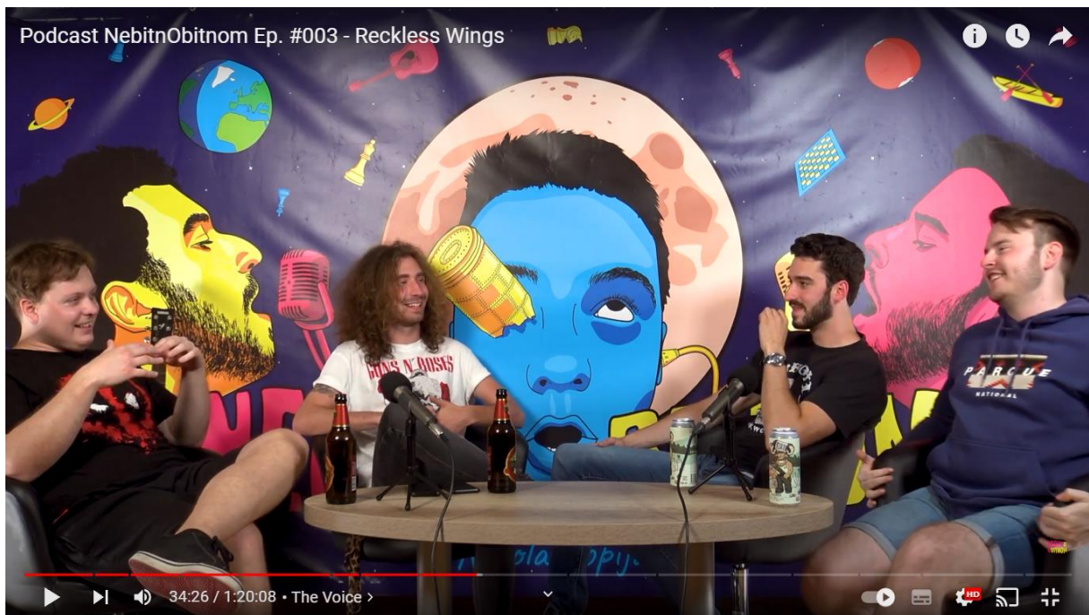
SLIKA 13.1. Podcast NebitnObitnom: Reckless Wings

Podcast NebitnObitnom do sada je snimio 25 epizoda, od kojih su čak 11 bile glazbene. Sa time na umu mogu reći kako najviše iskustva imamo sa glazbenicima, te kako odraditi epizodu na najbolji mogući način. Glazbenu epizodu najbolje je odraditi u što je moguće opuštenijem i ležernijem tonu. Naravno dobra priprema esencijalna je za uspjeh epizode, kao i glazbeno predznanje. Iako se na epizodi nalaze glazbenici, ljudi istih generacija dijele određena sjećanja i vremena, koja mogu biti vrlo zanimljivi segmenti na samoj epizodi, kao što je to bilo u slučaju epizode sa bandom Reckless Wings. Što se tiče vizualne prezentacije poželjno je da su voditelji odjeveni u stilu epizode koju vode.