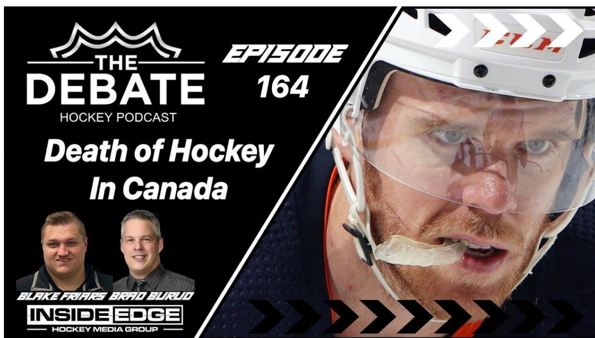
SLIKA 14. 1. The Debate: Hockey podcast

Kao što i samo ime epizode govori u ovoj vrsti epizode glavna radnja bit će debata između dvoje ili više sudionika u razgovoru. Bitna je priprema gostiju o zadanoj temi, te kako obje strane imaju svoje određeno stajalište podkrijepljeno činjenicama koje je iznijeti za vrijeme debate. Svaka debata također ima i svog moderatora. Njegova uloga je prije svega ostati neutralan tokom cijele debate i pobrinuti se debata odvija glatko kako ne bi slučajno došlo do bilo kakvih sukoba.