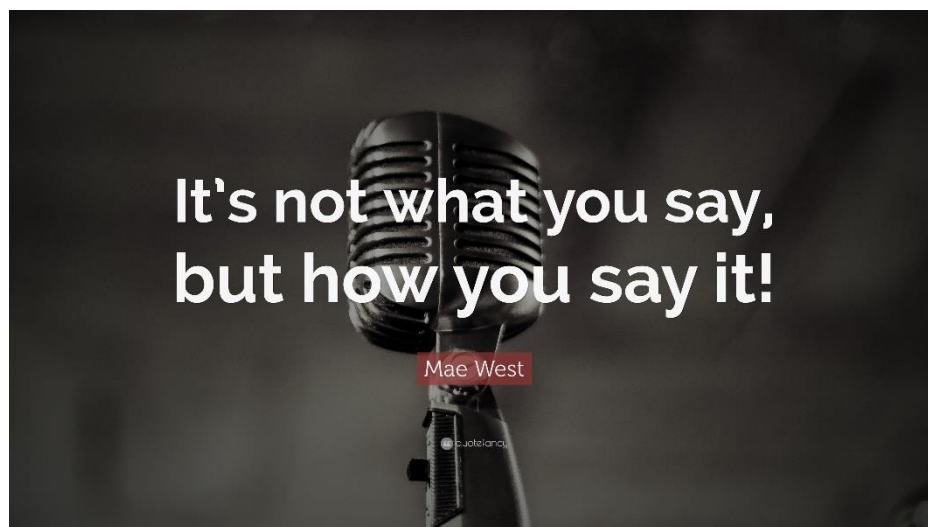
SLIKA 4. 1. Mae West quotes

Ton glasa, usporeni ili ubrzani govor, podizanje ili spuštanje glasa, naglašavanje pojedinačnih riječi, umetanje pauzi i slične metode ljudima služe u svrhu ostvarivanja svih funkcija kojima neverbalan način ponašanja služi.