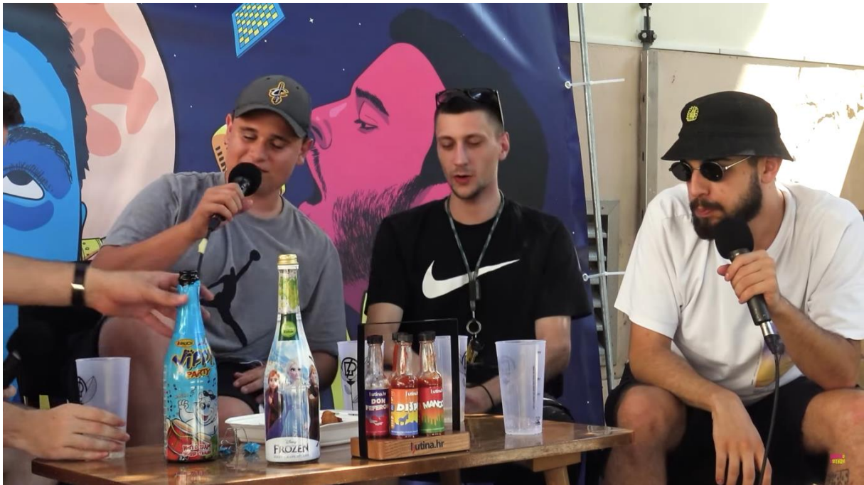
SLIKA 15.2. Prikaz konzumacije dječjeg šampanjca na podcastu NebitnObitnom

Kao što smo i spomenuli koliko je vizualni identitet podcasta bitan, također kod epizode gdje je gost maloljetne dobi, vidno je naglasiti da na podcastu u kojem se često konzumira alkohol, da kod ove specifične epizode to nije slučaj. Voditelj na samom početku ili tokom epizode može napomenuti kako se alkohol ne konzumira, te je bitno da se na kameri jasno vidi piće koje se konzumira, kao što je to u slučaju na podcastu NebitnObitnom.