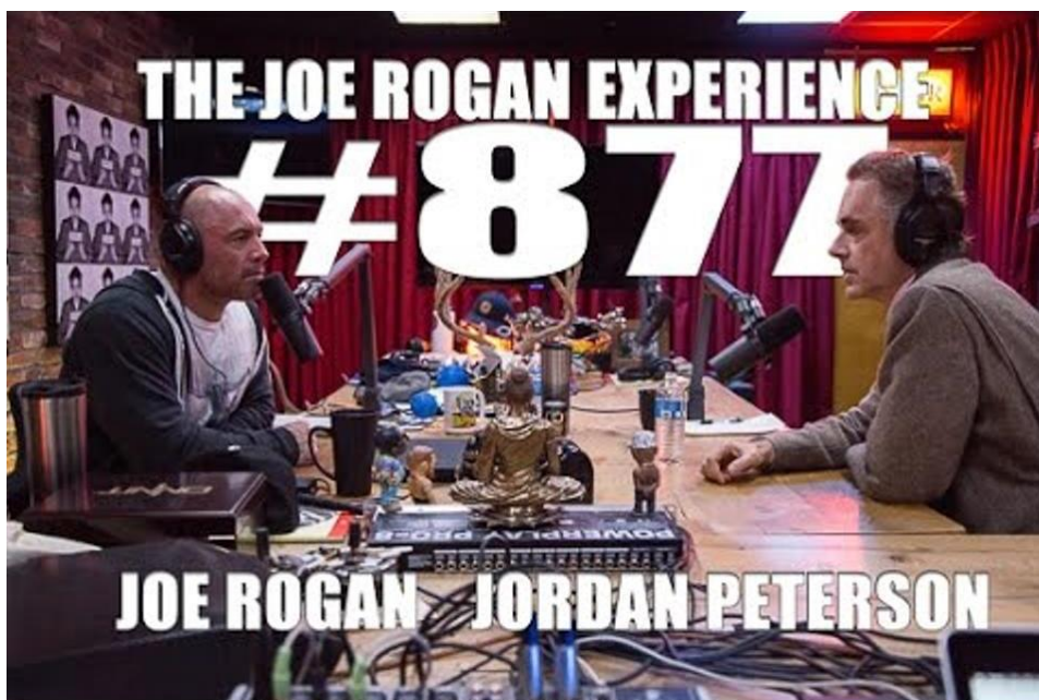
SLIKA 10.1. The Joe Rogan Experience podcast: Jordan Peterson

Razgovorni podcast najčešći je tip podcasta. Čine ga dvoje ljudi koji vode interesantan razgovor, bilo to o određenoj temi ili nekom događaju bitno je da zainteresiraju publiku. Ovakvoj vrsti podcasta najbližnja bi bila radio emisija.