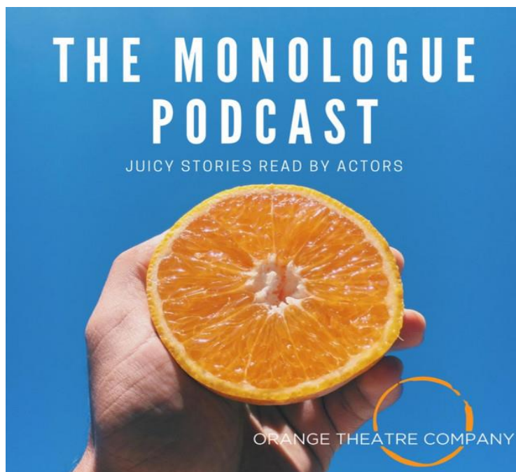
SLIKA 10.2. The Monologue podcast

U monologu, odnosno solo podcastu, jedan voditelj predstavlja drugu temu svaku novu epizodu. Monolog je jedan od najlakših formata za početak budući da trebate samo mikrofoni i stručnost u određenom području. Međutim, solo emisija može biti naporna za voditelja jer će možda trebati razgovarati nasamo više od sat vremena u svakoj epizodi kako bi producentu pružili dovoljno sadržaja za uređivanje. Monolog bez publike najteži je dio komunikacije na podcastu.