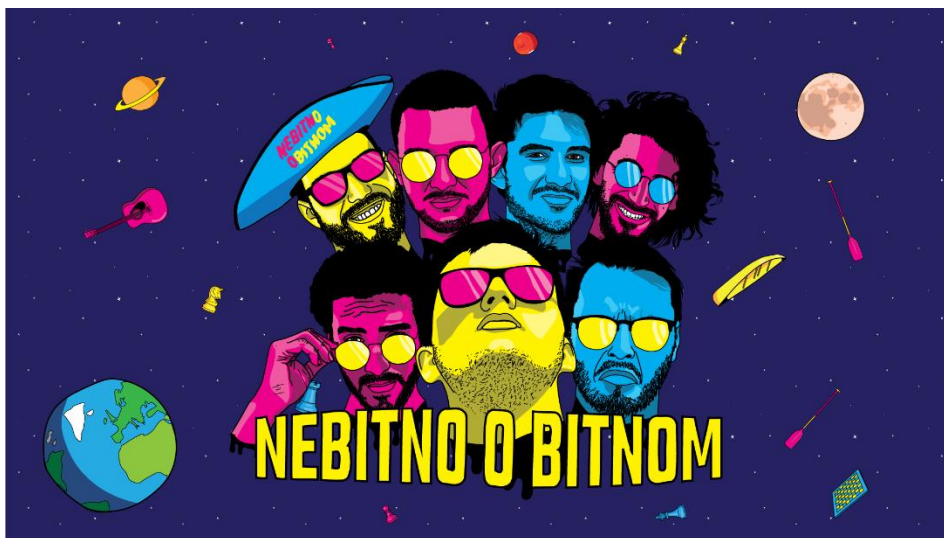
SLIKA 10.3. Podcast NebitnObitnom

U zajedničkom podcastu, dva ili više voditelja vode razgovor za svaku epizodu, obično o unaprijed odabranoj temi. Često svaki domaćin podcasta igra određenu ulogu. Na primjer, jedan domaćin može čitati isječke vijesti dok drugi vodi segment sa sažetkom. Ovakav format oslanja se na kemiju između voditelja. NebitnObitnom vrsta je podcasta sa dvoje voditelja.