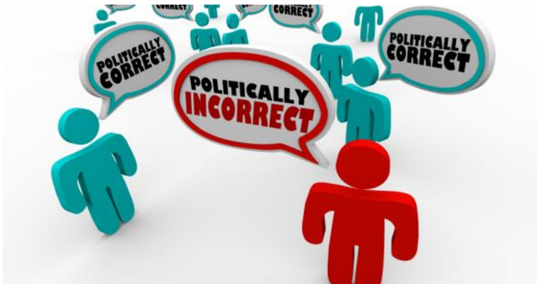
SLIKA 6.1. Politička korektnost

Oni koji su najviše protiv tog koncepta takozvane političke korektnosti gledaju na njega kao na cenzuru i uskraćivanje slobode govora koje postavlja određena ograničenja na javne debate. Tvrde da postavljanje takvih granica koje označavaju što je i nije prihvatljivo u načinu govora neizbježno naposljetku vode do samocenzure i ograničenja u ponašanju. Također vjeruju da ponekad politička korektnost percipira uvrjedljiv način govora u situacijama gdje takvog načina govora nema. Na kraju krajeva, čini se da je konstantna rasprava o prirodi političke korektnosti centrirana oko načina govora, nazivanja, i pitanja čije su definicije prihvaćene. [3]