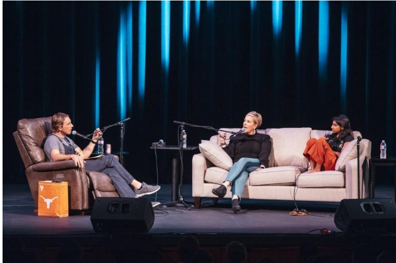
SLIKA 10.4. Armchair Expert Podcast with Dax Shephard