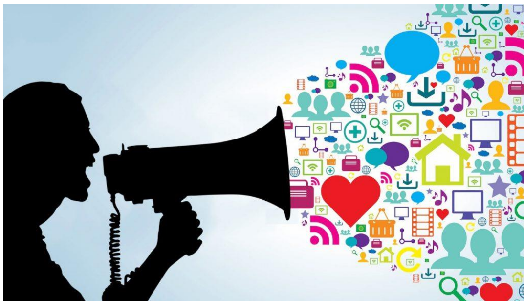
SLIKA 5.1. Sloboda govora

Sloboda je govora jedno od glavnih ljudskih načela odnosno prava koje podržava slobodu zajednica ili pojedinaca u artikuliranju svojih mišljenja i ideja bez straha od cenzure, odmazde ili sankcija zakonske prirode, te je prisutna u svim demokratskim državama. Prema Ustavu Republike Hrvatske jasno piše kako građani Republike Hrvatske imaju sva prava i slobode, neovisno o njihovoj boji kože ili rasi, vjeri, jeziku, spolu, političkom uvjerenju ili ikakvom drugačijem uvjerenju, nacionalnom ili socijalnom podrijetlu, naobrazbi, imovini, rođenju, socijalnom položaju ili drugim osobinama, te su svi pred zakonom jednaki. [2] Pripadnicima svih naroda i manjina se garantira slobodno izražavanje narodne pripadnosti, slobodna uporaba vlastitog jezika i pisma, kao i kulturološka autonomija. Bez slobode govora niti jedan podcast format ne bi mogao postojati.