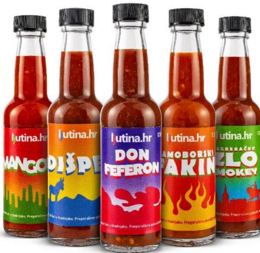
SLIKA 21.2 Ljutina.hr umaci