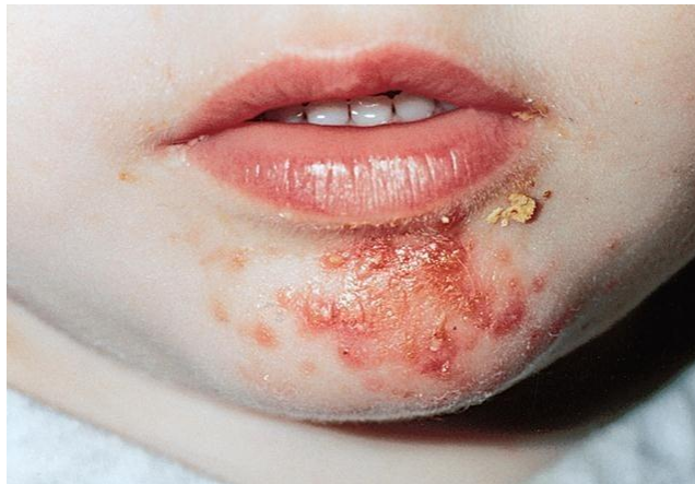
Slika 1. Površinska infekcija