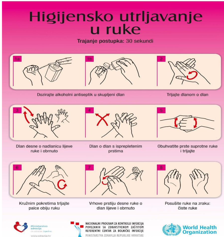
Slika 7. "Higijensko utrljavanje u ruke"

Slika 4. prikazuje postupak higijenskog utrljavanja ruku koji traje 30 sekundi. Postupak je na slici prikazan korak po korak, uz fotografiju i objašnjenje svakoga koraka [44].