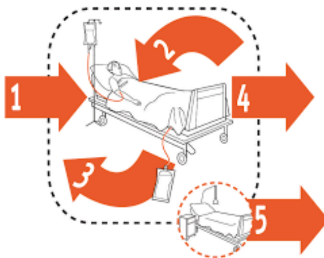
Slika 6. "Mojih 5 trenutaka za higijenu ruku" [KBC Rijeka (preuzeto s: http://kbc-rijeka.hr/wp-content/uploads/2016/04/Pet-trenutaka.pdf 20.09.2021.)

Slika 3. prikazuje gore navedenih „Mojih 5 trenutaka za higijenu ruku“ iz čega je vidljivo [43]: