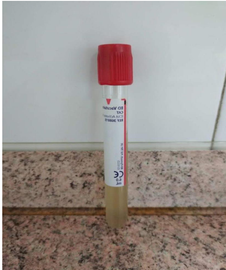
Slika 4. Urinokultura

punkcijom. Uzimanje uzorka na taj način smanjuje mogućnost kontaminacije uzorka, ali je poželjno da se prije uzimanja uzorka promijeni urinarni kateter [29]. Na Slici 1. nalazi se primjer uzorka urinokulture.