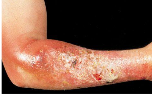
Slika 2. Dubinska infekcija kože