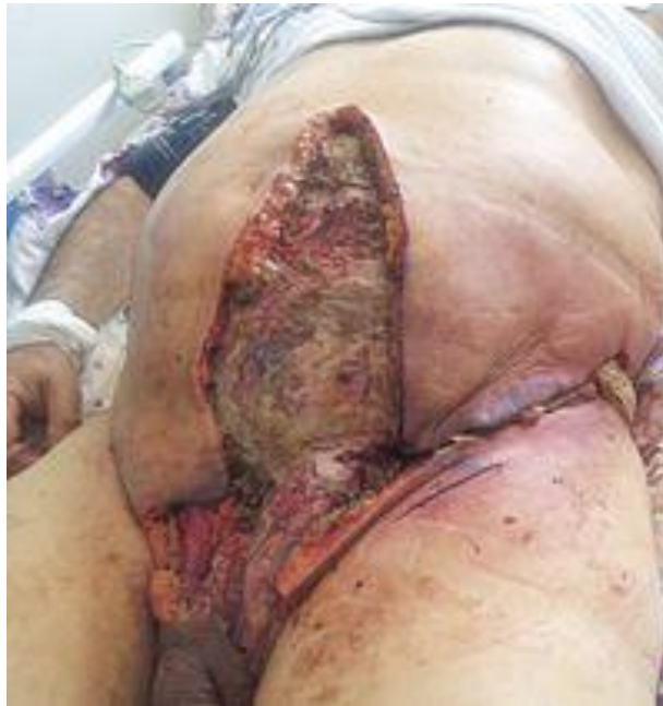
Slika 3. Nekrotizirajuća infekcija ( https://www.akutne.cz/res/publikace/2-fournier-gangrena-clov.pdf )