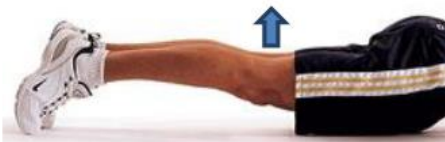
Slika 7. Vježba snaženja [6]

Dok ste u ležećem položaju na trbuhu ispruženih i skupljenih nogu, spojite nožne prste, koljena odignite od podloge, mišiće natkoljenice zategnite i tako već napete mišiće zadržite 4-5 sekundi, a potom opustite stopala i koljena (Slika 7). Ovu vježbu treba izvesti tri puta. Vježbu izvodite deset puta za redom.