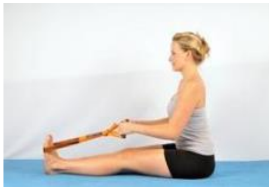
Slika 16. Vježbe istezanja stražnjeg dijela potkoljenice i natkoljenice [6]

Istezanje za stražnje strane natkoljениčnog kao i potkoljениčnog dijela noge. Zauzmite sjedeći položaj na podu s nogama ispruženim ispred sebe. Izdahnite, čučnite i uhvatite stopala rukama ili ih omotajte ručnikom presavijenim na pola (Slika 16). Izdahnite, zatim privucite stopala bliže sebi zadržavajući duljinu nogu sve do koljena. Zadržite položaj i potpuno se opustite. Izvedite vježbu još tri do četiri puta.