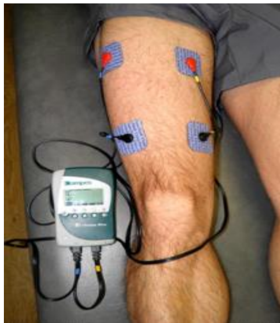
Slika 18. Primjer elektroterapije [6]

niskofrekventnom modulacijom amplitude početne struje. . Proizvode se superponiranjem dviju struja koje djeluju na srednjoj frekvenciji, od kojih jedna ima unaprijed određenu frekvenciju, dok druga ima frekvenciju koja se može mijenjati. Moguće ga je koristiti u kvadripolarnoj konfiguraciji s četiri elektrode (smetnje) prikazano na slici 18, u bipolarnoj konfiguraciji s dvije elektrode ili s vakuumskim elektrodama [9].