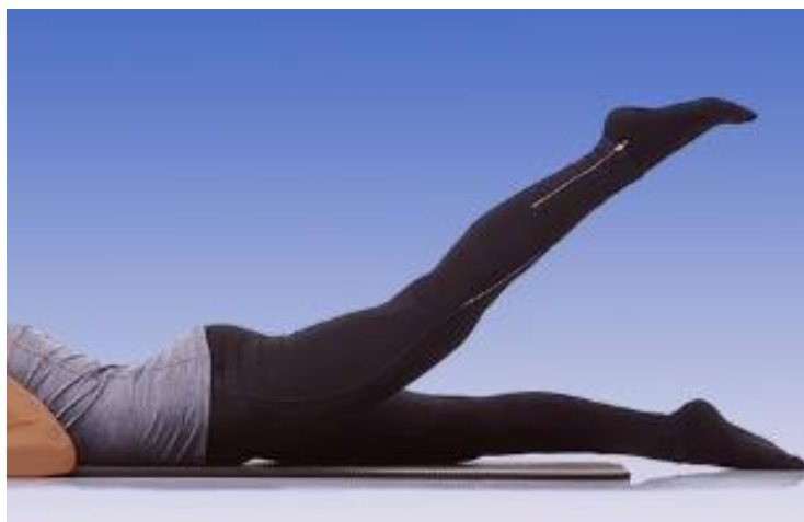
Slika 8. Vježba snaženja [6]

Nakon što razdvojite noge na prostirci, podvucite prste ispod stopala i podignite koljena (Slika 9). Nakon toga spojite noge i opustite koljena i stopala.