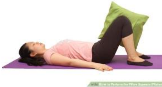
Slika 12. Vježba snaženja mišića natkoljenice [6]

Izvedite svaku vježbu tri do četiri do pet puta kada prvi put započnete rutinu, a do kraja je izvedite deset puta. Ako je prisutna bol u mišićima nogu, ovisno o vremenu vježbanja potrebno je povećati vrijeme odmora.