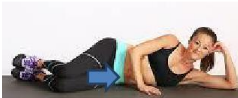
Slika 6. Vježba snaženja [6]

Ispružene obje noge principom stopalo na stopalo te koljeno na koljeno, zatim savijanje obiju potkoljenica u isto vrijeme na podlozi na način taj da pete klize prema stražnjici, potom još jedanput ispružanje obiju potkoljenica klizanjem po površini i na kraju, kod opet ispruženih nogu, zatezanje oba koljena i oba stopala (Slika 6). Nakon završetka vježbe deset puta, mišići nogu trebaju biti opušteni.