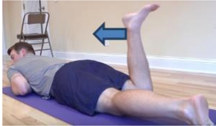
Slika 10. Vježba snaženja [6]

Stavite jastuk ispod koljena, zatim pritisnite koljena na jastuk dok istovremeno podižete stopala s prostirke (Slika 11). Zadržite stopala bliže sebi pet do deset sekundi, a zatim ih otpustite. Vježbu izvodite deset puta za redom.