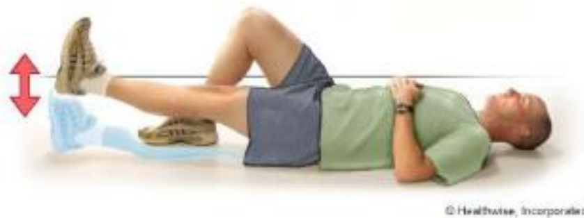
Slika 4. Vježba snaženja [6]

Prvo postavite obje noge ravno na prostirku s koljenima i stopalima privučenima prema prsima. Dok klizite po strunjači, spojite noge, a tek na samom kraju opustite koljena i stopala. Vježbu izvodite deset puta za redom (slika 5).