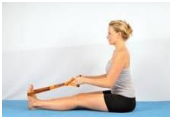
Slika 16. Vježbe istezanja stražnjeg dijela potkoljenice i natkoljenice [6]

Istezanje za stražnje strane natkoljениčnog kao i potkoljениčnog dijela noge. Zauzmite sjedeći položaj na podu s nogama ispruženim ispred sebe. Izdahnite, čučnite i uhvatite stopala rukama ili ih omotajte ručnikom presavijenim na pola (Slika 16). Izdahnite, zatim privucite stopala bliže sebi zadržavajući duljinu nogu sve do koljena. Zadržite položaj i potpuno se opustite. Izvedite vježbu još tri do četiri puta.