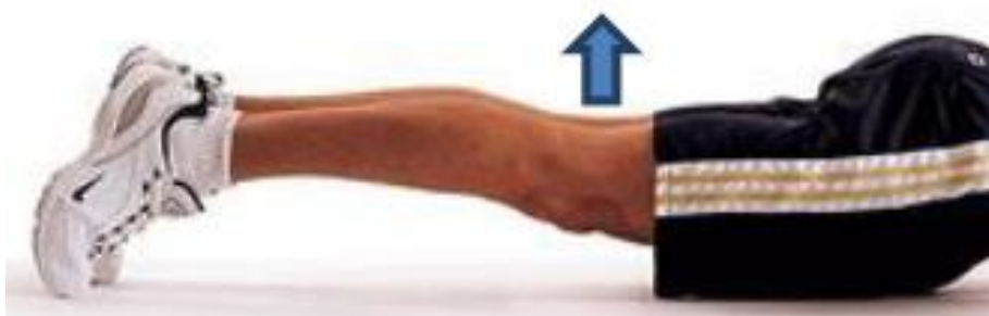
Slika 7. Vježba snaženja [6]

Dok ste u ležećem položaju na trbuhu ispruženih i skupljenih nogu, spojite nožne prste, koljena odignite od podloge, mišiće natkoljenice zategnite i tako već napete mišiće zadržite 4-5 sekundi, a potom opustite stopala i koljena (Slika 7). Ovu vježbu treba izvesti tri puta. Vježbu izvodite deset puta za redom.