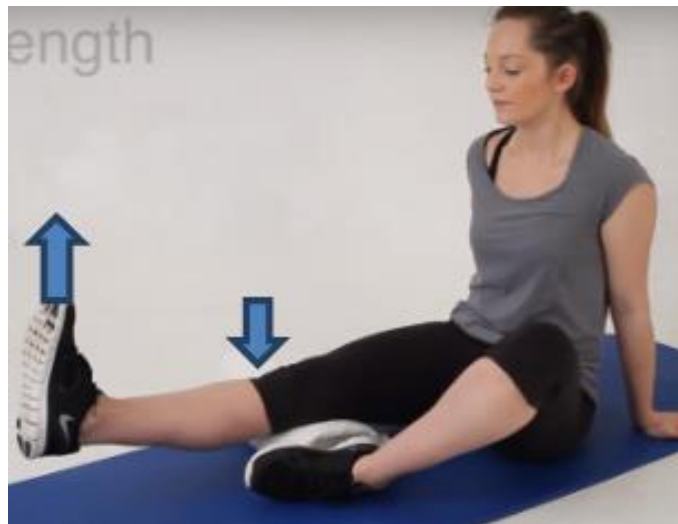
Slika 11. Vježba snaženja [6]

Stavite jastuk ispod koljena, zatim pritisnite koljena na jastuk dok istovremeno podižete stopala s prostirke (Slika 11). Zadržite stopala bliže sebi pet do deset sekundi, a zatim ih otpustite. Vježbu izvodite deset puta za redom.