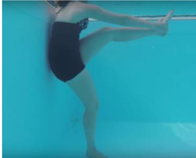
Slika 17. Primjer istezanja u vodi [6]

Uz učinak plutanja na ublažavanje boli, potpuno uranjanje tijela ima i značajan analgetski učinak. Poboljšava se rad srca, omogućuje bolja cirkulacija u mišićima i zglobovima, što olakšava oporavak i jačanje. Ovo su dva vrlo važna učinka hidroterapije na kardiovaskularni sustav. Dobar dio vježbi koje se mogu provoditi u vodi slične su vježbama istezanja i otpora, a koje se mogu provoditi "na suhom", sa iznimkom da se umjesto sile gravitacije koristi blagi otpor vode (Slika 17) [10].