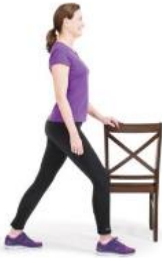
Slika 15. Vježba istezanja [6]

Istezanje za stražnje strane natkoljениčnog kao i potkoljениčnog dijela noge. Zauzmite sjedeći položaj na podu s nogama ispruženim ispred sebe. Izdahnite, čučnite i uhvatite stopala rukama ili ih omotajte ručnikom presavijenim na pola (Slika 16). Izdahnite, zatim privucite stopala bliže sebi zadržavajući duljinu nogu sve do koljena. Zadržite položaj i potpuno se opustite. Izvedite vježbu još tri do četiri puta.