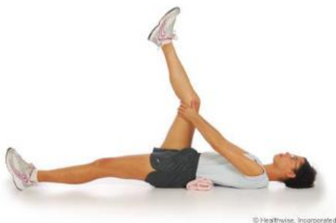
Slika 13. Vježba kod koje se istežu stražnji dio natkoljenice i listovi [6]

Stražnji dio natkoljenice i listovi su ispruženi u ovoj vježbi. Objema rukama obuhvatite čašicu koljena i povucite je u smjeru trbuha (Slika 13). Ispružite koljeno na nježan način dok pacijent ne osjeti veći stupanj napetosti. Zadržite ovaj položaj najmanje deset sekundi prije nego krenete dalje. Također je moguće povećati težinu same vježbe na način taj da se zdrava noga ne pomiče i ostane u ispruženom položaju na podlozi, dok se peta "gura" u vis u smjeru stropa. Vježba se izvodi sa svakom nogom tri do četiri puta.