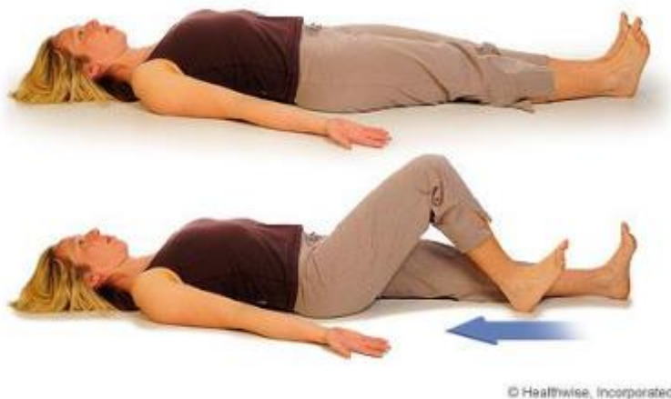
Slika 5. Vježba snaženja [6]

Klizeći petom po podlozi savijte jedno koljeno dok ne osjetite zategnuće u koljenu, drugo koljeno zatim ispružite dok petom i dalje klizite po podlozi. Radite to dok koljeno ne bude stegnuto, a zatim ponovite. Na samom kraju približite stopalo sebi dok pritišćete koljeno na podlogu. Izvedite vježbu na isti način kao i prije, ali ovaj put promijenite nogu i ponovite vježbu ukupno deset puta.