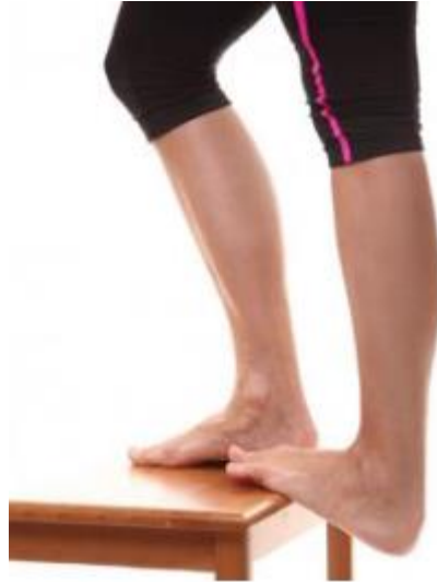
Slika 14. Vježba istežanja listova [6]

Savijanje mišića potkoljenice Stavite bočne strane stopala na klupu dok stojite. Preporuča se da se pacijent pridržava rukom za ogradu kako bi održao ravnotežu ako nema dobru ravnotežu. Dio stopala koji je okrenut prema naprijed trebao bi biti oslonjen na prednji rub klupe dok ispružimo ovu nogu (Slika 14). Nastavljamo pomicati pacijentovu petu niže dok ne jave osjećaj istežanja u listovima. Izvedite vježbu još tri do četiri puta.