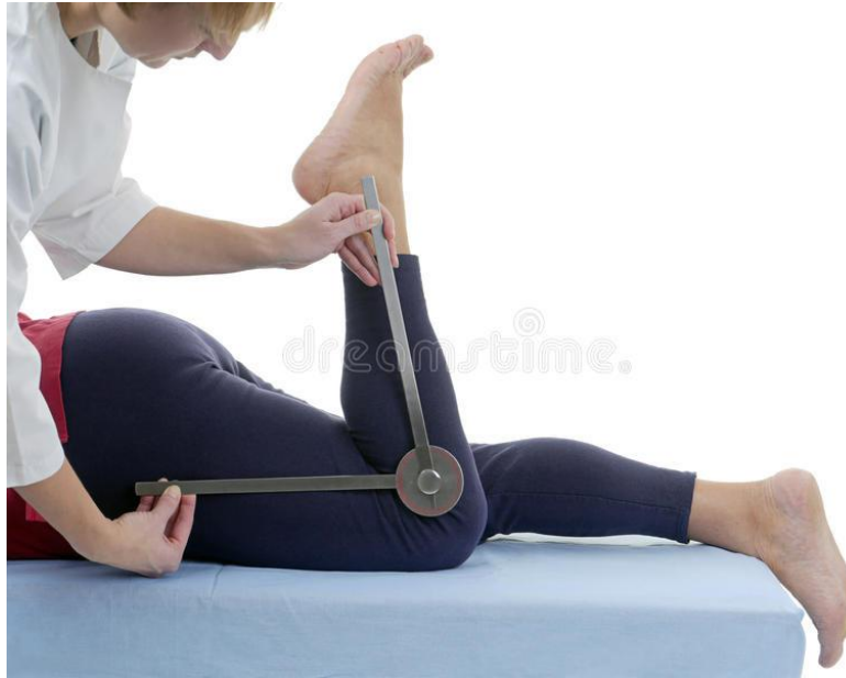
Slika 8.2.4.1. Mjerenje opsega pokreta