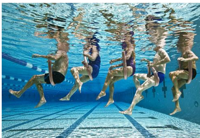
Slika 9.2.1. Izvođenje vježbi u bazenu