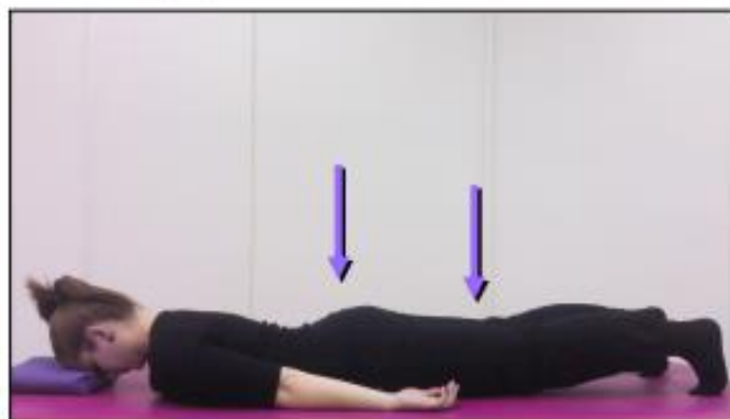
Slika 9.1.1.3. Statička vježba jačanja nožnih mišića

Početni položaj je ležeći na trbuhu, ruke su uz tijelo, te je glava oslonjena na čelo. Bolesniku se daje uputa da se podigne na stopala, tako da koljena odigne od podloge, zategne mišić natkoljenice te stisne sjedne mišić. Zadržati položaj 6-10 sekundi, nakon čega se vratiti u početni položaj i relaksirati (Slika 9.1.1.3.)