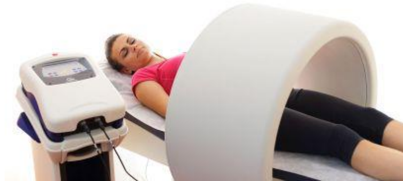
Slika 9.5.1 Primjena magnetoterapije