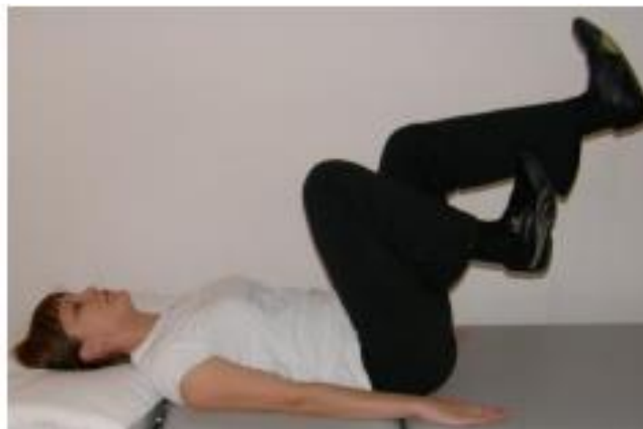
Slika 9.1.2.2. Aktivna vježba „vožnje bicikla“

Položaj je na leđima, laktovi su oslonjeni na podlogu, bolesnik rukama obuhvaća zdjelicu. Bolesniku treba dati uputu da pokuša izvoditi pokrete kao da vozi bicikl, vježbu izvoditi 30 sekundi u početku, kasnije 1-2 minute ( Slika 9.1.2.2.).