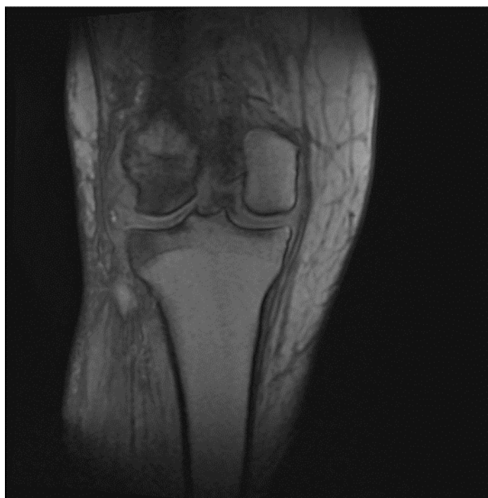
Slika 9.8.2. MG desnog koljena