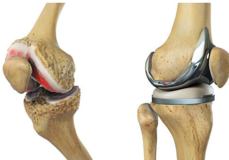
Slika 7.2.3.1. TEP koljena

Aloartoplastika (ugradnja umjetnog zgloba) je tehnika kojom se reseca (odstranjuje) jedno ili oba zglobna tijela i nadomješta se stranim materijalom koji točno odgovara odstranjenom dijelu zgloba. To strano tijelo naziva se endoproteza ili umjetni zglob. Radi se o postupku u kojem mijenjamo fiziološki zglob stranim tijelom kako bi se nadomjestila funkcija zgloba. Ako se mijenja samo jedan dio zglobnog tijela, govorimo o djelomičnoj ili parcijalnoj protezi (PEP). Ako su degenerativne promjene izrazito velike zglob se mijenja u cijelosti pa se tada govori o potpunoj ili totalnoj endoprotezi zgloba koljena (TEP) (Slika 7.1.3.1.). Bitno je naglasiti kako postoje cementne i bescementne proteze. Proteze koljena uglavnom su cementne. Bescementne se još uvijek rijetko ugrađuju, ukoliko se ugrađuju tada se mora raditi o dobroj kvaliteti kosti pacijenta [10].