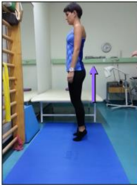
Slika 9.1.3.1. Vježba podizanje na prste

Položaj je stojeći, odnosno bolesnik stoji uspravno, ruke su spuštene uz tijelo. Bolesnik se odigne na prste, zadrži se u tom položaju i spusti se na pete (Slika 9.1.3.1).