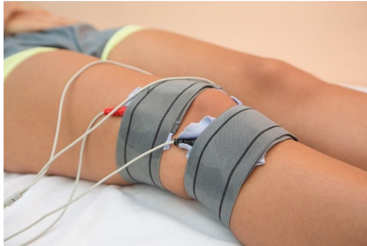
Slika 9.4.3.1. Primjena TENS-a na bolno koljeno