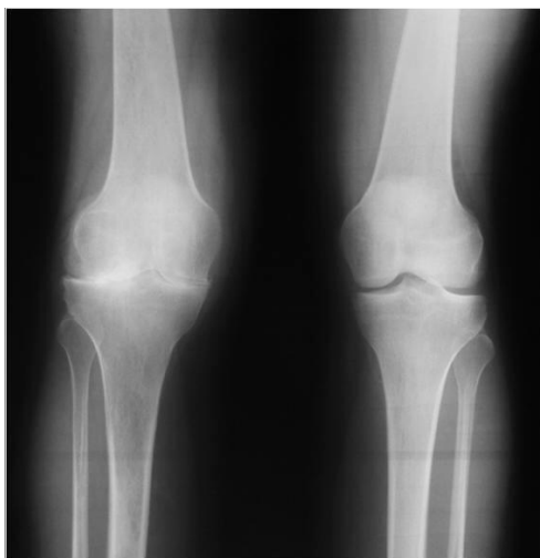
Slika 6.1.1. RTG koljena

RTG koljena je dijagnostička metoda prilikom koje dobivamo detaljnu informaciju o unutrašnjosti samog zgloba. Postupak se izvodi u stojećem položaju i uključuje oba koljena (Slika 6.1.1.). Prilikom dijagnostike na RTG snimci vidljivi su karakteristični znakovi suženja zglobnog prostora, subhondralne skleroze, osteofita i cista te ušiljenja interkondilarne eminencije. Prilikom pregleda potrebno je obratiti pozornost na poremećaje osovina koljena, odnosno varus ili vagus koljena. Kod varus deformiteta vidljivo je suženje na unutarnjoj strani koljena, a kod valgus sa vanjske strane. Ako ne postoji poremećaj osovine, suženje je najčešće prisutno s unutarnje i vanjske strane koljena [10].