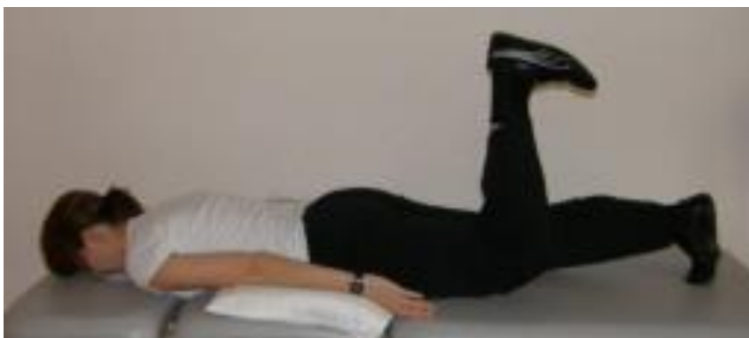
Slika 9.1.2.4. Aktivna vježba podizanje savijene noge u zrak

Ležeći položaj, bolesniku se daje uputa da jednu nogu savije u koljenu te podigne u zrak, lagano spusti i vrati u početni položaj (Slika 9.1.2.4).