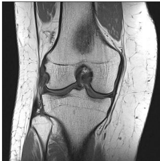
Slika 6.2.1. MR koljena

Magnetska rezonanca (MR) je neinvazivna dijagnostička metoda. Prednost ovog modela dijagnostike je da prilikom pregleda nema nikakve štetne posljedice na organizam za razliku od drugih radioloških pretraga. Za dobivanje kvalitetne obrade pacijenta se smjesti u snažno magnetsko polje te pomoću računala i djelovanjem valova u tom polju dobijemo detaljnu informaciju o stanju organa, kostiju, zglobova te mekih tkiva [12]. MR se često koristi u pregledu koljena te nam daje jasnu sliku o degenerativnim promjenama na samoj hrskavici i okolnim strukturama (Slika 6.2.1)[12].