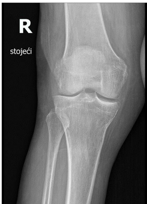
Slika 9.8.1. RTG koljena u stojećem položaju

Prikazuje se slučaj 67-godišnjaka koji je dvije godine prije pojave sadašnjih tegoba bolovao od septičkog artritisa desnog koljena. Prvi pregled učinjen je 10. 6. 2020. Bolesnik se žalio na bolove u vanjskoj strani desnog koljena te je naveo kako tegobe traju unatrag nekoliko mjeseci. Prilikom pregleda navodi kako je bolnost izražena tijekom aktivnosti te je njegovo funkcioniranje otežano. Za hod koristi štike kako bi olakšao prisutne tegobe. Na RTG snimci (Slika 9.8.1.) od dana 20. 6. 2020. prikazan je defekt hrskavice u području lateralnog kondila tibije uz edem subhondralne kosti tibije. U vanjskom dijelu lateralne zglobne površine patele prisutne su duboke fisure hrskavice.