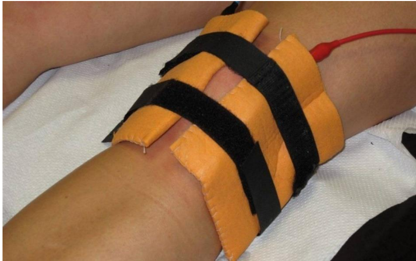
Slika 9.4.1.1. Primjena dijadinamske struje