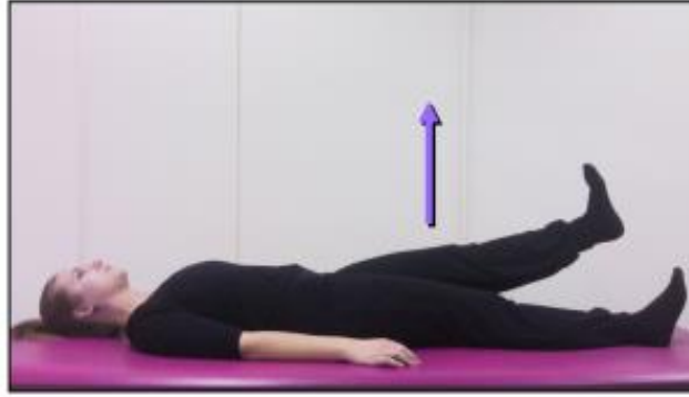
Slika 9.1.1.2. Statička vježba za jačanje donjih ekstremiteta