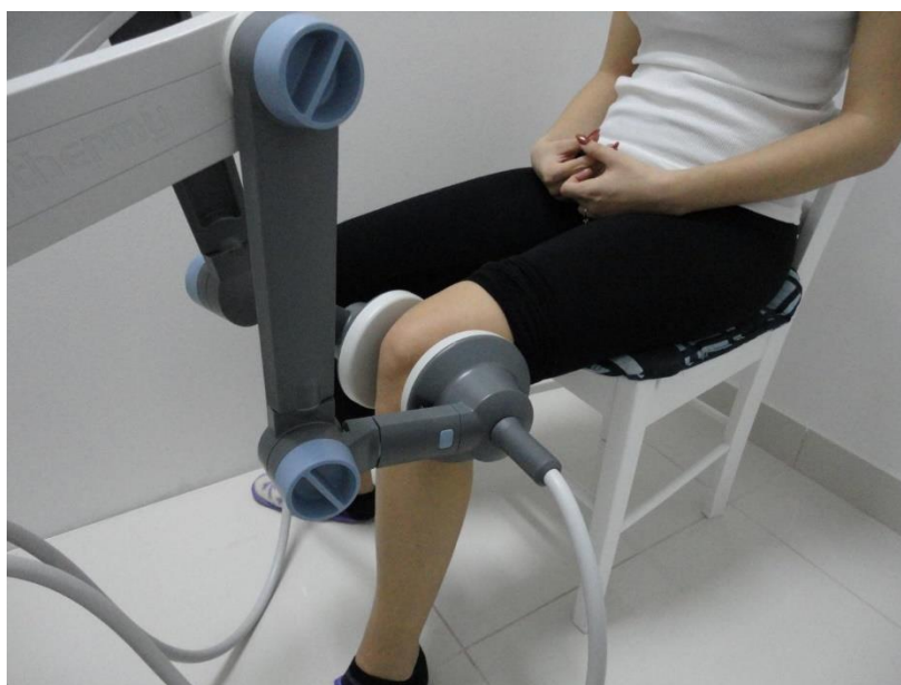
Slika 9.3.2.1. Prikaz položaja elektroda prilikom kratkovalne dijatermije

Kratkovalna dijatermija predstavlja primjenu visokofrekventne struje (10- 50 MHz) pri čemu dolazi do zagrijavanja tkiva. Djelovanje nastaje prolaskom elektromagnetskih valova pri čemu dolazi do apsorpcije i prijenosa energije u terapijsku toplinu. U terapijske svrhe primjenjuje se frekvencija aparata od 27,12 MHz. Tijekom procedure generatori kratkovalne dijatermije stvaraju dva strujna kruga između aparata i pacijenta. Učinak se postiže kapacitivnim i induktivnim aplikatorima. Prilikom zagrijavanja površinskih dijelova koriste se kapacitivni aplikatori, a za dublje zagrijavanje induktivni [24]. Prilikom primjene dijatermije kod osteoartritisa koljena u kondenzatorskom polju prednost se daje fiksnim elektrodama. Sama elektroda mora odgovarati segmentu na kojem se primjenjuje: u većini slučajeva jedna sa medijalne, a druga sa lateralne strane ili jedna sprijeda, a druga na poplitealnu jamu čime se dobiva zagrijavanje cijelog zgloba [17] (Slika 9.3.2.1.). Kod kroničnih tegoba daju se veće doze energije 3-5 puta tjedno, vremenski 10-20 minuta [23].