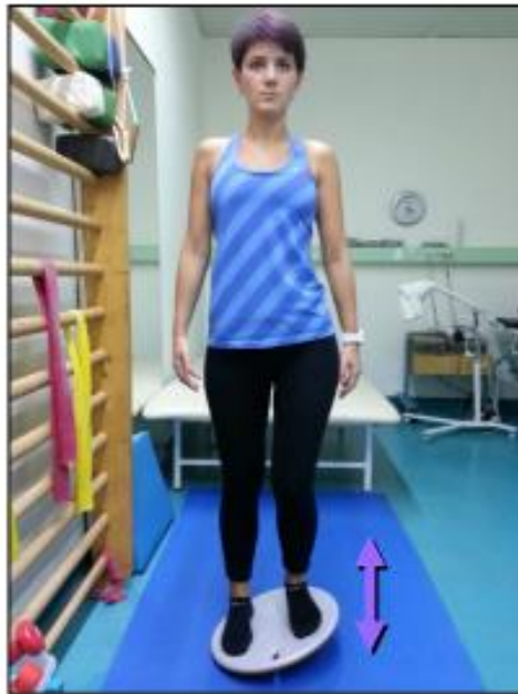
Slika 9.1.3.3. Vježba balansa u smjeru „lijevo-desno“

Položaj je stojeći na balansnoj dasci. Bolesniku se daje uputa da stane na obje noge te da prenosi težinu na jednu stranu, zadrži i vrati u početni položaj te ponovi sa suprotnom stranom [21] (Slika 9.1.3.3.).