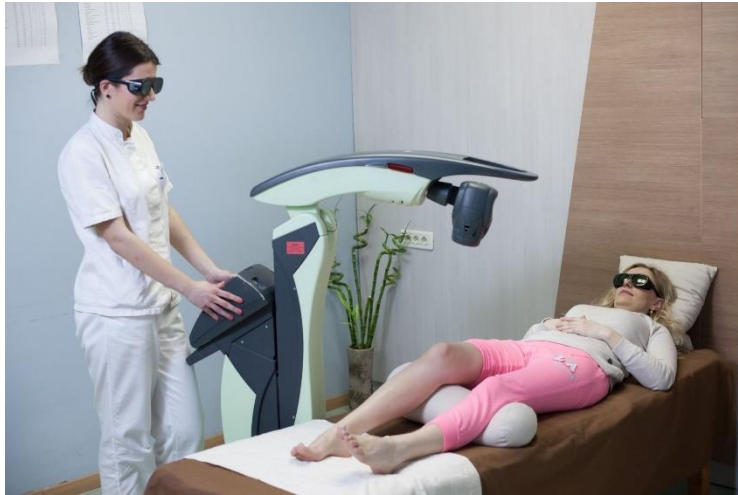
Slika 9.6.1. Primjena terapijskog lasera