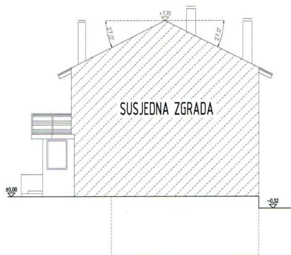
Slika 15. Pročelje jug

Pročelje jug prikazuje susjednu zgradu. (slika 15.)