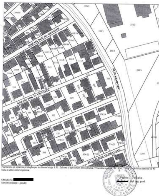
Slika 1. Izvod iz katastarskog plana

Građevine su podijeljene u 4 kategorije koje se razlikuju prema složenosti i veličini: