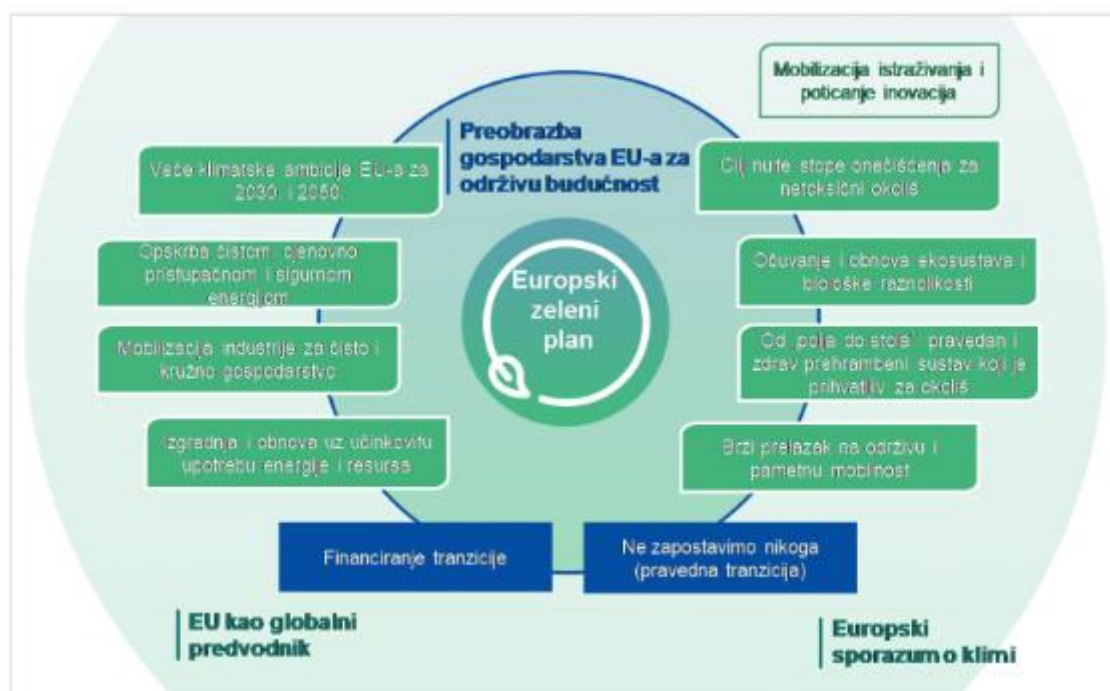
Slika 3. Odrednice Europskog zelenog plana