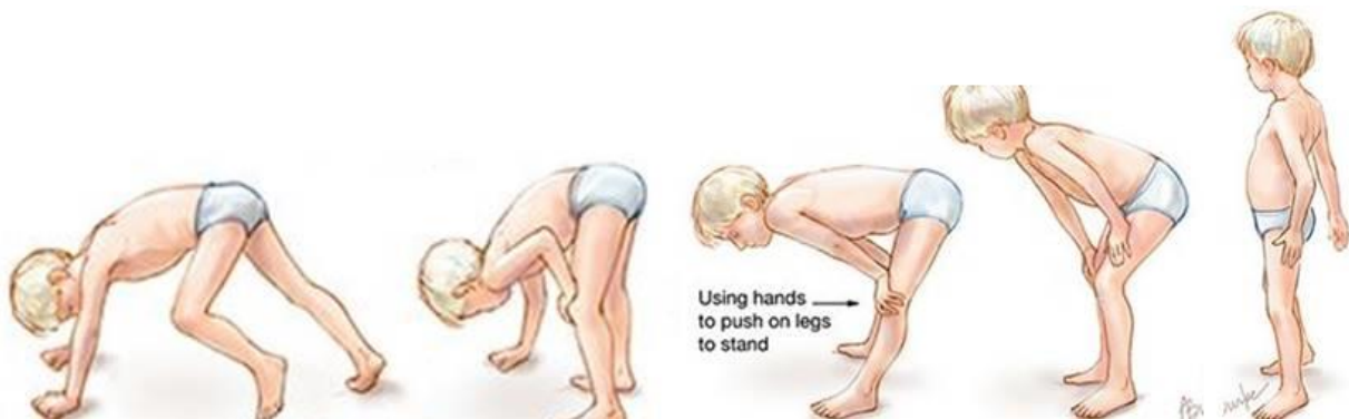
Slika 2.2.1. Gowersov znak

opisan specifičnim načinom ustajanja koji započinje otežanim ustajanjem iz čučnja, prilikom kojega prvi oslonac i uporište biva podloga nakon koje dijete vlastite ruke upire o svoje potkoljenice i natkoljenice kako bi se vertikaliziralo na noge [7].