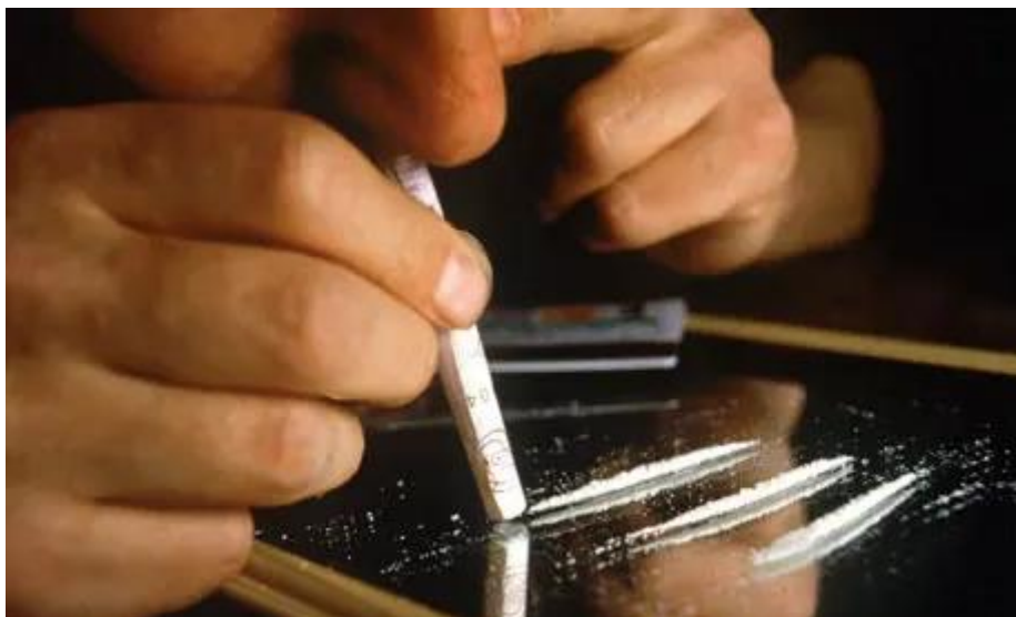
Slika 3.2.1.1. Ušmrkavanje kao jedan od načina konzumacije kokaina

je i prikazano na slici 3.2. pa upravo iz tog razloga njegovi konzumenti često dodiruju nos što se čini kao da ih nos svrbi ili da su prehladeni, no iza toga je drugačija pozadina [1].