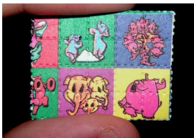
Slika 3.3.1.1. LSD

Djelovanje sintetičke droge LSD-a na konzumenta jače je gotovo sto puta nego djelovanje kokaina [6]. LSD se ubraja u halucinogene droge za koje se može reći kako mijenjaju opažanje kako izvanjskog, tako i unutarnjeg svijeta pojedinca [2]. LSD se najčešće konzumira gutanjem, “pojedinačna doza najčešće je papirić natopljen takvom kiselinom, površine oko pola cm 2 , na koji je ponekad utisnut neki specifičan znak (sličica) po kojemu tu drogu mladi i nazivaju” [1]. Osoba koja se nikada nije susrela s drogom ovoga tipa, nikada ne bi ni posumnjala da je riječ o nekoj psihoaktivnih tvari jer izgled uistinu u ovom slučaju može prevariti. Primjer LSD-a može se vidjeti u nastavku rada na slici 3.5..