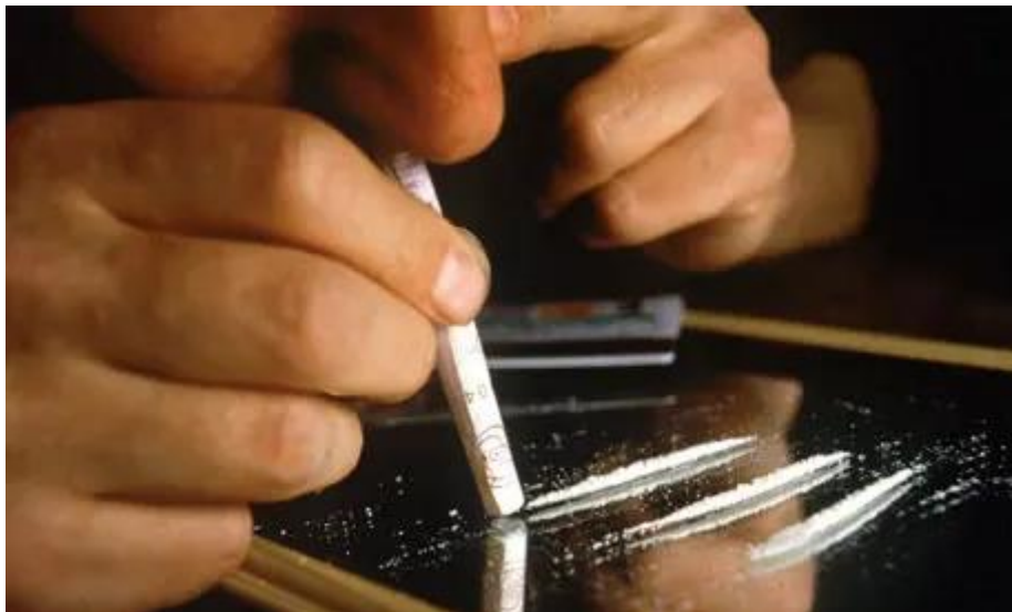
Slika 3.2.1.1. Ušmrkavanje kao jedan od načina konzumacije kokaina

je i prikazano na slici 3.2. pa upravo iz tog razloga njegovi konzumenti često dodiruju nos što se čini kao da ih nos svrbi ili da su prehladeni, no iza toga je drugačija pozadina [1].