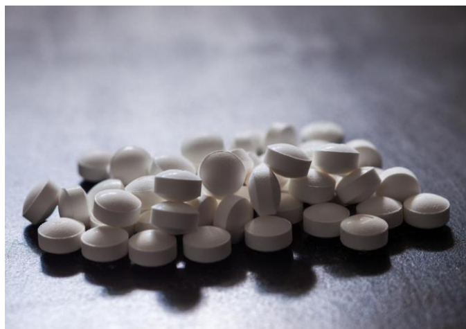
Slika 3.2.3.1. Amfetamin u tabletama