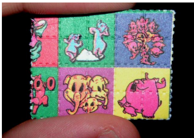
Slika 3.3.1.1. LSD

Djelovanje sintetičke droge LSD-a na konzumenta jače je gotovo sto puta nego djelovanje kokaina [6]. LSD se ubraja u halucinogene droge za koje se može reći kako mijenjaju opažanje kako izvanjskog, tako i unutarnjeg svijeta pojedinca [2]. LSD se najčešće konzumira gutanjem, “pojedinačna doza najčešće je papirić natopljen takvom kiselinom, površine oko pola cm 2 , na koji je ponekad utisnut neki specifičan znak (sličica) po kojemu tu drogu mladi i nazivaju” [1]. Osoba koja se nikada nije susrela s drogom ovoga tipa, nikada ne bi ni posumnjala da je riječ o nekoj psihoaktivnih tvari jer izgled uistinu u ovom slučaju može prevariti. Primjer LSD-a može se vidjeti u nastavku rada na slici 3.5..