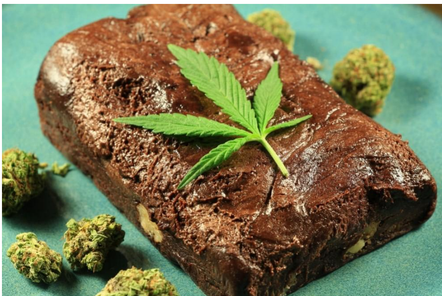
Slika 3.2.2.1. Kolačić s marihuanom poznatiji pod nazivom Space cookie