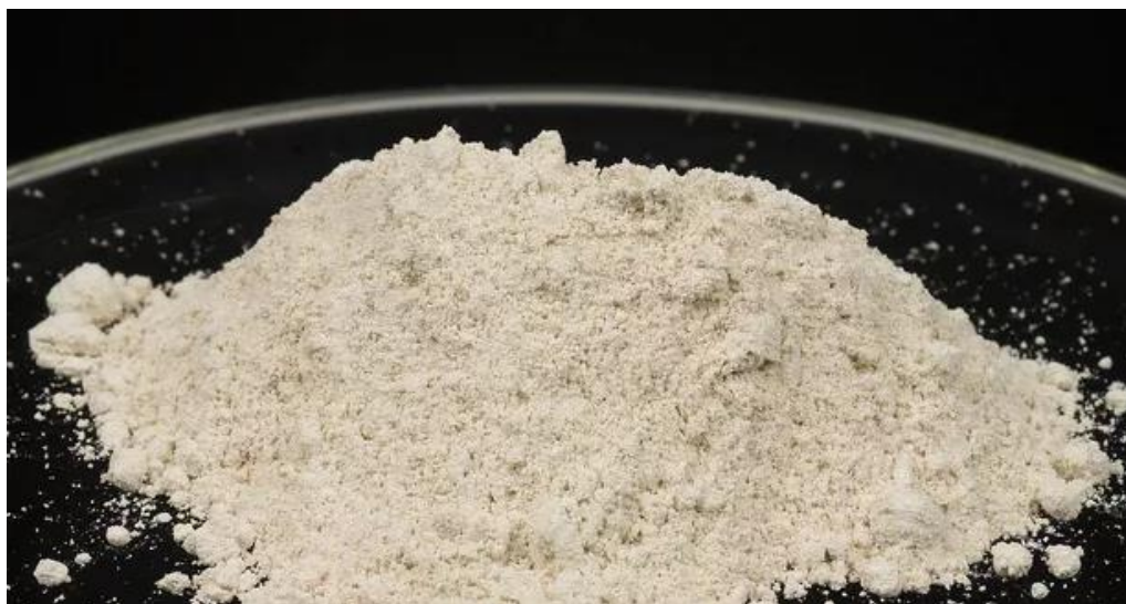
Slika 3.1.2.1. Heroin