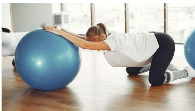
Slika 9.2. Prikaz vježbe istezanja gornjih ekstremiteta i trupa

Vježbe fleksibilnosti i istezanja preporučuju se prije aktivnosti, kako bi se smanjio mišićni umor ili prevenirala moguća ozljeda. Svaki period ovih vježbi izvodi se 5 minuta. Aerobnim vježbanja smanjuje se bol i umor, poboljšava se psihičko stanje, povećava rast kapilara u mišićima te se omogućava bolja regulacija apetita. Rekviziti koje trudnica može koristiti za vježbe snage obuhvaćaju utege, trake za vježbanje te pilates lopte. Cilj takvih vježbi je povećanje tonusa mišića, ligamenata i tetiva te gustoća kostiju. Vježbe za stabilnost trupa poboljšavaju gibljivost i osjećaj ravnoteže kao i stabilizaciju središta za ravnotežu [48].