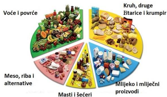
Slika 3.2.1. Prikaz DASH dijeta

udjelom ugljikohidrata, dijeta s niskim unosom nezasićenih masti, dijeta s visokim udjelom vlakana te dijeta na bazi soje.