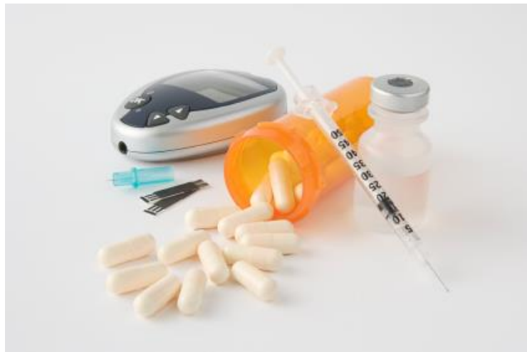
Slika 3.3.1. Prikaz inzulina i oralnih lijekova

odbijaju inzulin, mogu se propisati oralni lijekovi. Gilburid je povezan s neonatalnom hipoglikemijom i višom porođajnom težinom, što može povećati rizik od distocije ramena i potrebe za carskim rezom. Dodatno, pokazalo se da je gilburid prisutan u koncentracijama uzorka krvi iz pupkovine. Doza metformina počinje s 500mg oralno svake noći ili 600 mg dva puta dnevno na temelju kontrole glikemije. Maksimalna ukupna dnevna doza je 2500-3000 mg tijekom trudnoće. Gilburid započinje s 2,5 mg dnevno ili svakih 12 sati i postupno se povećava do najviše 10 mg dva puta dnevno, na temelju kontrole glikemije. U trudnoći se serumska koncentracija gliburida povećava oko 30-60 minuta nakon oralne primjene i vrhunac za 2-3 sata s vršnom koncentracijom koja se podudara s vrhuncem glukoze u krvi nakon obroka. Budući da gliburid dostiže vrhunac 2-3 sata nakon primjene više vrijednosti glukoze u krvi mogu se primijetiti kada se provjeravaju 1 ili 2 sata nakon obroka, uz smanjenje nakon toga [27].