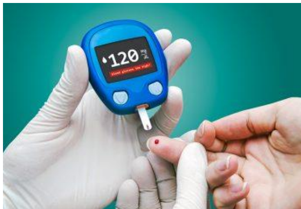
Slika 2.5.1. Prikaz testa probira šećera u krvi uzimanog iz prsta (IZVOR:

Sustavnim ispitivanjem šećera u mokraći, praćenjem težine majke i volumena ploda kod svakog ultrazvučnog pregleda može se otkriti dijabetes [24]. Kako dijagnoza gestacijskog dijabetesa nije poznata prije trudnoće, potrebno je u rizičnoj skupini trudnica obaviti probir i prema dobivenim vrijednostima postaviti dijagnozu[3]. Postoji nekoliko testova za otkrivanje dijabetesa. Najčešće korišteni test je test oralnog opterećenja glukozom odnosno oGTT test. Ostali testovi koji se koriste su obična pretraga šećera u krvi, test probira šećera u krvi uzimanog iz prsta, test glukoze natašte, test glikoliziranog hemoglobina te pretraga mokraće [4].