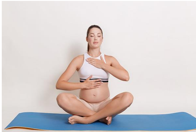
Slika 9.3. Prikaz vježbe disanja pomoću pritiska ruku

Vježbe disanja su jedne od najvažnijih vježbi u trudnoći. U trudnoći dolazi do povećane potrošnje kisika gdje posljedično dolazi do veće potrebe unosa kisika. Za što kvalitetniji obrazac disanja potrebno je vježbati mišiće koji su zaslužni za disanje, a to su dijafragma, trbušni mišići i međurebreni. Važno je naučiti trudnicu pravilnom disanju, kako bi mogla tijekom poroda kontrolirati i izbjeći strah ili napad panike. Relaksacija trudnice dovodi do stanja „unutarnjeg mira“. Yoga predstavlja vrstu vježbanja u kojoj je naglasak na disanju [48].