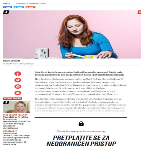
Slika 4.1.3.2. Primjer naslova na portalu Jutarnjeg lista