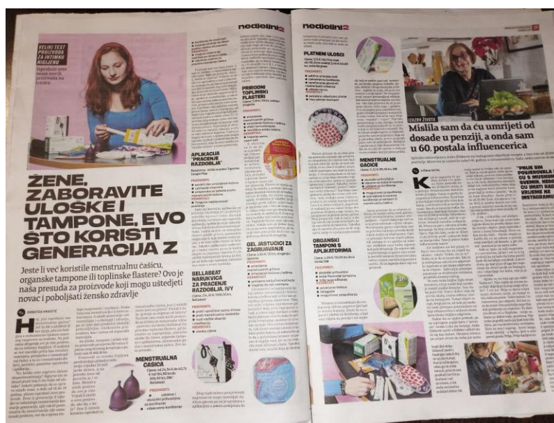
Slika 4.1.3.1. Primjer naslova u tiskanom izdanju N2