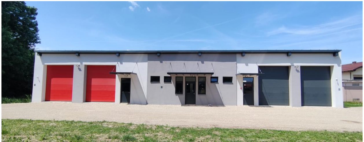
Slika 9. Završena 1. faza izgradnje Vatrogasnog spremišta