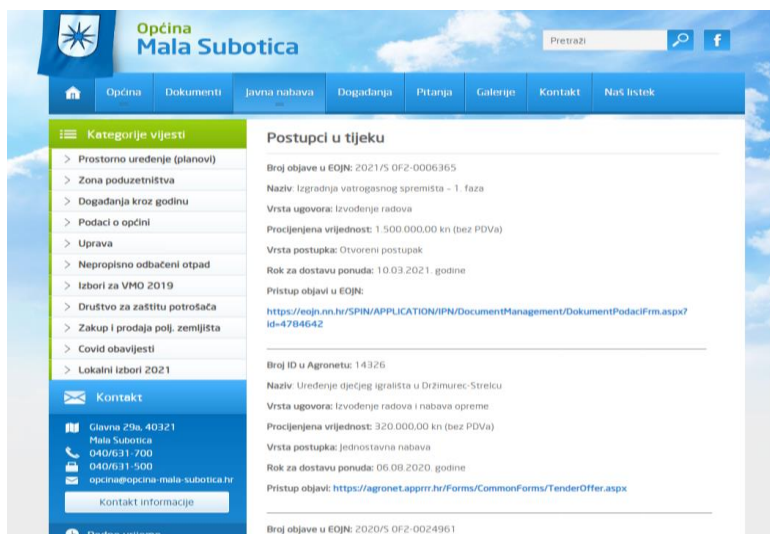
Slika 3. Objava javnog nadmetanja na službenoj stranici jedinice lokalne samouprave

medijima, ali ne prije dana slanja objave EOJN RH. Na slici 3. prikazan je postupak javne nabave za izgradnju vatrogasnog spremišta – 1. faza na službenoj stranici Općine Mala Subotica.