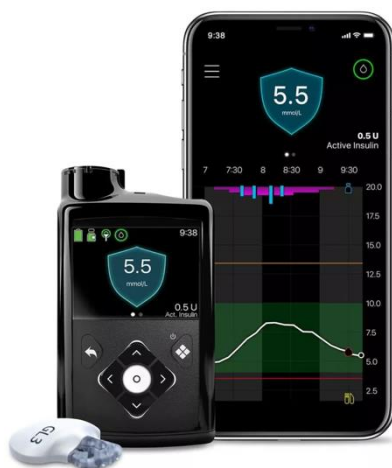
Slika 2.3.1. MiniMed 780G inzulinska pumpa

Inzulinski set se najčešće postavlja na trbuh 2 cm dalje od pupka, madeža ili ožiljaka, međutim, važno je mijenjanje mjesta za postavljanje inzulinskog seta zbog mogućnosti nastanka lipohipertrofičnih zadebljanja. Mjesta na koja se još može postaviti su bedra, nadlaktice i kod male djece gornji dio stražnjice. U slučaju da se pojavi krv u kanili potrebno je promijeniti infuzijski set jer zgrušana krv može otežati isporuku inzulina. Važno je upozoriti pacijenta na mogućnost povećanja tjelesne težine, a tome mogu prethoditi veća sloboda u planiranju jelovnika te manji i kraći broj hiperglikemija. Zbog toga je ponekad potrebno smanjiti dnevnu kalorijsku vrijednost obroka. Sljedeća stvar oko koje je bitno voditi računa je mogućnost istjecanja inzulina, što posljedično može dovesti do hiperglikemije ili DKA, na istjecanje može upozoriti karakterističan miris inzulina. Prilikom RTG, MR i CT pumpu je potrebno skinuti. Također, pacijente je potrebno uputiti da prilikom putovanja imaju sa sobom rezervni set i baterije, zalihe inzulina, pen, veću količinu potrošne opreme, glukagon, dekstrozu te liječničku potvrdu kod putovanja avionom [2].