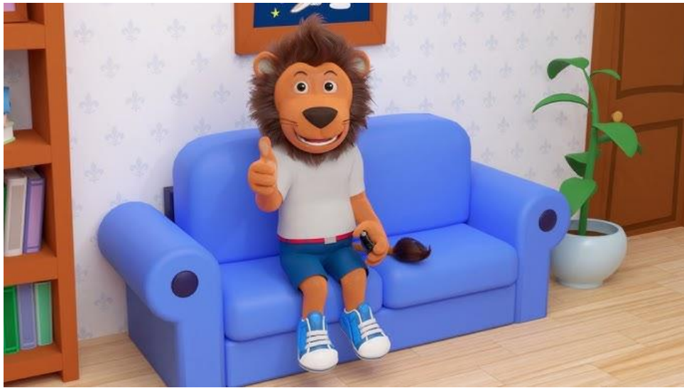
Slika 6.1. Animirani lik Lenny