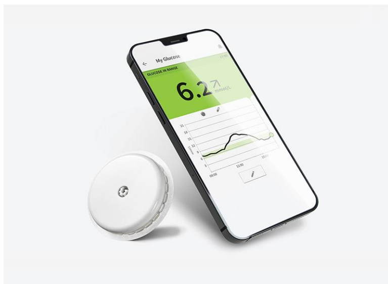
Slika 2.1.1. Prikaz CGM sustava