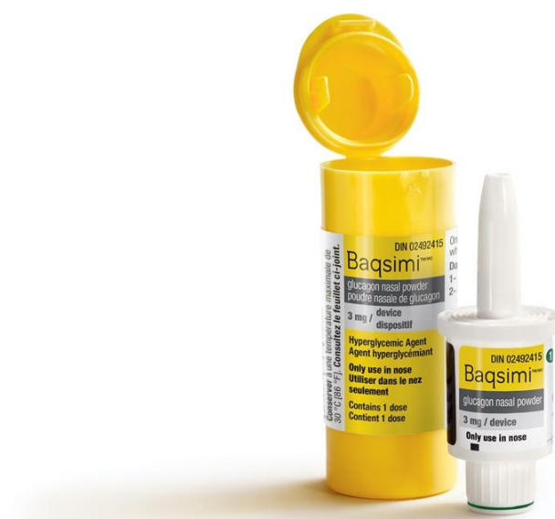
Slika 2.4.1. Baqsimi glukagon

Pacijenti s dijabetesom tipa 1 (T1D) na inzulinskoj terapiji izloženi su većem riziku nastanka hipoglikemije, hitno po život opasno stanje kod dijabetesa. Hipoglikemija može uzrokovati teško kognitivno oštećenje (uključujući komu i napadaje) koje zahtijeva pomoć od strane druge osobe. Osim intravenske injekcije glukoze od strane zdravstvenih djelatnika, liječenje hipoglikemije se sastoji od supkutane ili intramuskularne injekcije glukagona koju može primijeniti član obitelji ili osoba koja se nađe neposredno u blizini pacijenta. Međutim, danas umjesto injekcije glukagona postoji intranazalna primjena, odnosno glukagon u spreju. Intranazalna primjena 3 mg glukagona pokazala se jednako učinkovitom kao supkutana ili intramuskularna injekcija 1 mg glukagona u istraživanjima koja su provedena na odraslim i mladim pacijentima s T1D. Također, istraživanja su pokazala veću sklonost nazalnom glukagonu zbog njegove jednostavne i brze upotrebe. Nazalni glukagon (Baqsimi) nudi nove perspektive za hitno liječenje teške hipoglikemije i hipoglikemijske kome [12].