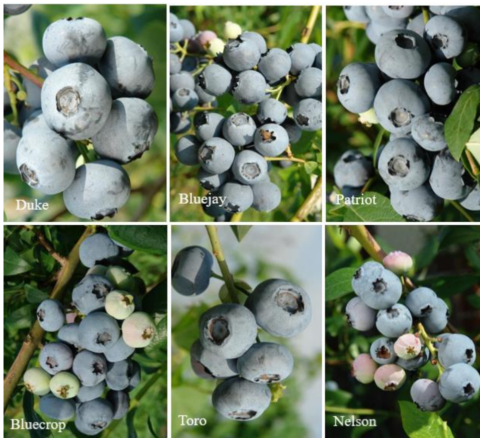
Slika 4. Sorte borovnica pogodne za ekološku proizvodnju

Nelson je sorta koja dozrijeva kasno, no izuzetno je produktivna. Daje velike plodove čvrste konzistencije i karakterističnog okusa [9,16].