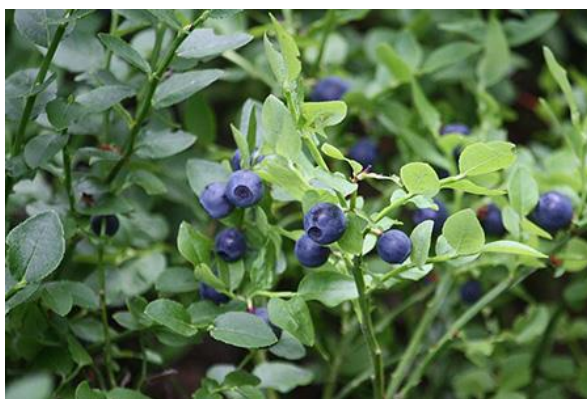
Slika 2. Izgled europske borovnice, izvor:

V. myrtillus L. najrasprostranjenija je u bjelogoričnim i crnogoričnim šumama brdskih krajeva Hrvatske u kojima niče sama te zbog teške prilagodbe nije pogodna za komercijalni uzgoj. Ime je dobila prema svojim listovima koji su manji, no oblikom slični listovima mirte. Ova vrsta se opisuje kao nizak i razgranat listopadni grm koji raste u visinu do 50 cm, ima puzav korijen i stabljike sa okruglastim listovima. Cvatnja se odvija od lipnja do kolovoza što ovisi o prostoru na kojem raste, a karakteriziraju je svijetlo ružičasti cvjetovi. Dozrijevanjem nastaje plavo-crni plod veličine pet do osam milimetara [1].