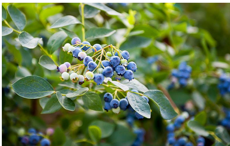
Slika 3. Izgled američke borovnice

V. corymbosum je višegodišnja drvenasta biljka koja naraste do dva metra i iz koje je selektivnim razmnožavanjem dobiven velik broj sorata borovnica koje se danas uzgajaju u svijetu, pa tako i u Hrvatskoj. Ovu vrstu obilježava biljka razgranatog korijena i stabljike sa jajolikim duguljastim listovima cjelovitog ruba na kojima su vidljive dlačice. Listovi su u zimskim mjesecima tamno crveni dok s dolaskom toplijih mjeseci poprimaju tamno zelenu boju. Cvjetovi ove vrste cvatu u proljeće, a plodovi dozrijevaju od šezdeset do devedeset dana nakon početka cvatnje te poprimaju tamnoplavu boju[1].