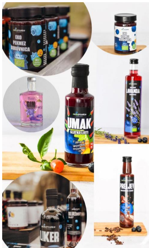
Slika 7. Pekmez, gin, umak, sirup, liker i preljev od ekološke borovnice

proizvodnju sokova, preljeva, umaka, vina, čajeva, likera, džemova i voćnih namaza te kao dodatak jogurtu, dječjim kašicama, sladoledu i kolačima [9,15] (Slika 7).