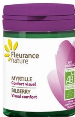
Slika 10. Dodatak prehrani s ekstraktom ekološke borovnice

Zbog sastava bioaktivnih sastojaka koji imaju mnoge pozitivne učinke na zdravlje ekstrakt borovnice se primjenjuje u farmaceutskoj i kozmetičkoj industriji kao sastojak krema, kapi za oči, dodataka prehrani, sirupa i drugih ljekovitih pripravaka (Slika 10.). Ekstrakt europske borovnice utječe pozitivno na vid i poboljšava cirkulaciju krvi dok ekstrakt američke borovnice djeluje povoljno na urinarni trakt i poboljšava moždanu funkciju [19,20].