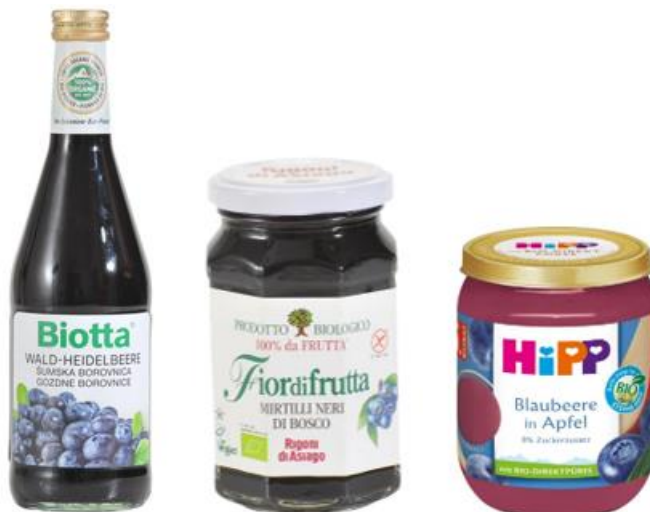
Slika 9. Sok, voćni namaz i dječja kašica od ekološke borovnice, izvor:

Tijekom pasterizacije finalnih proizvoda, kao što su sokovi, voćni namazi i kašice (Slika 9.), kako bi se inaktivirali mikroorganizmi i osigurala zdravstvena ispravnost hrane dolazi do manjeg gubitka bioaktivnih spojeva borovnice, no često dolazi do promjene okusa samog proizvoda. Čuvanje proizvoda od borovnice utječe na gubitak bioaktivnih spojeva te ih je najbolje čuvati u hladnjaku na niskim temperaturama. [21,30].