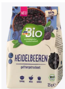
Slika 8. Osušene ekološke borovnice, izvor: https://www.dm.hr/dmbio-susene-borovnice-p4066447366891.html

Veliki nedostatak kod obrade borovnica u industriji predstavlja primjena topline, izloženost kisiku i upotreba enzima koji uzrokuju značajne gubitke bioaktivnih spojeva, osobito antocijana. Borovnice se mogu osušiti (Slika 8), no kod sušenja vrućim zrakom dolazi do gubitka znatnih količina antocijana. Sušenjem na temperaturi od 70 °C dolazi do gubitka oko 30% antocijana iz borovnica [21,30].