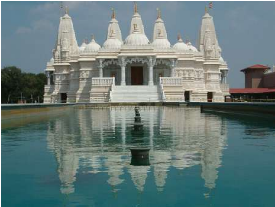
Slika 3b, Baps Hindu Temple; izvor:

http://www.sachigroup.net/projectimages/religious/small/BAPS-Chicago.jpg , download:10.8.2015.)