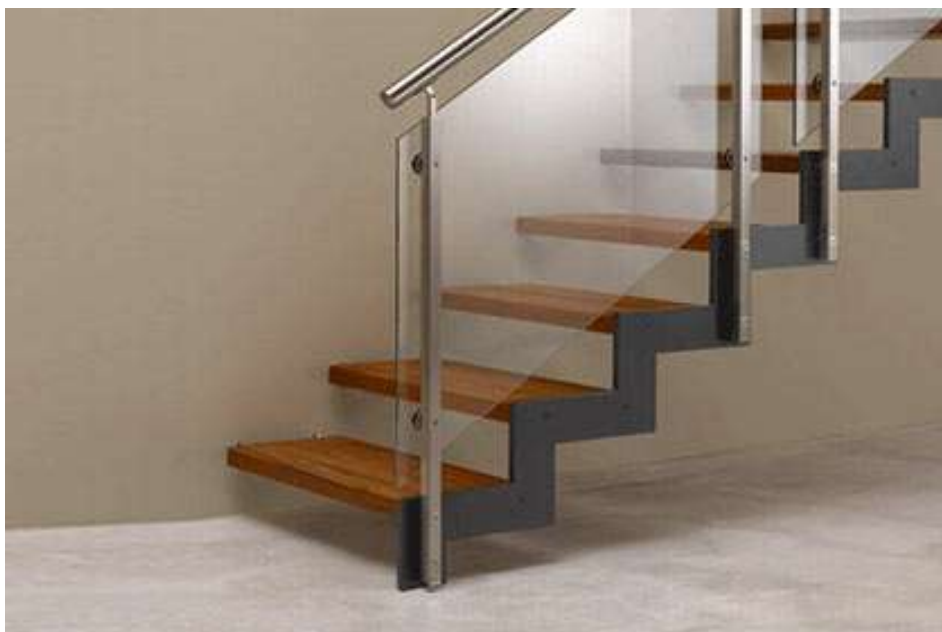
Slika 2c, Stakleno stubište; (Izvor: http://www.gradimo.hr/blobs/ee2149e7-2a09-4e69-a6af-b43fc91438c0.jpg , download: 7.7.2015.)

Osnovni princip održivog razvoja u graditeljstvu je korištenje što manje prirodnih resursa i stvaranje što manje po Zemlju štetnog otpada. Zaštita okoliša i ušteda energije postaju svjetski problemi u svim poljima tehnologije. Pri teorijskom razmatranju održivosti postoje četiri aspekta: ekološki, tehnološki, ekonomski, sociološki, a svaki od navedenih aspekata sadrži još niz podgrupa ili skupova.