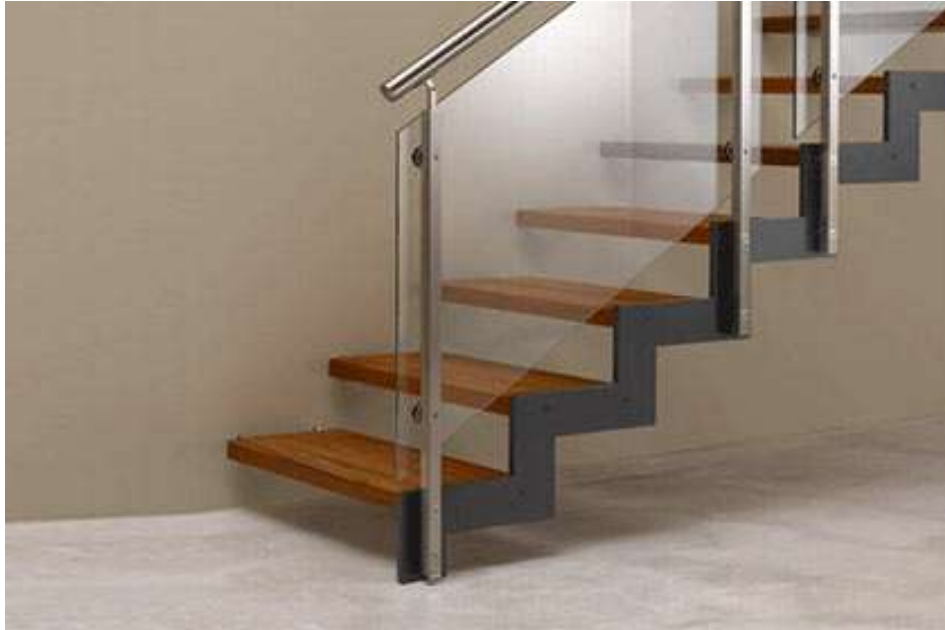
Slika 2c, Stakleno stubište; (Izvor: http://www.gradimo.hr/blobs/ee2149e7-2a09-4e69-a6af-b43fc91438c0.jpg , download: 7.7.2015.)

Osnovni princip održivog razvoja u graditeljstvu je korištenje što manje prirodnih resursa i stvaranje što manje po Zemlju štetnog otpada. Zaštita okoliša i ušteda energije postaju svjetski problemi u svim poljima tehnologije. Pri teorijskom razmatranju održivosti postoje četiri aspekta: ekološki, tehnološki, ekonomski, sociološki, a svaki od navedenih aspekata sadrži još niz podgrupa ili skupova.