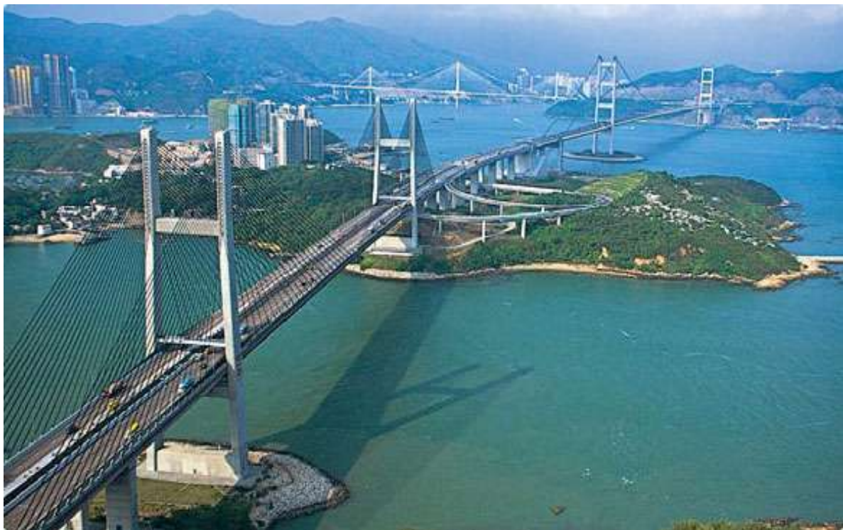
Slika 3a, Tsing Ma Bridge, izvor:

http://www.epd.gov.hk/epd/misc/ehk04/english/hk/images/pic04.jpg , download: