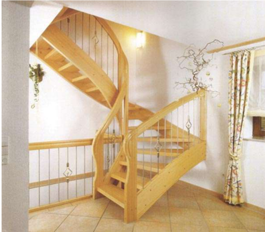
Slika 2b, Drveno stubište; (Izvor: http://metro-portal.hr/img/repository/2008/05/web_image/stepe2.jpg , download: 7.7.2015.)

jele ili smreke, nije pogodno za izradu stepenica i zamjenjuje se tvrdim drvom, poput hrasta i bukve, koji se odlikuju dugotrajnošću i ne zahtijevaju puno brige u vezi s održavanjem.