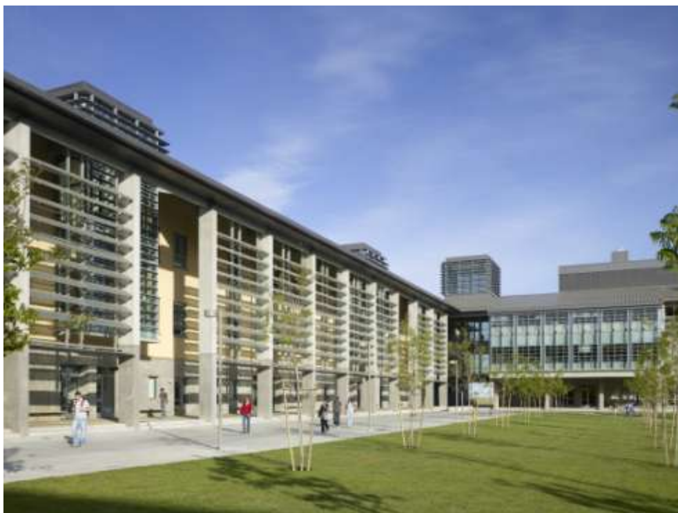
Slika 3c, Citris Building