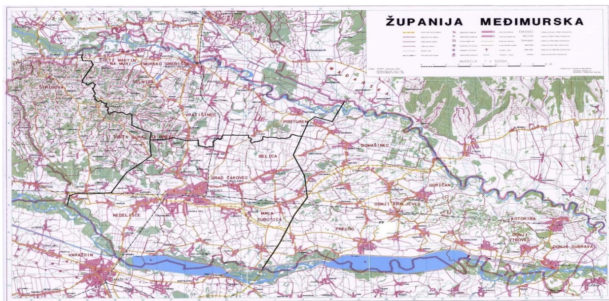
Slika 12.1.1. Karta Međimurske županije

Međimurska županija smještena je na sjeverozapadu Hrvatske. Područje je na krajnjem sjeveru Hrvatske omeđeno rijekama Murom i Dravom. Zapadni dio dotiče obronke Alpa, dok su središnji i istočni dio ravnica (Panonske nizine). Pokrajina graniči s državama Mađarskom i Slovenijom, a vrlo blizu je i treća zemlja, Austrija. Obuhvaća područje od oko 729.58 km 2 , na kojem obitava oko 105.250 stanovnika. Stanovništvo živi u 131 naseljenom mjestu koja su prema ustroju lokalne uprave i samouprave podijeljena u 22 općine i 3 grada. Najveće naselje po broju stanovnika je grad Čakovec s 15.147 stanovnika. Gustoća naseljenosti iznosi 155,99 stanovnika na km 2 pa je Međimurska županija jedno od najgušće naseljenih područja u Republici Hrvatskoj. Na području Županije nalazi se i dvanaest romskih naselja u kojima prebiva oko 7.000 osoba romske nacionalnosti (70).