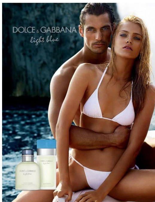
Slika 6 – apel na seks na oglašavačkom posteru za parfem Light blue marke D&G

Na slici 6 prikazano je korištenje apela na seks na oglašavačkom posteru za parfem Light Blue marke Dolce&Gabbana.