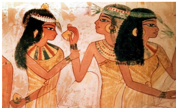
Slika 2. znanstvenica Tapputi

Povijest parfema svjedoči o njihovoj dubokoj vezi s kulturom, estetikom i identitetom ljudi kroz različite epohe i kulture. Tapputi, znanstvenica, bila je prvi zabilježeni proizvođač parfema. Priče o proizvođaču parfema otkrivene su na mezopotamskoj glinenoj pločici, što implicira da je Tapputi izumila parfem negdje tijekom drugog tisućljeća prije Krista. Slika 1. prikazuje znanstvenicu Tapputi jednu od prvih kemičarki, čije se ime kao proizvođača parfema spominje s klinastim pismom datirano oko 1200. pr. Kr. u babilonskoj Mezopotamiji.