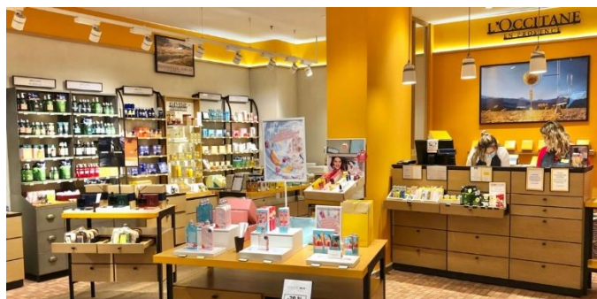
Slika 9 – vizualni izgled trgovine L'occitane

Slika 9 prikazuje vizualni dizajn trgovine kozmetičkih proizvoda branda L'occitane, čiji se cjelokupni vizualni identitet uspješno implementira i nadopunjuje. Proces vizualne prezentacije proizvoda povezan je u cjelinu, od dizajna ambalaže proizvoda, pa sve do vizualnog izgleda trgovine.