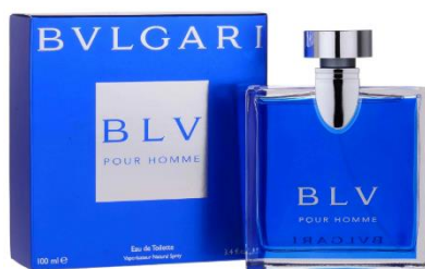
Slika 10 – ambalaža parfem Blue Bvlgari