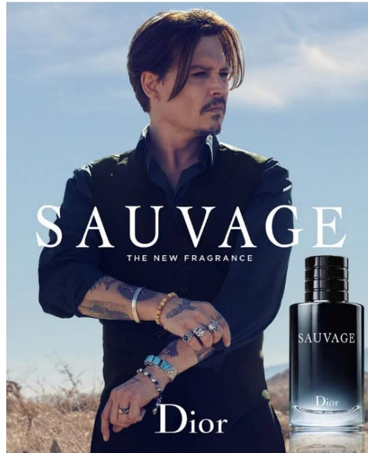
Slika 5 – primjer imidža slavne osobe na oglasu za parfem