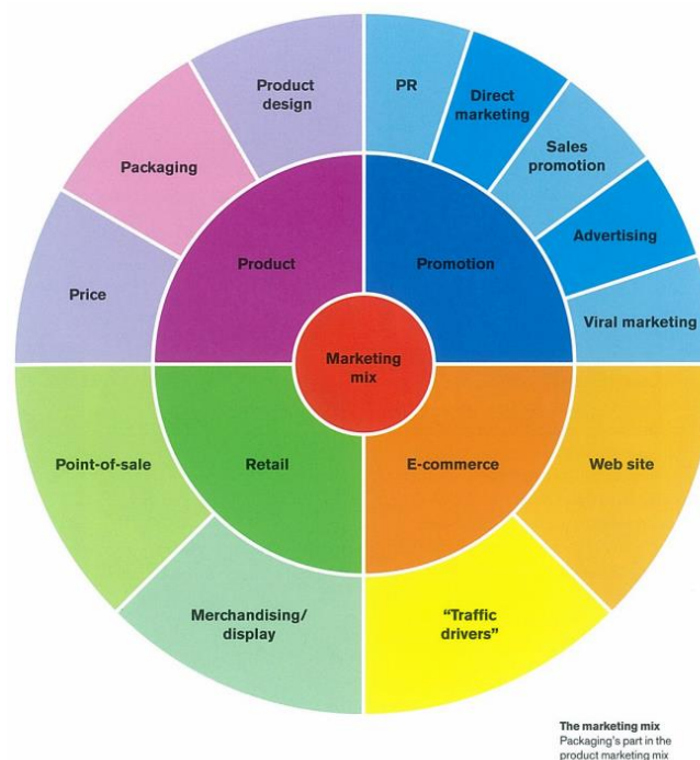
Slika 12 – uloga ambalaže u marketinškom miksu

Dizajn ambalaže dio je i marketinškog miksa ili 4P, koji se sastoji od : proizvoda, cijene, distribucije i promocije, dizajn pakiranja izravno je vezan uz proizvod.