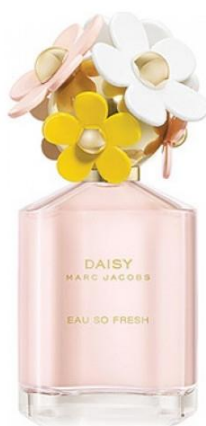
Slika 13 – Marc Jacobs parfem Daisy

Vizualni dojam trebao bi odgovarati identitetu marke, ciljanoj publici i cjelokupnoj ideji mirisa. Ambalaža može biti čista i jednostavna, prenoseći modernu eleganciju, ili ukrašena i detaljna, prikazujući luksuz i nasljeđe. Korišteni materijali, boje, završni slojevi i teksture trebaju biti u skladu s osobnošću mirisa i željenim položajem.