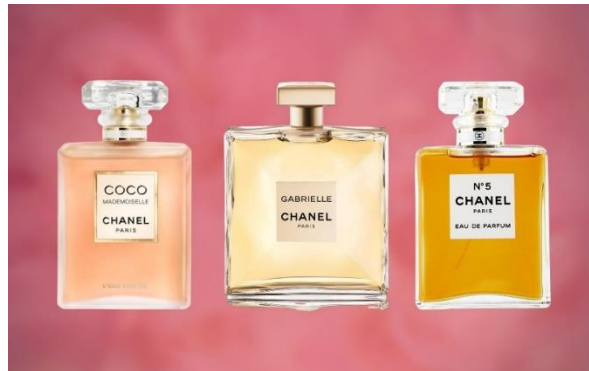
Slika 8 – Chanel i ambalaža parfema

Na slici 8 prikazani su različiti parfemi marke Chanel. Jasno je vidljivo kako je dizajn pakiranja konzistentan, iako se radi o različitim parfemima. Potrošaču se šalju informacije o kojoj se marki radi, iako nije isti tip parfema u pitanju. Ovim primjerom je jasno potvrđena snažna uloga dizajna ambalaže kod raspoznavanja proizvoda i identifikacije određene marke i estetike koju predstavlja.