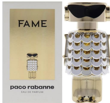
Slika 11 – Paco Rabanne ambalaža parfema