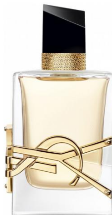
Slika 14 – Yves Saint Laurent parfem Libre

Slika 14 prikazuje dizajn bočice Libre parfema, Yves Saint Laurent