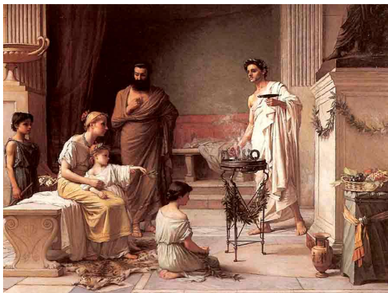
Slika 3 – Svećenik i mirisne masti

Gornje note brzo ispare, srednje note traju nešto duže, dok bazne note ostaju na koži najdulje. Ova promjena tijekom vremena dodaje dubinu i složenost mirisu.