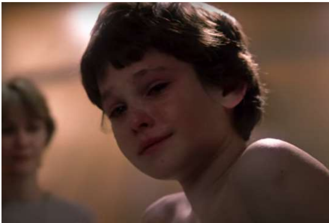
Slika 1: Elliot, film „E.T.“ (1982.)

Jedno od obilježja Spielbergova vizualnog pripovijedanja je to što se kamerom usredotočuje na emocije svojih likova, umjesto da samo uhvati radnju na ekranu. Smatra se da je njegov način korištenja kamere i posebnih kutova ključno za emocionalan učinak njegovih filmova gdje emocije hvata na pravi i intiman način. [16] Stevenova posvećenost detaljima, emocionalna dubina i sposobnost prenošenja složenih emocija čine njegove likove srodnima i duboko ljudskima, a sposobnost stvaranja dijaloga između likova zapravo daje publici bitan faktor kod promatranja scena na ekranu i sveukupne emocionalne povezanosti s likovima, te tako dobivamo i samu vezu između publike i likova na ekranu. Ova veza omogućuje gledateljima da emocionalno urone u priču, čineći kinematografsko iskustvo još impresivnijim. Prikazivanje emocija na ekranu je uvijek bio jedan od najboljih elemenata u Spielbergovim filmovima, bilo da se radi o radosti ili tuzi, strahu ili uzbuđenju, ljubavi ili mržnji.