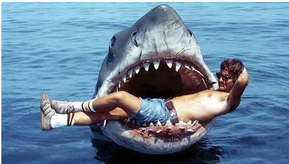
Slika 5: Spielberg u raljama mehatroničke lutke morskog psa Bruce-a na snimanju filma „Jaws“ (hrv. „Ralje“, 1975. g.)

U „Close Encounters of the Third Kind“ (hrv. „Bliski susreti treće vrste“) Spielberg koristi kombinaciju praktičnih efekata i revolucionarnih vizualnih efekata kako bi prikazao susret između ljudi i izvanzemaljskih bića. [16] Ovakav spoj praktičnih i vizualnih efekata omogućuje Spielbergu da neprimjetno integrira fantastične elemente priče sa stvarnim svijetom, pojačavajući osjećaj nadmoćnosti i nevjerice.