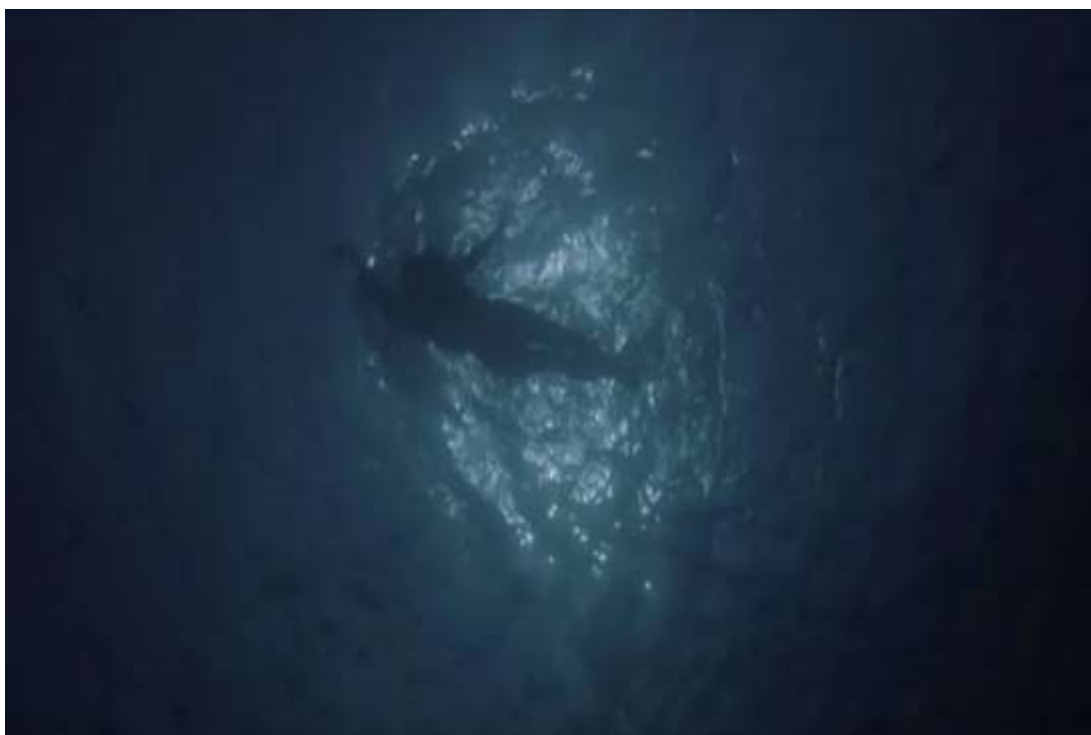
Slika 2: „Jaws“ (hrv. „Ralje“) (1975.)

kadriranje igraju važnu ulogu u napetosti i neizvjesnosti u njegovim filmovima. Maleni detalji kojima on pridaje važnost zapravo omogućuju nama kao publici vidjeti stvari njegovim očima. U čemu zapravo možemo primijetiti kako je pridavao pažnju svemu, posebice publici koja će to gledati na ekranima. Tako možemo vidjeti da je u filmu „Jaws“ (hrv. „Ralje“) koristio snimke iz žablje perspektive kako bi naglasio napetost i neposrednu blizinu morskog psa i tako povećao i napetost i strah kod gledatelja. [16] Ovakva perspektiva u duetu s njegovom pričom zapravo daje dobar efekt i pokazuje nam sposobnost Spielbergovog pričanja i prijenosa priče na nas ostale.