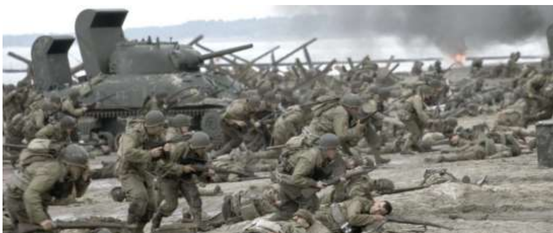
Slika 4: „Saving Private Ryan“ (hrv. „Spašavanje vojnika Ryana“) (1998.)

U filmu „Saving Private Ryan“ (hrv. „Spašavanje vojnika Ryana“) Spielberg majstorski uključuje povijesne događaje kako bi poboljšao narativ i izazvao duboke emocionalne reakcije publike, a uz to uključuje i upotrebu simbolizma. Jedan od tih je prikaz američke zastave kao simbola patriotizma i žrtve, upotreba plaže Omaha kao simbola brutalnosti i junaštva rata i portret Dana D kao ključni trenutak u povijesti. Kroz ove simbole, Spielberg ne samo da priča uzbudljivu priču, već istražuje i dublje teme hrabrosti, žrtve i prave cijene rata.