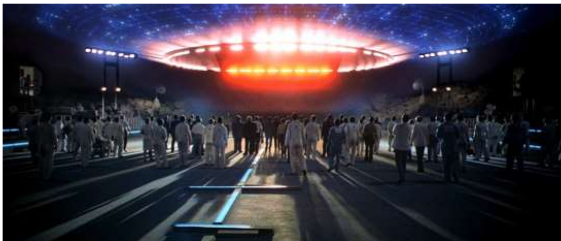
Slika 6: „Close Encounters of the Third Kind“ (hrv. „Bliski susreti treće vrste“, 1977. g.)

Upotrebom CGI-ja, kao što smo prije spomenuli, u poznatim filmovima Spielberga, zapravo je otvorilo put i postao sastavni dio buduće kinematografije. Na taj način pomaže oživjeti priče na ekranu, isto kao što smo mi imali priliku vidjeti kako su dinosauri oživjeli. Evolucija CGI-ja u filmu bila je izvanredno putovanje koje je promijenilo način na koji se filmovi stvaraju i doživljavaju. Napredak u računalno generiranim slikama preveo je industriju od upotrebe animatronike do glatkih prijelaza. U ranim danima snimanja filmova animatronika je bila glavna tehnika za stvaranje specijalnih efekata. To je uključivalo upotrebu mehaničkih lutaka i modela kojima se ručno upravljalo da oponašaju pokrete i radnje. Trenutno, CGI omogućava stvaranje realističnih i fantastičnih vizuala koji nisu bili ograničeni ograničenjima fizičkih modela. [19]