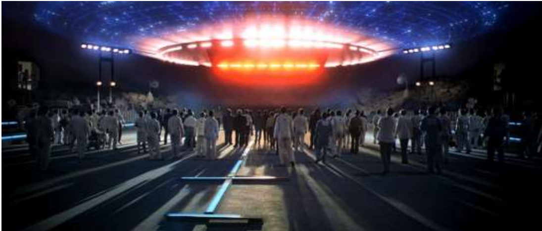
Slika 6: „Close Encounters of the Third Kind“ (hrv. „Bliski susreti treće vrste“, 1977. g.)

Upotrebom CGI-ja, kao što smo prije spomenuli, u poznatim filmovima Spielberga, zapravo je otvorilo put i postao sastavni dio buduće kinematografije. Na taj način pomaže oživjeti priče na ekranu, isto kao što smo mi imali priliku vidjeti kako su dinosauri oživjeli. Evolucija CGI-ja u filmu bila je izvanredno putovanje koje je promijenilo način na koji se filmovi stvaraju i doživljavaju. Napredak u računalno generiranim slikama preveo je industriju od upotrebe animatronike do glatkih prijelaza. U ranim danima snimanja filmova animatronika je bila glavna tehnika za stvaranje specijalnih efekata. To je uključivalo upotrebu mehaničkih lutaka i modela kojima se ručno upravljalo da oponašaju pokrete i radnje. Trenutno, CGI omogućava stvaranje realističnih i fantastičnih vizuala koji nisu bili ograničeni ograničenjima fizičkih modela. [19]