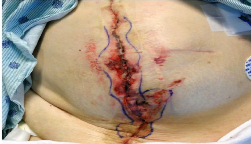
Slika 1: Primjer površinske infekcije kirurškog mjesta s nekrotičnim rubovima

Centar za kontrolu bolesti (CDC) klasificira SSI na tri vrste: površna incizijska infekcija (koža i potkožje), duboka incizijska infekcija (fascija, mišić i dr.) i infekcija tjelesnih prostora ili organa [9,10]. Rizik od razvoja SSI procijenjen je na 4% kod čistih i 35% kod značajnije kontaminiranih rana [9].