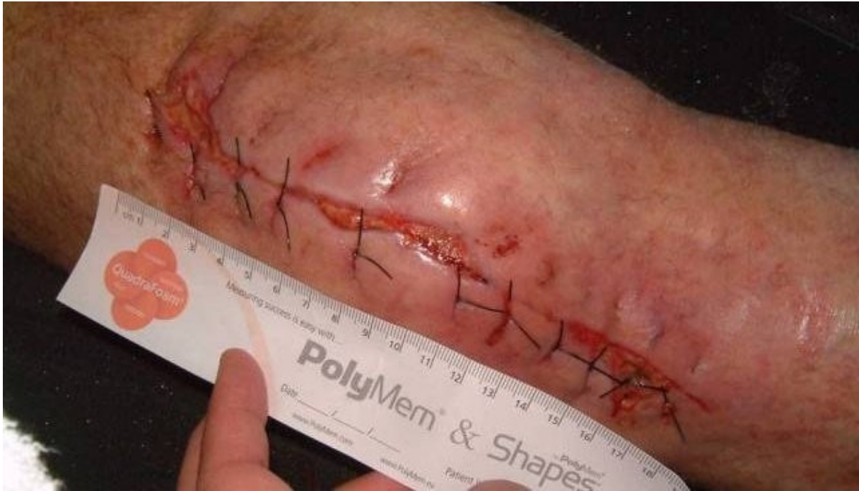
Slika 2: Infekcija kirurškog mjesta nakon operacije koljena

pacijent se treba istuširati i oprati tijelo sapunom. Ne preporuča se koristiti lokalne antimikrobne proizvode kako bi se smanjio rizik od infekcije [4].