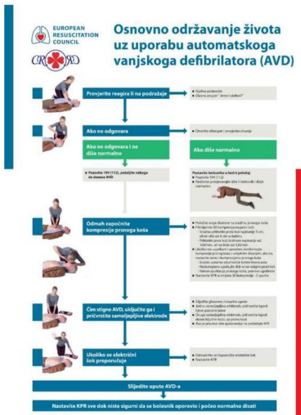
Slika 2.2.2. Algoritam za zdravstvene djelatnike za osnovno održavanje života odraslih (BLS) prema međunarodno dogovorenim smjernicama