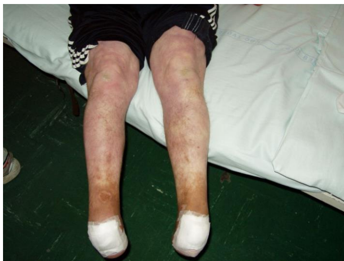
Slika 5.3.1. Prikaz amputiranih stopala, izvor: https://protesismg.com/hr/medicinska-i-ortopedska-enciklopedija-mg/amputacije-dijabetičkog-stopala/