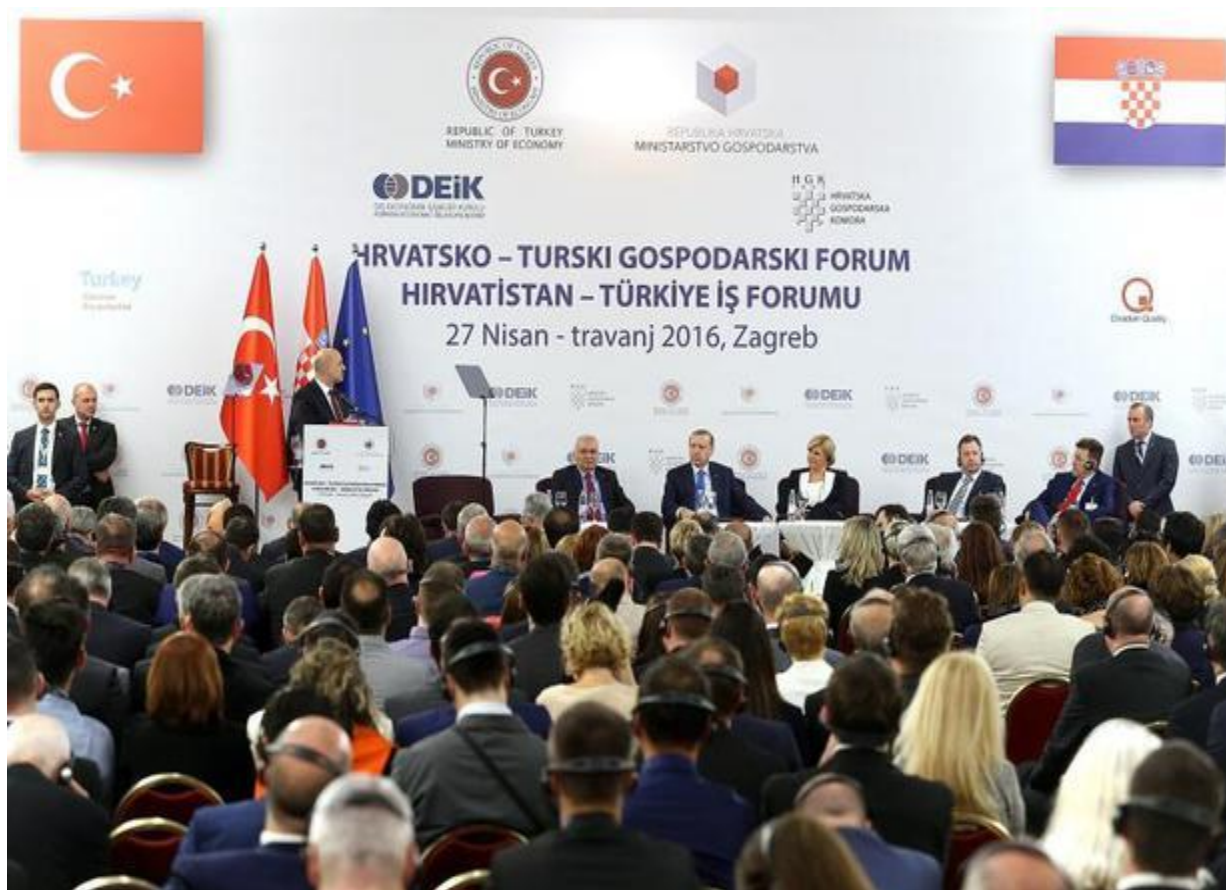
Slika 24. Hrvatsko-turski gospodarski forum