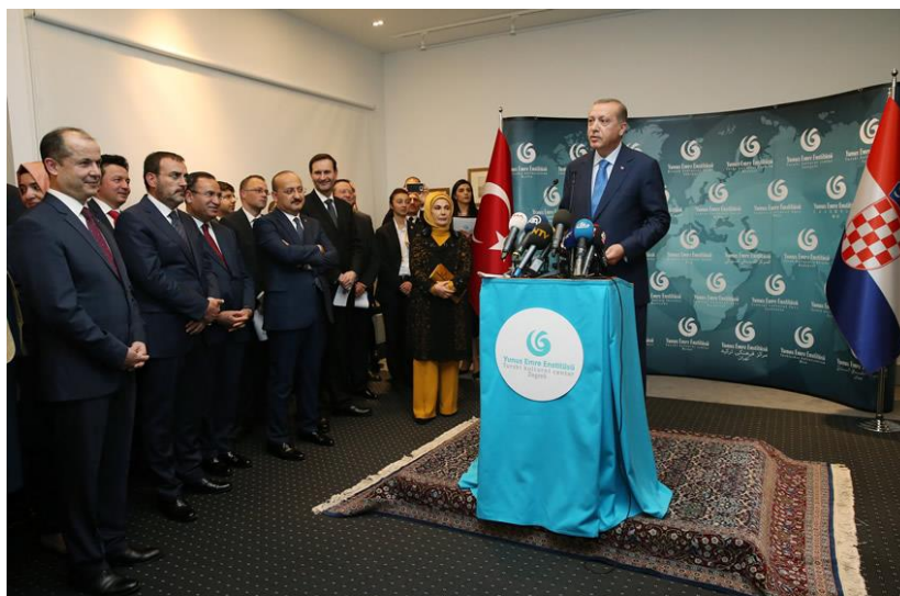
Slika 31. Prigodno obraćanje predsjednika Turske