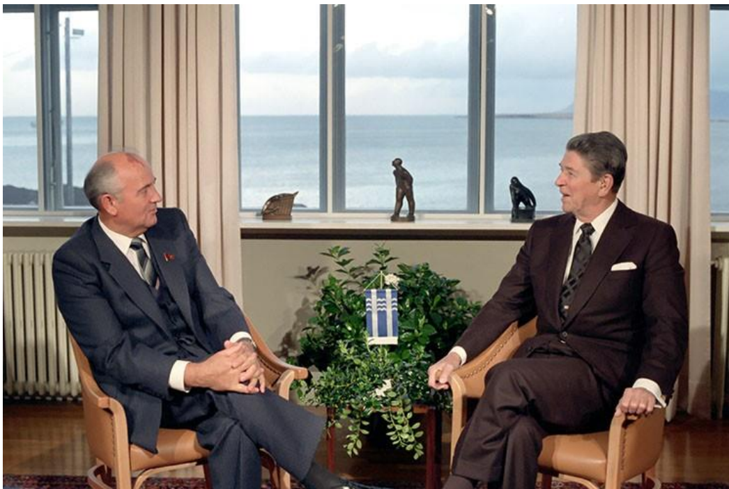
Slika 1. Reagan i Gorbačov na Summitu u Reykjaviku