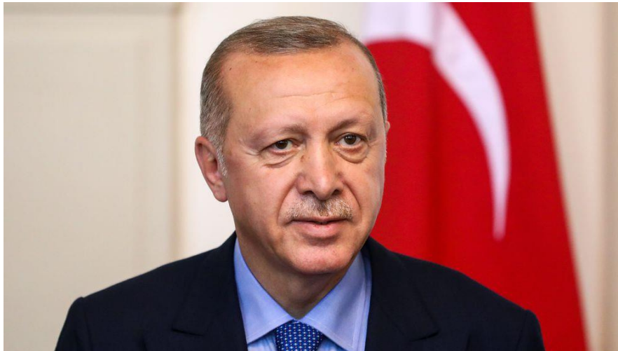
Slika 9. Recep Tayyip Erdoğan