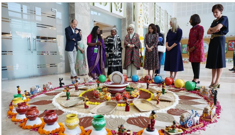
Slika 8. Program za supružnike

Program za supružnike odnosi se na specifičnu inicijativu ili politiku koja je osmišljena da odgovori na potrebe i brige supružnika u određenom kontekstu ili okruženju. Ovo je obično uobičajeno da supruga vođe izaslanstva sudjeluje samo u određenim komponentama službenog posjeta, naime ceremonijama dolaska i odlaska, kao i društvenim okupljanjima. Očekuje se da će zemlja domaćin organizirati poseban program za supružnike, koji se obično sastoji od obilaska znamenitosti, osim ako postoji drugačiji aranžman. Razmatranje individualnih želja i interesa supružnika trebalo bi ovisiti o sposobnostima institucije koja prima. Supružnika tijekom zasebnog programa prati službenik protokola ustanove domaćina. Program je tako bio organiziran i za vrijeme G20 Summita u Indiji u 2023. godini. Na slici su prikazane prve dame ili supruge predsjednika Vlade koji sudjeluju na G20 u posjetu muzeju u New Delhiju.