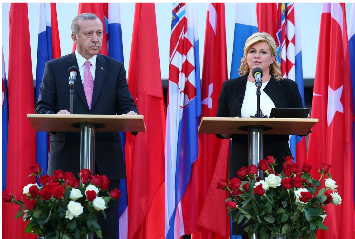
Slika 20. Izjave dvoje predsjednika za predstavnike sredstava javnog priopćavanja