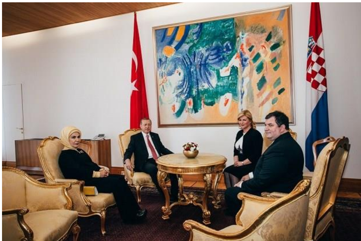
Slika 19. Zajednička fotografija dvoje predsjednika i supružnika