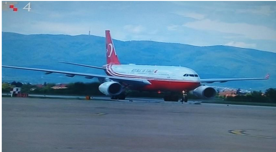
Slika 11. Slijetanje Međunarodna zračna luka Zagreb