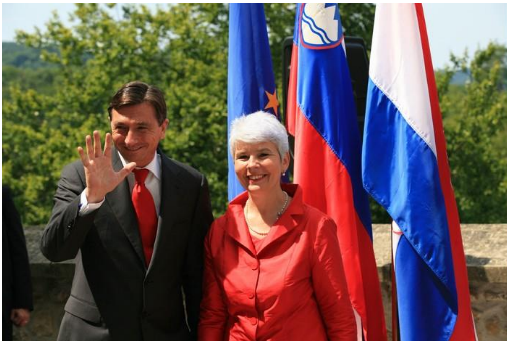
Slika 4. Prvi susret Pahor i Kosor – Trakošćan 2009.