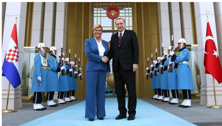
Slika 10. Posjet bivše hrvatske predsjednice Republici Turskoj