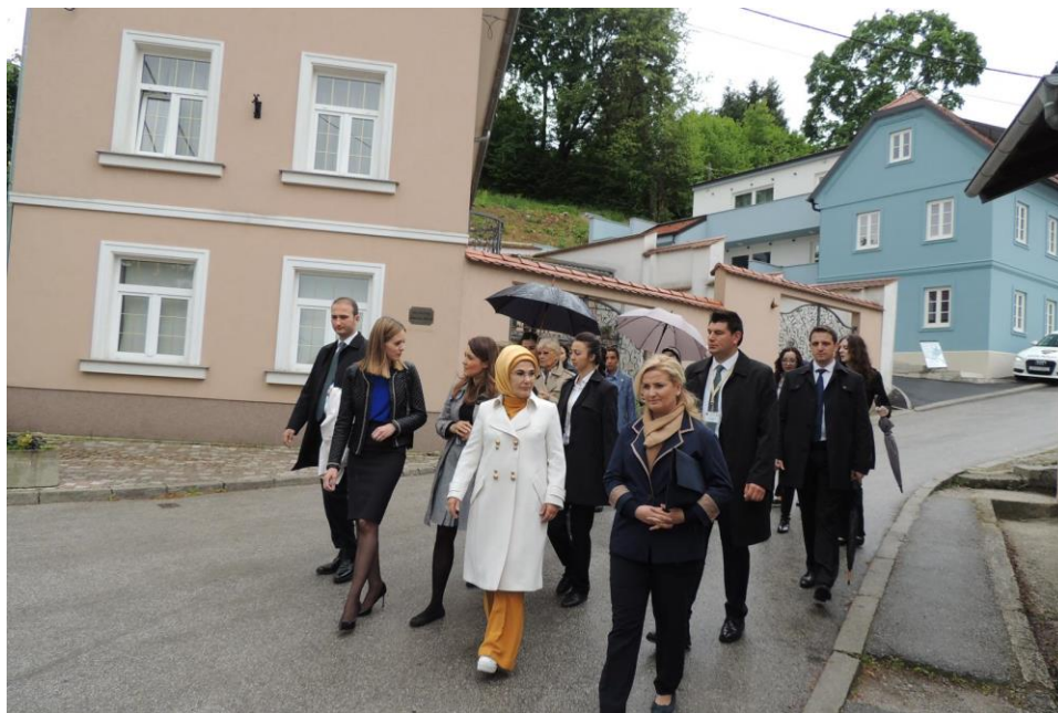
Slika 23. Obilazak grada Samobora