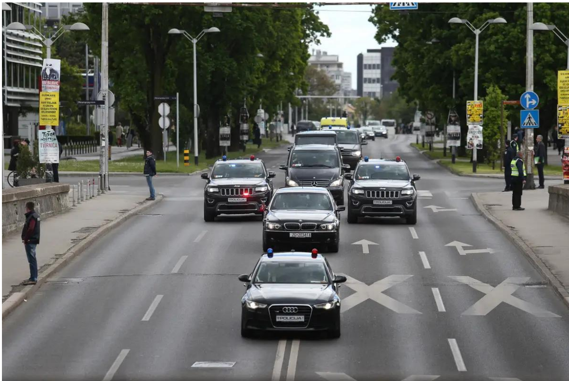
Slika 13. Štićena kolona Miramarska