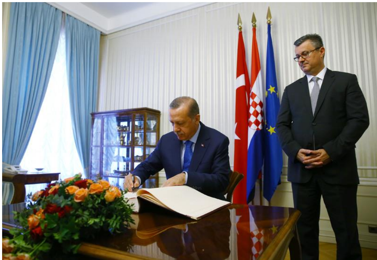
Slika 26. Upisivanje u Zlatnu knjigu