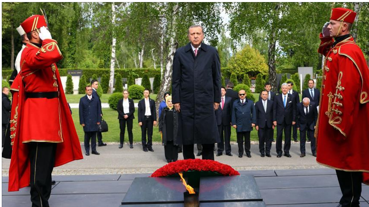
Slika 15. Ceremonija polaganja vijenaca

Po dolasku do Spomen-obilježja „Glas hrvatske žrtve – Zid boli“ Predsjednik Republike Turske i supruzi prilazi zapovjednik i pozdravlja ih sabljom. Zapovjednik se okreće te ga slijede dvojica vojnika koji nose vijenac. Predsjednik Republike Turske sa suprugom ih prati te dolaskom do mjesta polaganja vijenaca vojnici stavljaju vijenac na stalak i zauzimaju stav pozor. Predsjednik Republike Turske tada pristupa vijencu, popravlja trake te se odmiče nekoliko koraka unatrag i stoji, kao što je prikazano na slici 15.