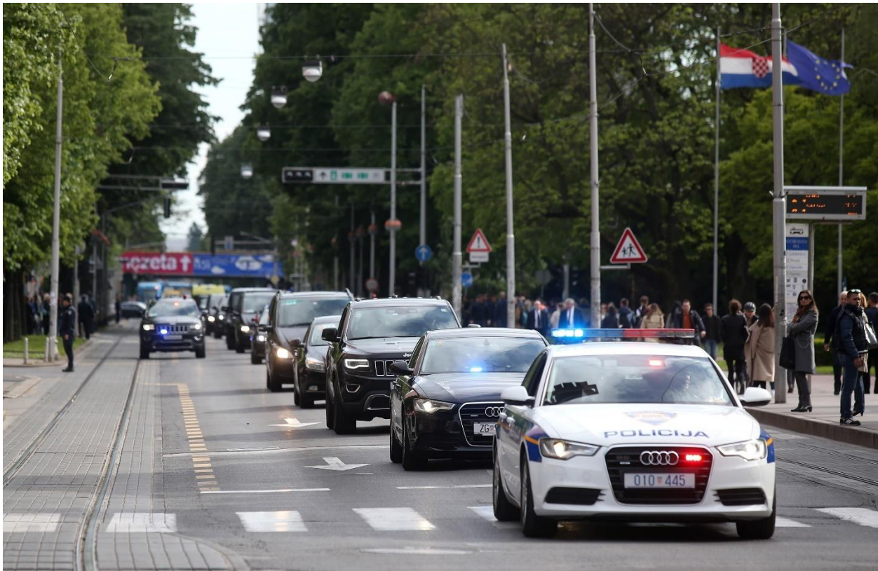
Slika 14. Savska