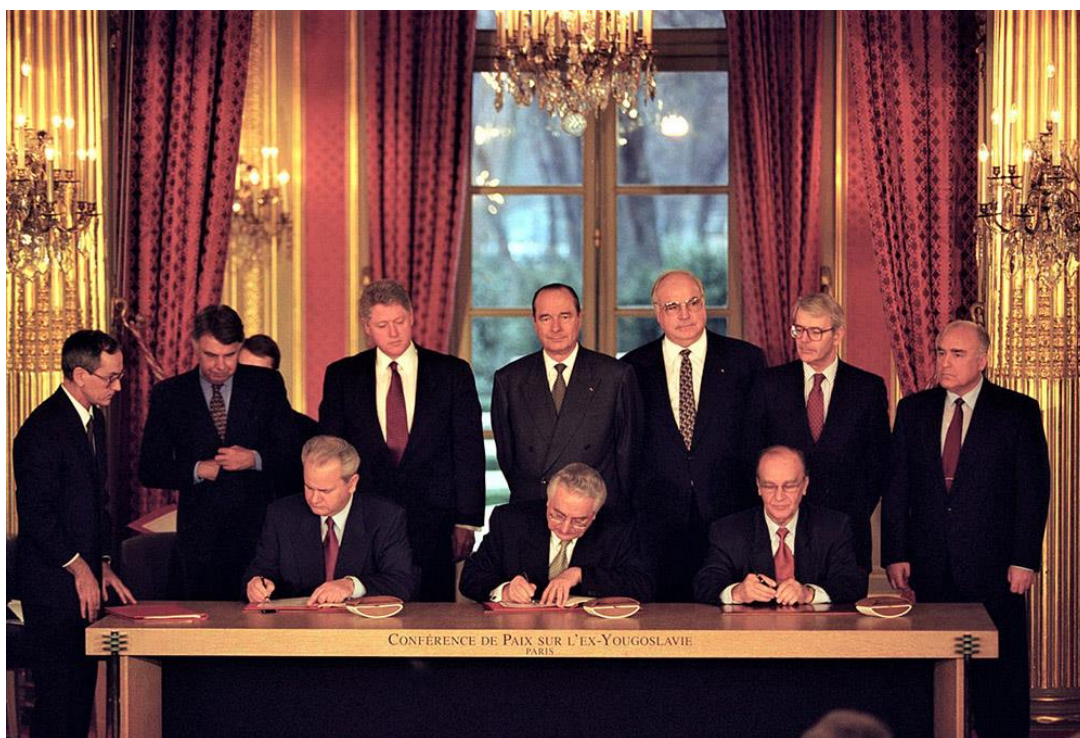
Slika 2. Daytonski mirovni sporazum