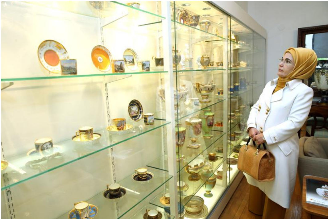
Slika 21. Razgledavanje muzeja