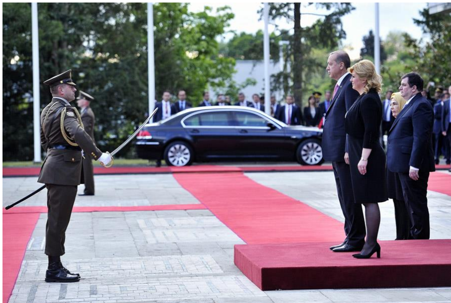
Slika 17. Predaja prijavka