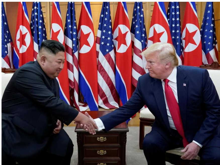
Slika 3. Susret predsjednika SAD-a i vrhovnog vođe Sjeverne Koreje