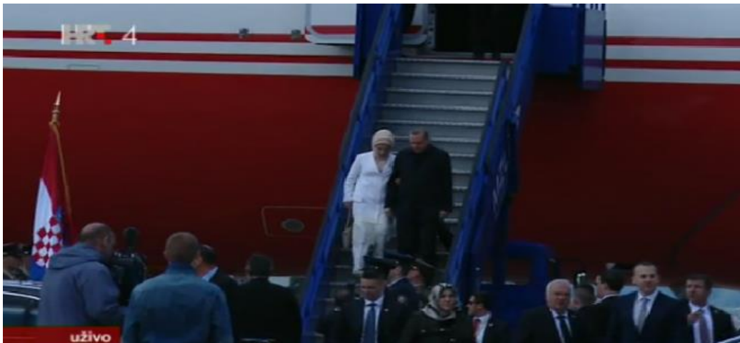
Slika 12. Doček predsjednika Turske i prve dame