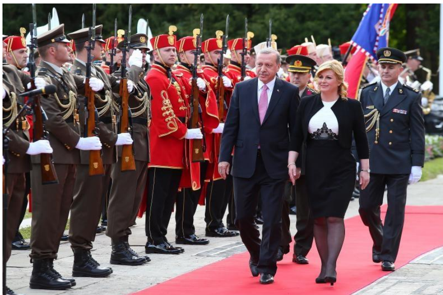
Slika 18. Počasno zaštitna bojna