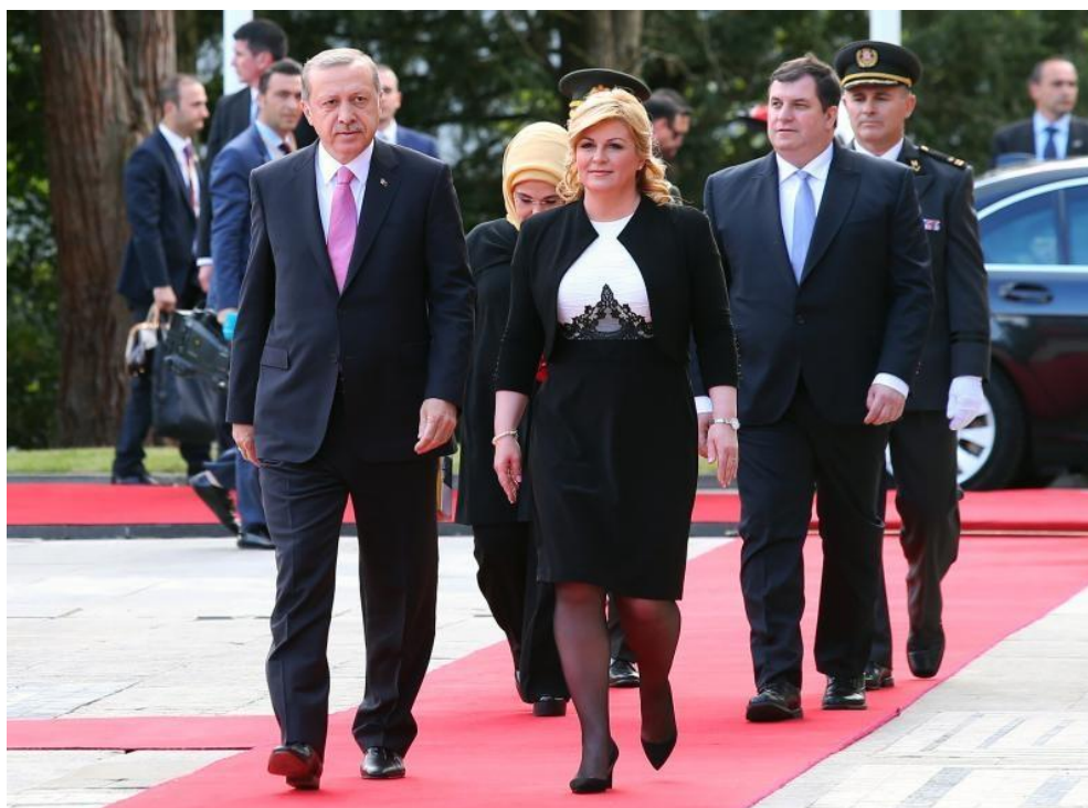
Slika 16. Dolazak na Pantovčak