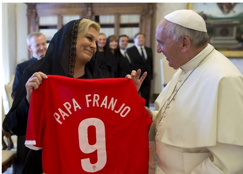
Slika 7. Posjet papi Franji i dar