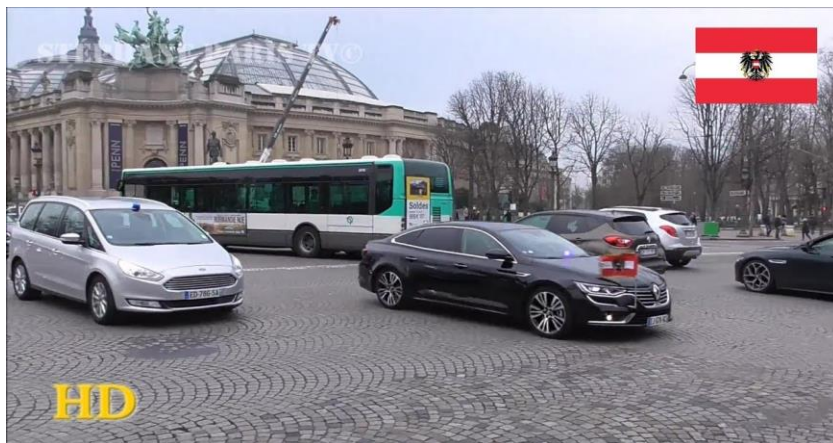
Slika 6. Delegacija Austrija