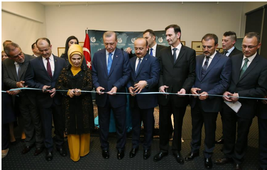
Slika 30. Svečano rezanje vrpce