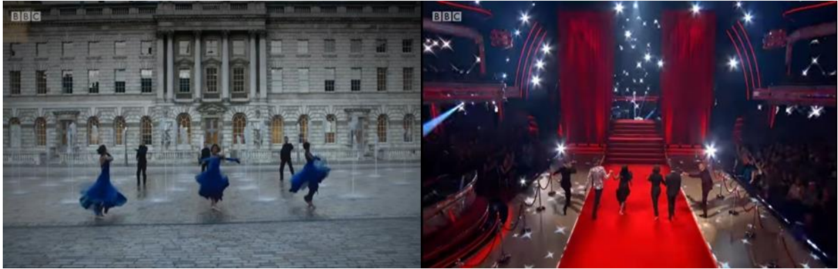
Slika 10.1.1. „Strictly Come Dancing“ prostor i pozadine plesnih izvedbi

Razlika koja je uočljiva jest ta da britanska verzija obično ima veći budžet za produkciju nego hrvatska. To se jasno odražava u impresivnijim scenografijama i kostimima te angažmanu poznatih stručnjaka. Britanska verzija koristi naprednu tehničku opremu i efekte kako bi plesne izvedbe bile spektakularne. Hrvatska verzija ima manje tehničkih resursa. Također, u britanskoj verziji, poznate osobe koje sudjeluju obično su poznate na globalnoj razini, što može dovesti do većeg interesa i medijske pažnje. 15