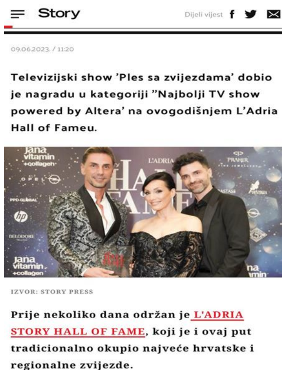
Slika 10.4.2. Story; „Ples sa zvjezdama“ dobio nagradu za „Najbolji TV show powered by Altera“

Nagrade za njihov angažman i doprinos humanitarnim projektima također su moguće. Pobjednici ili iznimni natjecatelji mogu dobiti pozivnice za sudjelovanje u drugim plesnim natjecanjima ili projektima.