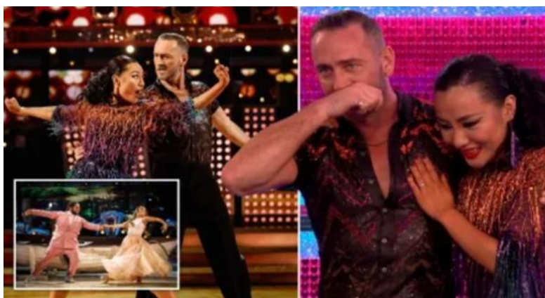
Slika 10.3.2. Metro; Will Mellor u „Strictly Come Dancing“

Show ističe izazove i prepreke s kojima se natjecatelji suočavaju, bilo da se radi o nedostatku plesnog iskustva, ozljedama ili drugim poteškoćama.