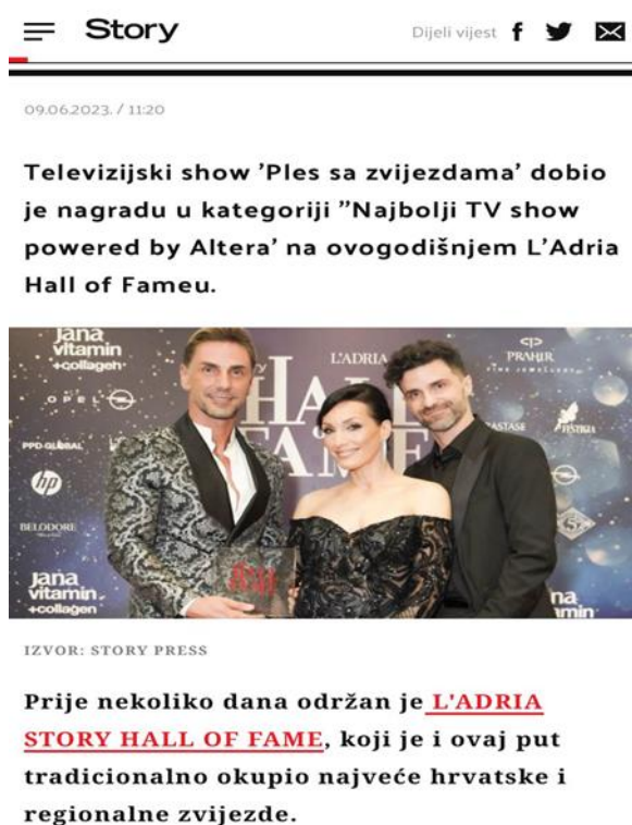
Slika 10.4.2. Story; „Ples sa zvijezdama“ dobio nagradu za „Najbolji TV show powered by Altera“

Nagrade za njihov angažman i doprinos humanitarnim projektima također su moguće. Pobjednici ili iznimni natjecatelji mogu dobiti pozivnice za sudjelovanje u drugim plesnim natjecanjima ili projektima.