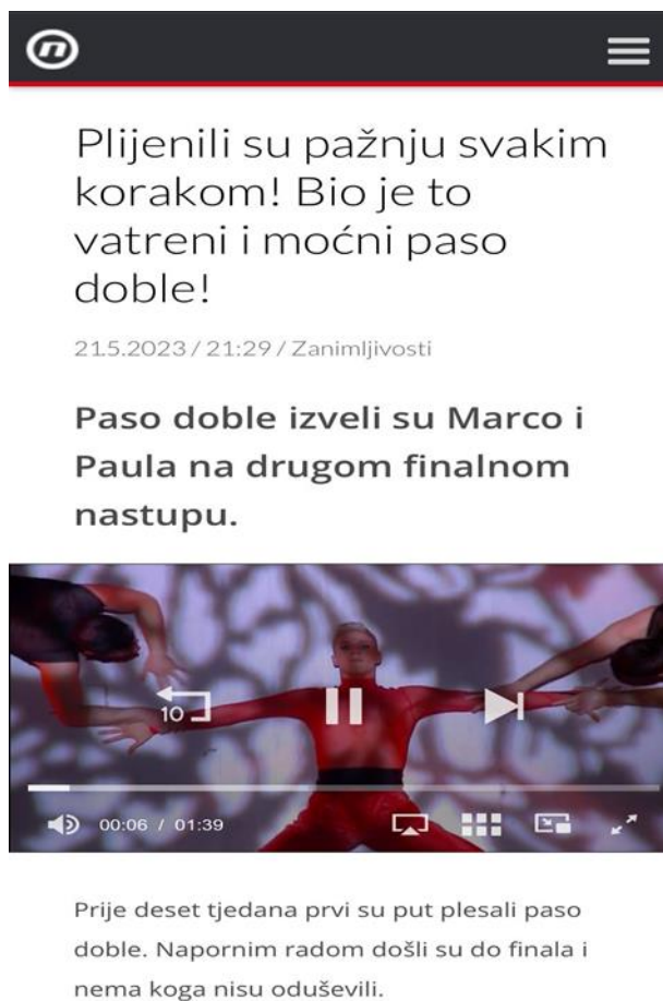
Slika 9.4.1. Izgled videozapisa uz tekst na portalu Nove TV

i Instagram. Među takvim oblicima tekstova ponekad se nađu i kratki intervjui koje također prate videozapisi. 13 Tekstovi na portalu HRT-a obično su duži i uz njih su priložene samo fotografije.