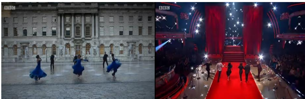
Slika 10.1.1. „Strictly Come Dancing“ prostor i pozadine plesnih izvedbi

Razlika koja je uočljiva jest ta da britanska verzija obično ima veći budžet za produkciju nego hrvatska. To se jasno odražava u impresivnijim scenografijama i kostimima te angažmanu poznatih stručnjaka. Britanska verzija koristi naprednu tehničku opremu i efekte kako bi plesne izvedbe bile spektakularne. Hrvatska verzija ima manje tehničkih resursa. Također, u britanskoj verziji, poznate osobe koje sudjeluju obično su poznate na globalnoj razini, što može dovesti do većeg interesa i medijske pažnje. 15