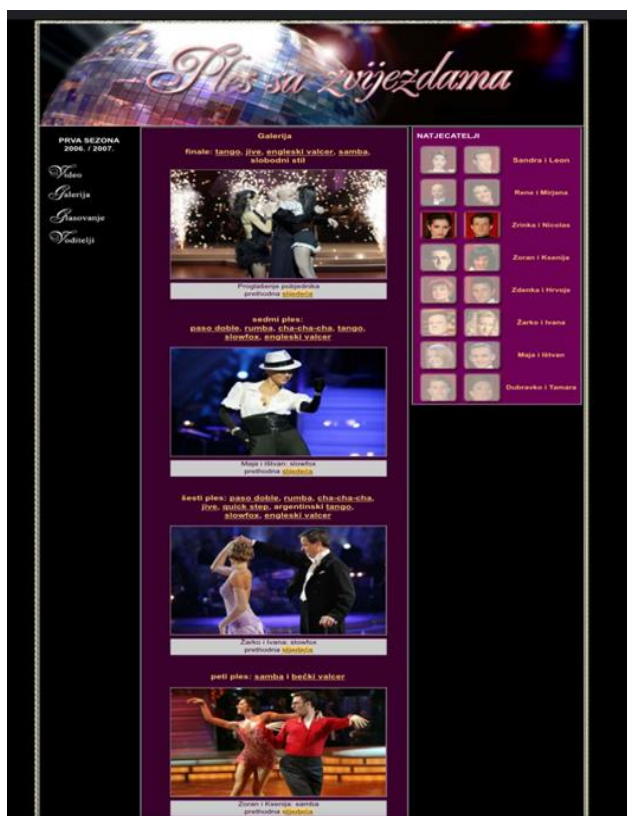
Slika 9.4.2. Izgled portala HRT-a, „Ples sa zvijezdama“ iz arhive

Pretražujući arhiv portala HRT-a, možemo vidjeti koliko je virtualni i multimedijски svijet uznapredovao. Sadržaj, način i izgled objava vremenom se evidentno promijenio, ali se uz multimedijalnost naglasak stavio i na funkcionalnost. Za razliku od objava danas, uz tekstove iz arhiva ne stoje poveznice za društvene mreže.