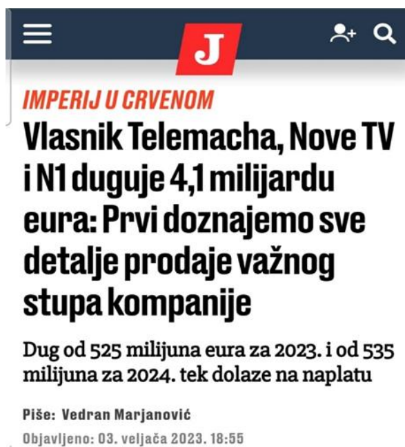
Slika 9.2.1. Naslov iz Jutarnjeg lista koji je priložen uz komentar na društvenoj mreži Facebook

Stranica Nove TV na društvenoj mreži Facebook dijeli svaki tekst s njihovog portala i publici/korisnicima društvene mreže otvara mogućnost komentiranja. 9 Prema komentarima na Facebooku možemo vidjeti kako je publika podijeljena. Ispod objava pronalazim jednak broj pozitivnih koliko i negativnih komentara. Neki od njih su: „Jedva cekam 👍❤️“, „Kad počinje?“, „To je toooo 😁 jedva čekam, ali će mi faliti Maja. 😞“, „Opet anonimci sudjeluju' Prošle sezone samo Bojana je mogla imati status zvijezde“, „U šta trošite novce“, „Čini se da lagano plešete prema kraju...“ 10 Uz posljednji komentar priložena je i sljedeća slika.