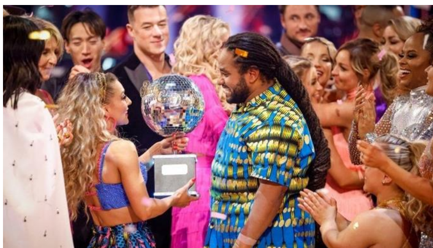
Slika 10.4.1. Pobjednici „Strictly Come Dancing“ 2022., Jowita Przystal i Hamza Yassin

U obje emisije natjecatelji mogu osvojiti priznanja i nagrade tijekom ili nakon svog sudjelovanja. Najprestižnija nagrada je naslov pobjednika sezone. Natjecatelj koji osvoji ovu titulu obično dobiva trofej ili medalju te često novčanu nagradu.