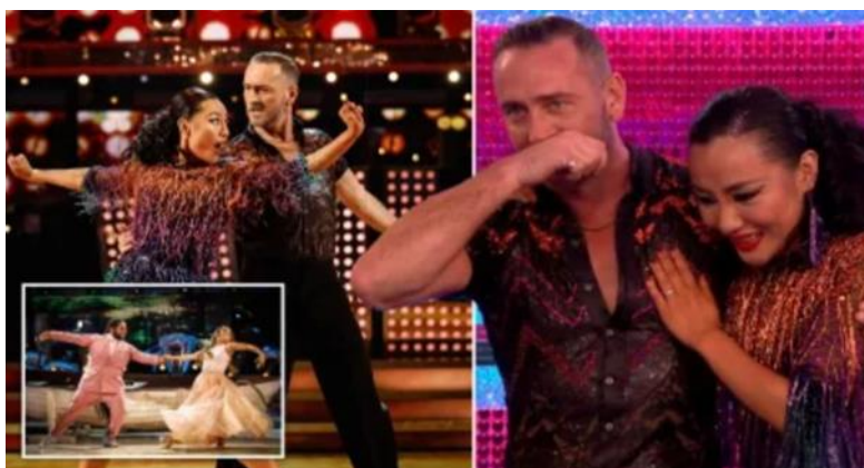
Slika 10.3.2. Metro; Will Mellor u „Strictly Come Dancing“

Show ističe izazove i prepreke s kojima se natjecatelji suočavaju, bilo da se radi o nedostatku plesnog iskustva, ozljedama ili drugim poteškoćama.