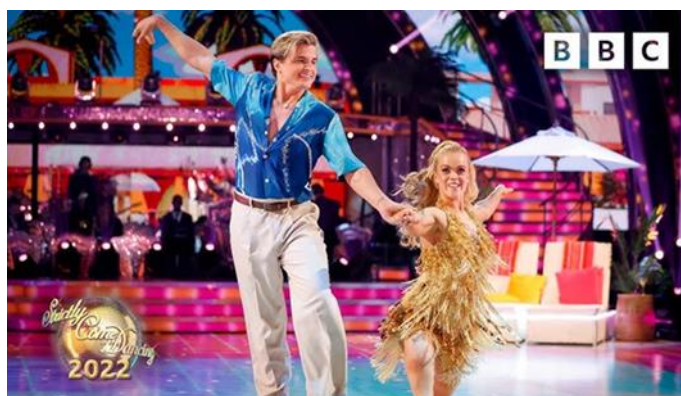
Slika 10.2.1. Ellie Simmonds i Nikita Kuzmin, „Strictly Come Dancing“ na BBC-u