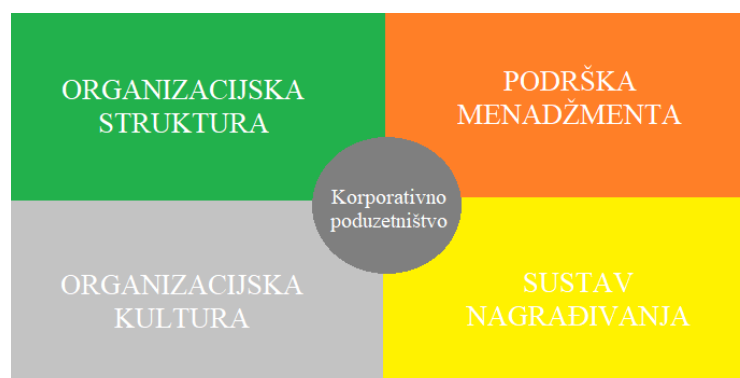
Slika 1: Faktori utjecaja na važnost korporacijskog poduzetništva, izvor: prema Hisrich (2015)

Tradicionalni menadžeri pretežno čvršće drže uspostavljenu hijerarhijsku strukturu, manje su skloni riziku i naglašavaju kratkoročne rezultate, što koči kreativnost, fleksibilnost i preuzimanje rizika, koji su potrebni za nove pothvate. Organizacije koje žele poduzetničku klimu trebaju poticati nove ideje i eksperimentalne napore, eliminirati parametre za mjerenje prilike, učiniti resurse raspoloživima, promovirati timski pristup i dobrovoljno korporacijsko poduzetništvo te osigurati potporu vrhovnog menadžmenta. Korporacijski poduzetnik treba imati odgovarajuće karakteristike vođe. Treba biti kreativan, fleksibilan i vizionar, korporacijski poduzetnik mora biti sposoban raditi unutar korporacijske strukture. Korporacijski poduzetnici trebaju poticati timski rad i služiti se diplomacijom u kontaktu s postojećim strukturama (Hisrich et. al., 2015).