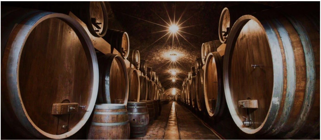
Slika 7. Prikaz tunela s vinskim bačvama u Iločkim podrumima ( https://www.ilocki-podrumi.hr/vina/ ; pristupljeno 05.08.2023.)