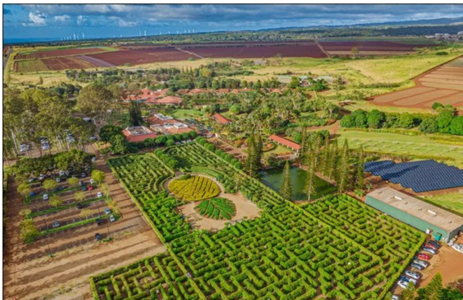
Slika 2. Pogled iz zraka na prostor plantaže Dole sa fokusom na labirint

Prvobitno korištena kao štand s voćem počevši od 1950., Plantaža Dole otvorena je za javnost kao havajski "Pineapple Experience" 1989. Danas je Plantaža Dole jedna od najpopularnijih atrakcija za posjetitelje Oahua i prima više od milijun posjetitelja godišnje. Plantaža Dole nudi ugodne aktivnosti za cijelu obitelj, uključujući obilazak Pineapple Express Train Tour, Plantation Garden Tour i Pineapple Garden Maze.