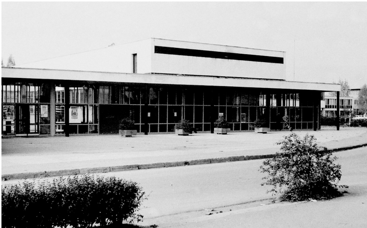
Slika 8. Knjižnica i kino dvorana godine 1965. iz zbirke Arhitektura u Ivanić-Gradu '60 – '85 ( https://industrijska-bastina.com/knjiznica-i-kino-dvorana/ ; pristupljeno 07.08.2023.)

Prvi istraživački radovi u ivanićkom kraju datiraju s početka 20. stoljeća. Inicijalna potraga za naftom rezultirala je pronalaskom prvih kapi nafte iz ovog kraja 1949. godine kada je u proizvodnju pušteno prvo od sedam naftnih polja koja djeluju na širem području Ivanić-Grada, polje Križ-Šumećani. Krajem 1962. godine otkriveno je, 3046 metara dubokom bušotinom, polje Ivanić te je u studenome 1963. godine počelo s radom cijelo naftno polje Ivanić. 60-tih i 70-tih godina osnivaju se brojne tvrtke na području grada: MEBA; kasnije Ivanićplast, Ivasim; kemijska industrija, TMPK; metaloprerađivačka industrija, ANTILOP; tekstilna industrija, 6.MAJ, kasnije Ivakarton, kartonaža, Agroposavina i brojne druge. Industrijalizacija je donosila napredak i blagostanje, gradile su se nove škole i vrtići, trgovački centri, upravna središta i industrijska postrojenja, u polu ruralnim sredinama dizale su se prve stambene zgrade modernih vizura. Ivanić-Grad je bio kolijevka izobrazbe radnih ljudi, raznih struka i razina, za potrebe cijelog nekadašnjeg INA-Naftaplina i drugih tvrtki koje su mijenjale gospodarski razvoj grada.