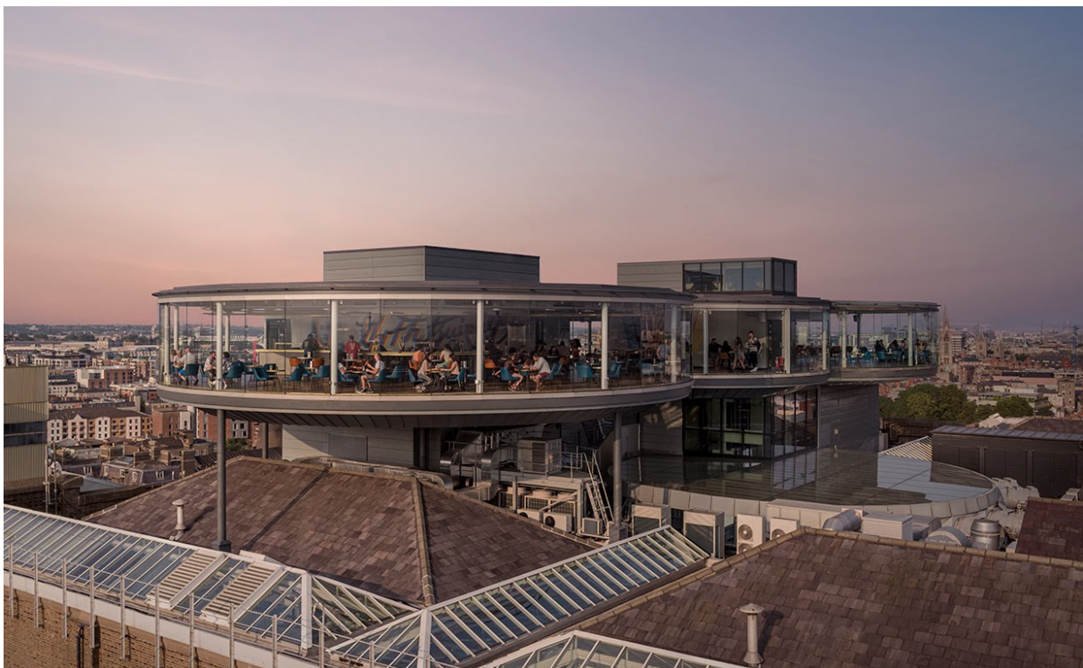
Slika 5. Gravity Bar u Dublinu ( https://www.guinness-storehouse.com/en/visit ; pristupljeno 25.08.2023.)

Guinness ovim kompleksom nudi istinski turistički doživljaj, no osim toga na kompletnoj lokaciji postoji nekoliko barova i restorana koje je moguće rezervirati i iskusiti dašak Irske tradicije. (Guinness Storehouse- https://www.guinness-storehouse.com/en/home )