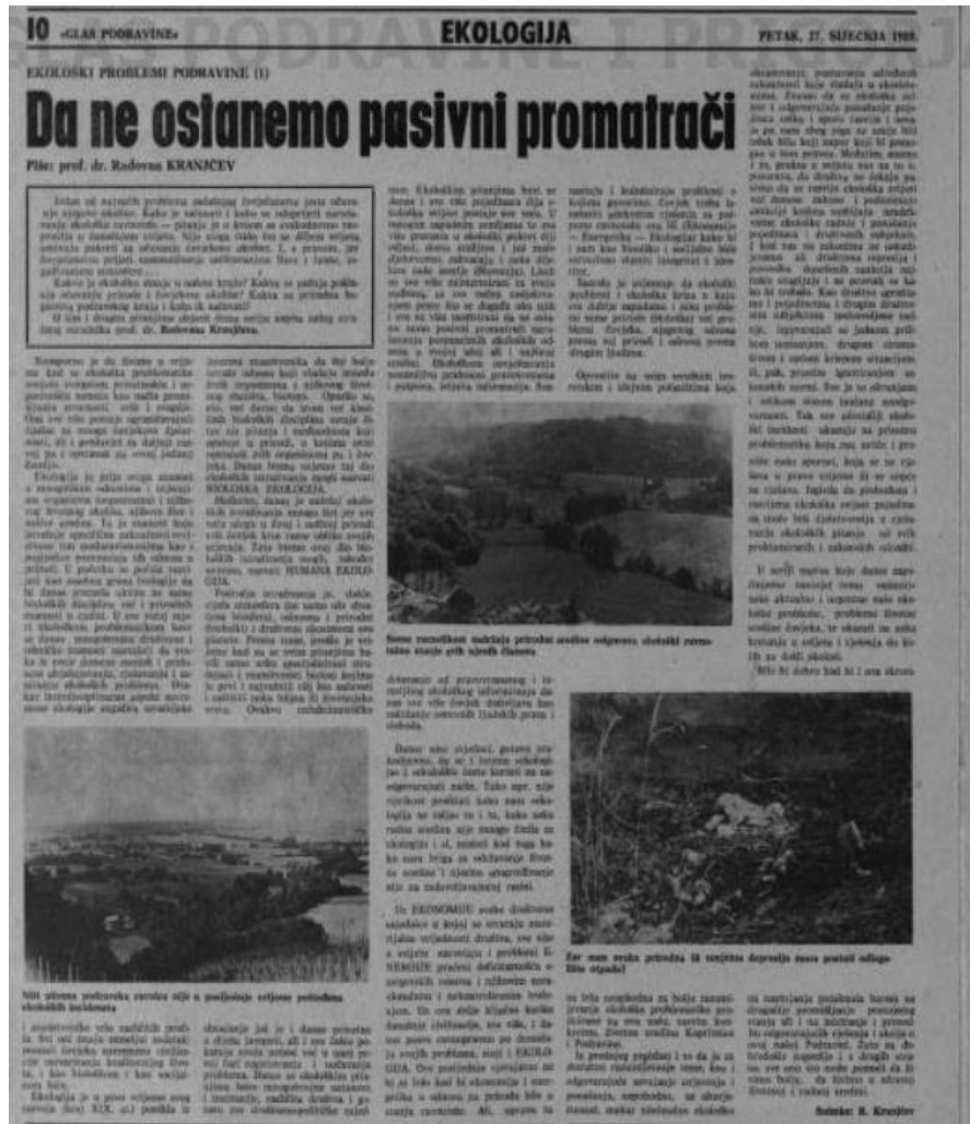
Slika 2. Glas Podravine o ekologiji, 27.1.1989.g. (izvor:

objavljeno je kako Ekološko društvo kreće s radom te su pozvani građani da se pridruže skupštini i učlane u društvo „jer samo širokim društvenim angažmanom može se ostvariti potreban utjecaj da se promijeni sadašnji devastacijski odnos prema prirodnoj sredini.“ – navode te je dodana upisnica koju su čitatelji mogli ispuniti i poslati u Ekološko društvo. 36