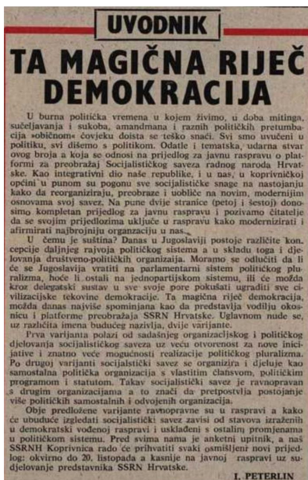
Slika 1. Glas Podravine, 6.10.1989.g. (izvor: