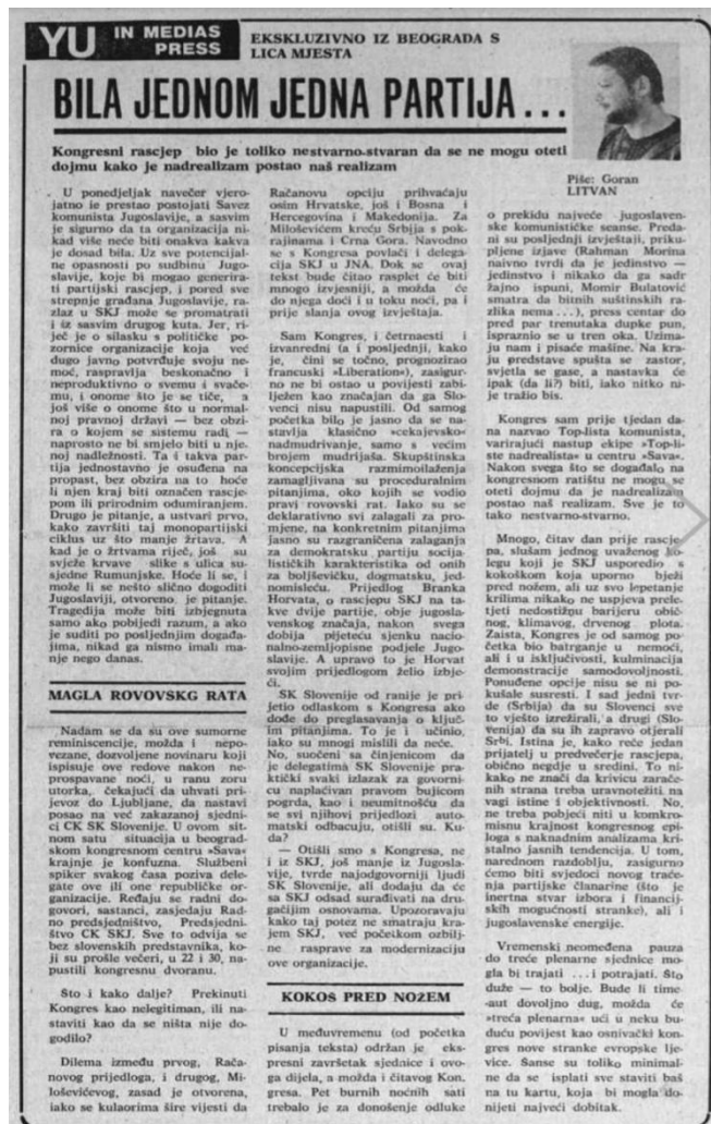
Slika 3. Glas Podravine, 26.1.1990.g. (izvor:

Također, početkom 1990. održana je skupština Saveza novinara Jugoslavije (SNJ) na kojoj je delegacija Udruženja novinara BiH dala inicijativu za preobrazbu SNJ, što je tada i prihvaćeno. Napisano je kako novinari traže „ozakonjenje prava i slobodu novinarske profesije“ i kako ne žele monopol SSRN ili partije. Uz to dodaju kako bi „novinarska organizacija prema toj inicijativi trebala biti udruženje novinara koji poštuju profesionalna pravila i etičke norme bez obzira na njihova politička uvjerenja.“ 43