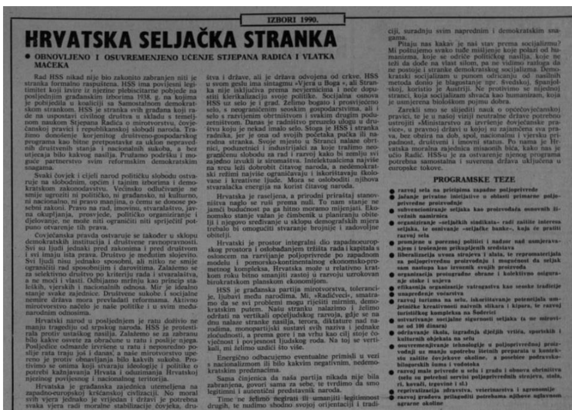
Slika 5. Promoviranje Hrvatske seljačke stranke, 6.4.1990.

detaljan popis stranaka i kandidata koji će sudjelovati na izborima. 55 U posljednjem broju iz travnja objavljeni su rezultati svih izbornih jedinica općine Koprivnica iz prvog kruga izbora, a napisano je: „Odziv birača na birališta bio je dobar, i samo biranje prošlo je bez ikakvih incidenata.“ 56