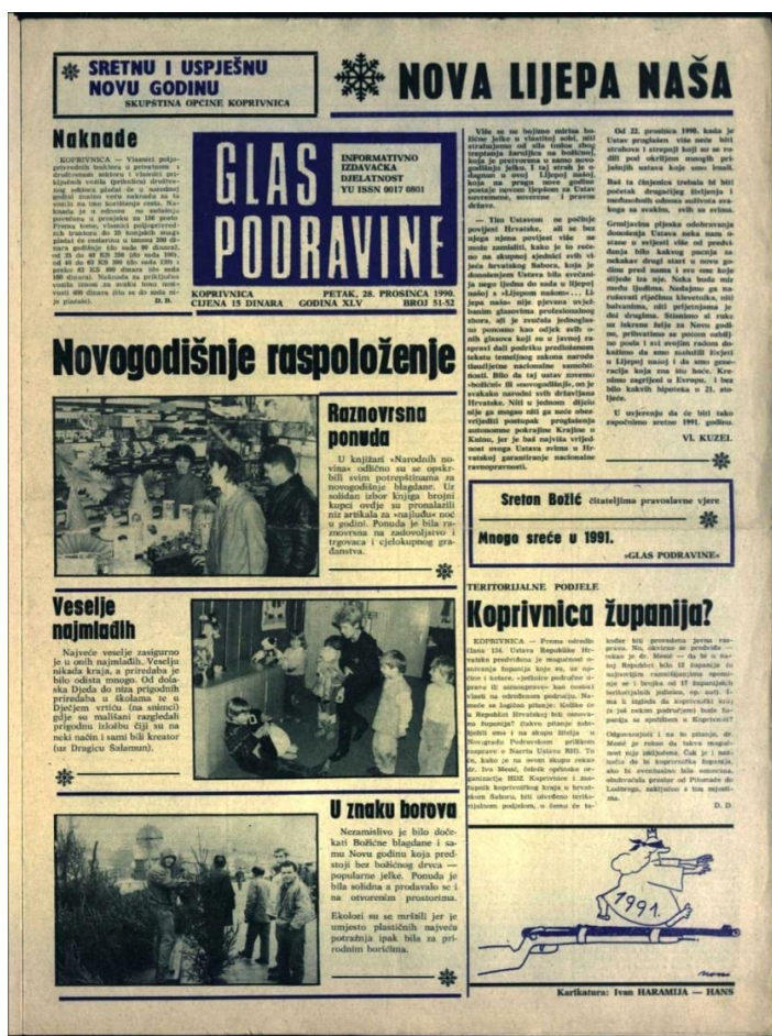
Slika 8. Naslovnica Glasa Podravine, 28.12.1990.g. (izvor: