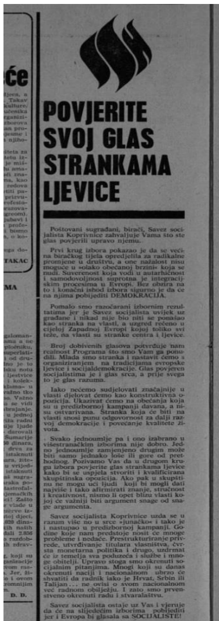
Slika 6. Savez socijalista Koprivnice poziva na glasanje, 4.5.1990.

sljedeće: „ne mogu prežali što na mom listiću na izborima nema kandidata stranke „Jugoplastike“, za čije bih radne i ljudske kvalitete zasigurno glasao.“ 58 Time se zapravo može vidjeti još uvijek privrženost komunizmu i partiji. Zanimljivo je svakako kako ljevica poziva na izbore i da ljudi glasaju za njih. (Slika 6.)