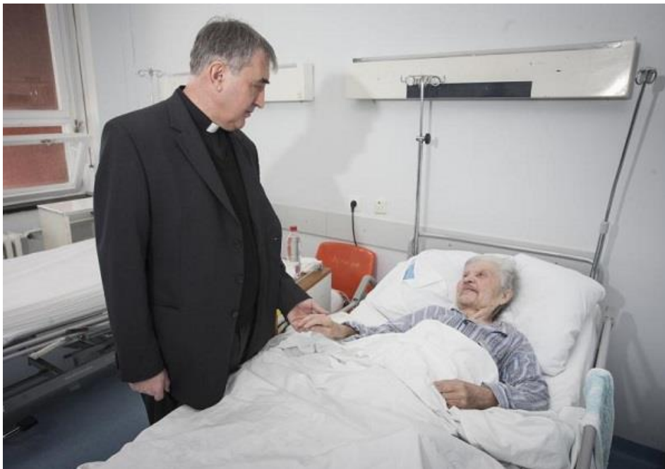
Slika 6.1. – Dušobrižništvo bolesnika

Duhovnikova je zadaća neprestano poboljšanje kvalitete duhovne skrbi kod bolesnika s potrebom za palijativnom skrbi, izgradnja učinkovitog i kvalitetnog sustava palijativne skrbi, uklanjanje nerazmjera između naglašavanja važnosti duhovne dimenzije za zdravlje ljudi u teoriji i njegovog zapostavljanja u svakodnevnoj praksi, definiranje profesionalnog i pravnog statusa duhovnika kao ravnopravnog člana tima palijativne skrbi te izgradnja sustava stručnog osposobljavanja ostalih za službu duhovnika u palijativnom timu na crkveno-teološkim i svjetovno-medicinskim učilištima [11].