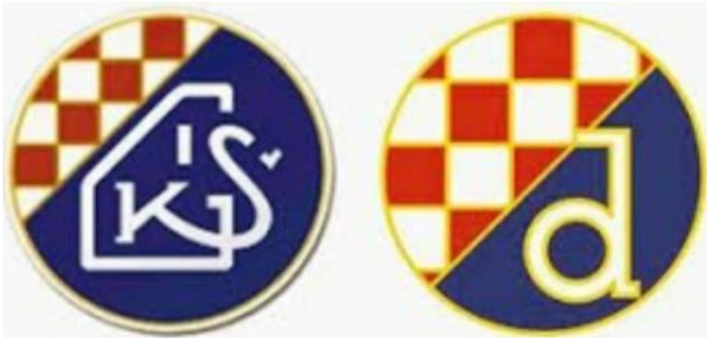
Slike 3. Logo Dinama nekada i sada