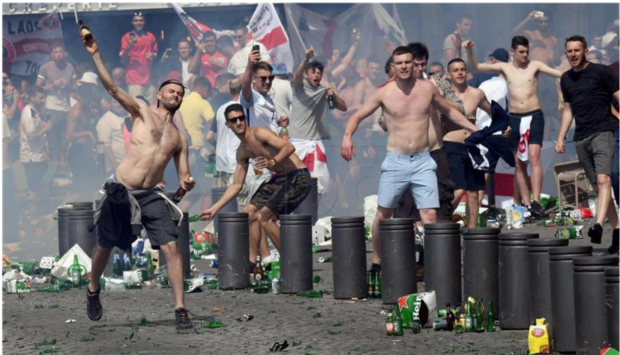
Slika 5. Navijački sukobi 4

izbjegavanju političkih stavova, deklarirali su se kao ekstremni srpski nacionalisti. U sezona 1990-91. kad je Zvezda postala europski prvak, Delije su je pratile klub na domaćim te svim gostovanjima, uključujući finale Kupa europskih prvaka u Bariju, gdje je prezentirana najveća nacionalna zastava ikada viđena na stadionima. Ubrzo nakon osvajanja trofeja započeo je rat u Jugoslaviji, gdje mnogi članovi Delija postaju dragovoljci u četničkim i ostalim paravojnim skupinama. Srbija se ubrzo našla pod sankcija pa je Crvenoj zvezdi je bilo zabranjeno sudjelovanje u međunarodnim natjecanjima [12]. Nakon ukidanja sankcija, dolazi do fuzije nove i stare generacije Delija , a i danas djeluju pod sloganom „Zvezda je život, ostalo su sitnice“ [12].