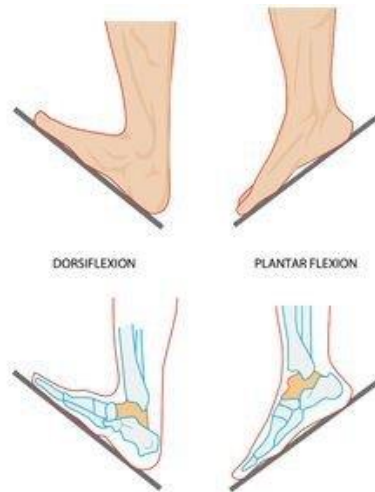
Slika 2.5.1. Prikaz krajnjih pokreta u gornjem gležanjnskom zglobu

https://www.quora.com/What-is-plantar-flexion-and-dorsal-flexion-How-do-they-differ ,