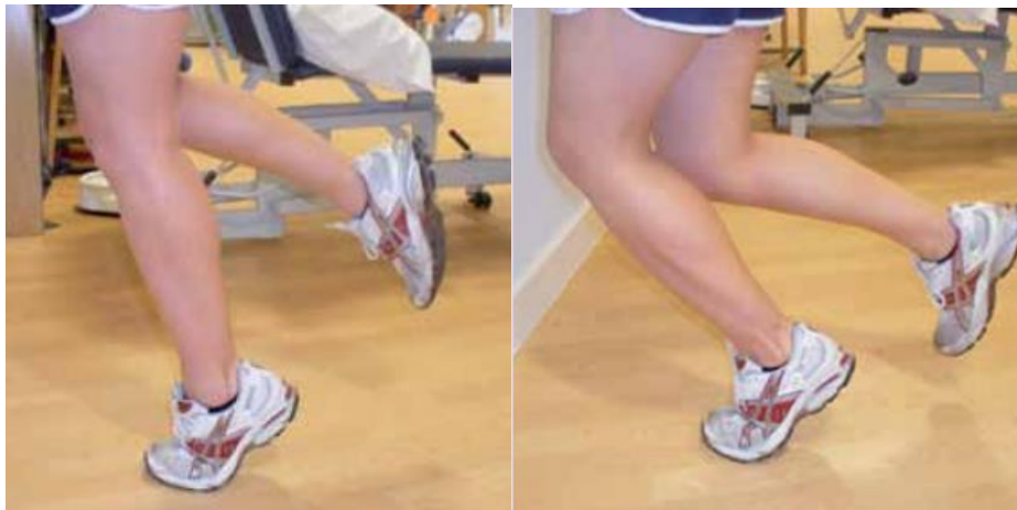
Slika 6.3.2. Prikaz ekscentričnih vježbi za entezopatiju Ahilove tetive u drugoj fazi

https://www.ouh.nhs.uk/patient-guide/leaflets/files/11924Ptendinopathy.pdf , dostupno 25.06.2024.