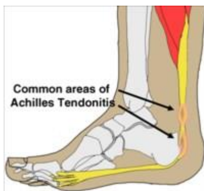
Slika 4.1.1. Prikaz najčešće lokalizacije tendinitisa Ahilove tetive

https://videoreha.com/hr-hr/programi/qlrowvani021amlhqqrgoa/ozljede-i-ostecenja-ahilove-tetive--tendinoza-ahilove-tetive , dostupno 08.06.2024.