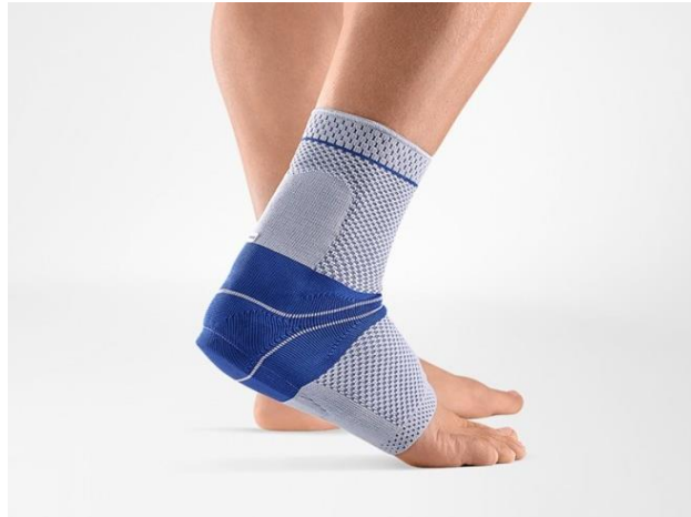
Slika 5.2.2. Kompresijska čarapa za Ahilovu tetivu nakon skidanja ortoze

https://www.bauerfeind.hr/proizvod/achillotrain/9 , dostupno 19.06.2024.