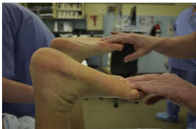
Slika 5.1.2. Izvođenje testa pasivne dorzifleksije gležnja

Od ostalih dijagnostičkih testova, važno je spomenuti test fleksije koljena, također poznat kao test pasivne dorzifleksije gležnja, a koji je opisao Matles 1975. godine. Izvodi se tako da osobu zamolimo da legne u pronirani položaj. Pacijent aktivno savija koljeno do 90 stupnjeva. Pritom fizioterapeut promatra oba stopala i gležnjeve tijekom fleksije i pazi da je tibia u vertikalnom položaju. Kod netaknute tetive, trebala bi postojati lako uočljiva lagana plantarna fleksija. Oštećena će tetiva sa stopalom pasti u neutralni položaj ili dorzifleksiju. Ona ruptura koja nije na vrijeme dijagnosticirana trebala bi biti pozitivna i s testom fleksije koljena, jer će se tetiva produljiti stvaranjem hematoma [22, 25].