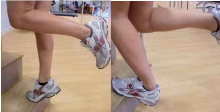
Slika 6.3.3. Prikaz ekscentričnih vježbi za entezopatiju Ahilove tetive u trećoj fazi

https://www.ouh.nhs.uk/patient-guide/leaflets/files/11924Ptendinopathy.pdf , dostupno 25.06.2024.