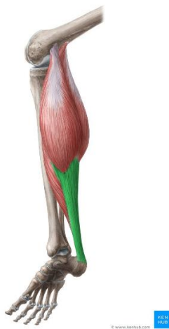
Slika 2.1.1. M. triceps surae i njegovo hvatište na calcaneus putem Ahilove tetive

strane potkoljenice pripada m. tibialis posterior koji je plantarni fleksor i supinator. Fleksiju interfalangealnih zglobova vrše m. flexor digitorum longus i m. flexor hallucis longus, dok m. popliteus ima stabilizacijsku ulogu koljenskog zgloba. Važno je spomenuti kako je m. triceps surae najjači u funkciji plantarne fleksije i supinacije te je jači i od m. tibialis posterior. Kod nekih slučajeva kao što su hernijacije diska koje rezultiraju oštećenjem S1 dijela u kralježničnoj moždini ili sama ozljeda n. tibialisa dolazi do nemogućnosti stajanja na prstima [4].