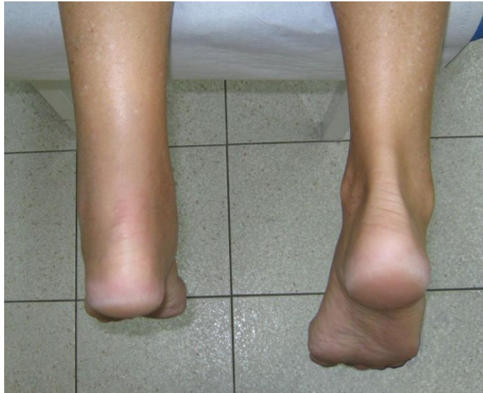
Slika 5.1.1. Ruptura Ahilove tetive (lijevo) u odnosu na neozlijeđenu tetivu (desno)

https://www.natus.hr/O%C5%A1te%C4%87enja%20/%20ozljede%20Ahilove%20tetive ,