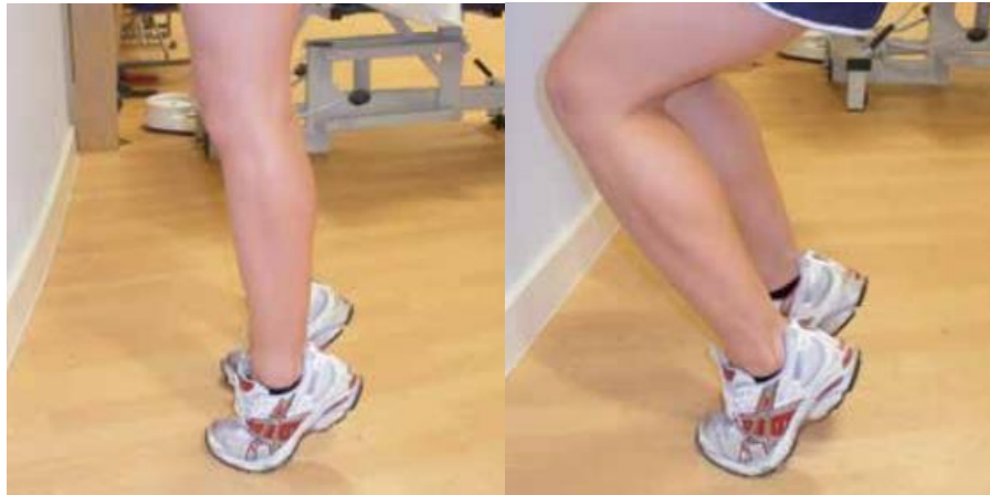
Slika 6.3.1. Prikaz ekscentričnih vježbi za entezopatiju Ahilove tetive u prvoj fazi

https://www.ouh.nhs.uk/patient-guide/leaflets/files/11924Ptendinopathy.pdf , dostupno 25.06.2024.