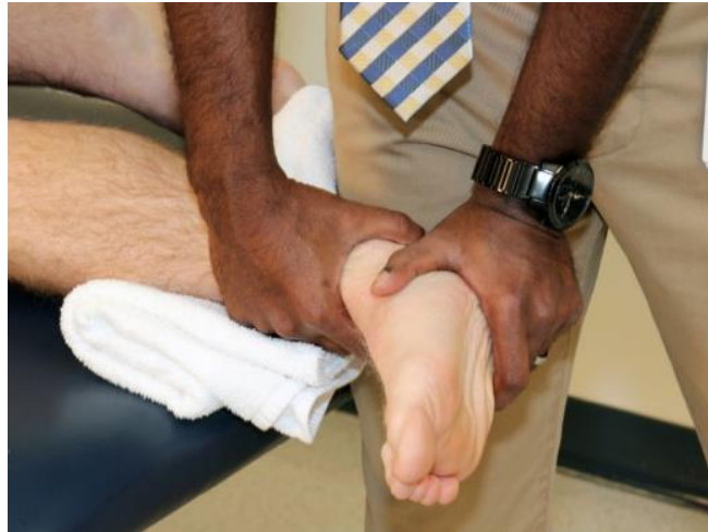
Slika 6.3.5. Mobilizacija lateralnog klizanja subtalarnog zgloba

https://pubmed.ncbi.nlm.nih.gov/28559670/ , dostupno 28.06.2024.