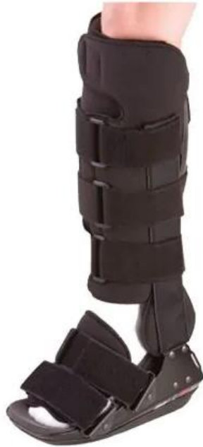
Slika 5.2.1. Čizma za Ahilovu tetivu za hodanje

tog razdoblja. Važno je da ispunjavaju kriterije. Nadalje, gledajući sastavljeni rehabilitacijski protokol za konzervativno liječenje AT, iz njega možemo očitati koliko osoba smije opteretiti nogu po tjednima od fizikalnog pregleda, odnosno ozljede, te kada je potrebna imobilizacija i koje aktivnosti su poželjne za postepen povratak u rutinu. U prva dva tjedna nakon ozljede osoba može opteretiti nogu koja je u plantarnoj fleksiji 20 – 30 stupnjeva, odnosno najvećoj mogućoj, a ozlijeđena tetiva je imobilizirana u gipsu, udlagi ili čizmi (Slika 5.2.1.) s približenim krajevima tetive [34, 21].