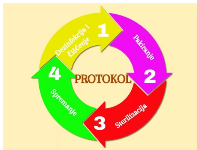
Slika 9.2. Prikaz protokola dezinfekcije i sterilizacije, Izvor: https://biosmart.hr/sterilizacija/

Svaka od ovih metoda ima svoje prednosti i ograničenja, a odabir odgovarajuće metode temelji se na specifičnim potrebama i zahtjevima za sterilnost. Strogo poštivanje postupaka sterilizacije neizostavno je za osiguranje sigurnosti i zaštite od infekcija u različitim industrijskim i zdravstvenim postavkama [13].