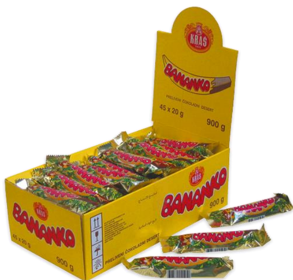
Slika 11. Poslastica Bananko