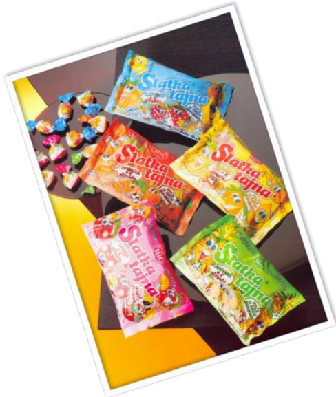
Slika 9. Bomboni Slatka tajna

Godine 1984. predstavljeni su bomboni Slatka tajna, a prvi namaz od lješnjaka, Nugatino, predstavljen je 1986. godine. Uvedena 1991. godine, poslastica Bananko odmah je postala najpopularnija poslastica među mladima, dominirajući tržištem. Prva Dorina čokolada predstavljena je 1996. godine. Sada objedinjuje sve čokolade pod jednim brendom.