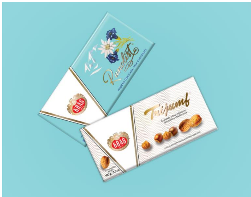
Slika 14. Čokolade iz kampanje "Retro"

Slično kao što postoje mnogi čimbenici i pokretači razvoja proizvoda, postoji i nekoliko objašnjenja zašto neki artikli prolaze lošije od drugih i vide pad prodaje. Neke kategorije proizvoda nije isplativo proizvoditi zbog tehnološkog napretka. Obično to ima veze s promjenom ukusa potrošača koji negativno utječu na budućnost proizvoda. Proizvod može koštati previše ili može imati posebne značajke koje ga čine neprivlačnim kupcima. U razdoblju propadanja Kraš d.d. revitalizirao je više predmeta. Kraš je pokrenuo kampanju „Retro“ u kojoj se nalazi niz artikala koji su skinuti s tržišta, ali su sada vraćeni. Trijumf i poznata čokolada Runolist, Runolist mini neke su od najpoznatijih.