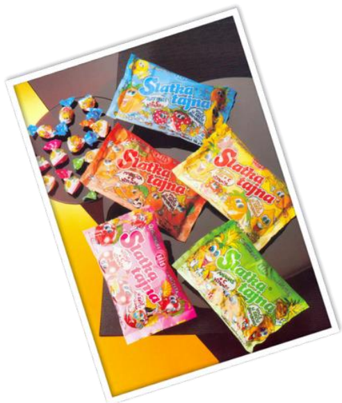
Slika 9. Bomboni Slatka tajna

Godine 1984. predstavljeni su bomboni Slatka tajna, a prvi namaz od lješnjaka, Nugatino, predstavljen je 1986. godine. Uvedena 1991. godine, poslastica Bananko odmah je postala najpopularnija poslastica među mladima, dominirajući tržištem. Prva Dorina čokolada predstavljena je 1996. godine. Sada objedinjuje sve čokolade pod jednim brendom.