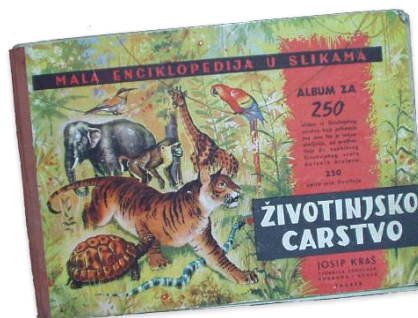
Slika 7. Životinjsko carstvo

Oslobađanje Domaćice poklopilo se s Životinjskim carstvom godinu dana. Domaćica, čajno pecivo umotano u čokoladu, trenutno je jedan od najprodavanijih Kraševih artikala.