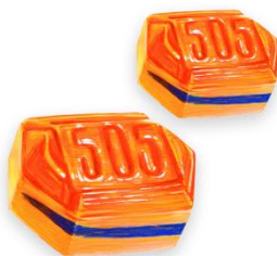
Slika 4. Prvi bomboni s linijom

Prvi bomboni s linijom razvijeni su unutar navedenog vremenskog razdoblja. Naime, oko 1936. godine, a od sada se nazivaju 505 bomboni. Za proizvodnju su nabavljeni specijalizirani strojevi. Prvi brend osnovan je 1946. Čokolada, teška 100 grama, napravljena je posebno za robnu kuću Nama.