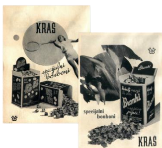
Slika 3. Prvo izdanje Ki-Ki bombona

proizvoda na temelju snage brenda. Brza tehnika berbe voća može se primijeniti ako je proizvod produžetak postojećeg brenda, odnosno ako je proizvod unutar brenda. Postupniji pristup ili dugoročni razvoj i izgradnja proizvoda može se koristiti ako se radi o novom brendu ili proizvodu unutar brenda koji nije toliko uspješan na tržištu. Tri poznata Kraševa proizvoda proizvedena su između 1930. i 1940. godine. Prvi Ki-Ki bomboni napravljeni su 1935. godine. Konkretno, poznatu frazu „Bilo kuda Ki-Ki svuda“ skovao je dječji autor Ratko Zvrko (Kraš, 2024).