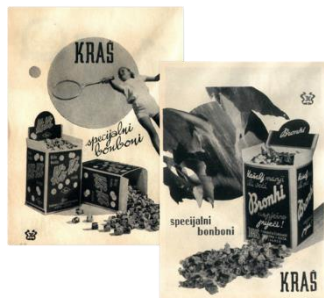
Slika 3. Prvo izdanje Ki-Ki bombona

proizvoda na temelju snage brenda. Brza tehnika berbe voća može se primijeniti ako je proizvod produžetak postojećeg brenda, odnosno ako je proizvod unutar brenda. Postupniji pristup ili dugoročni razvoj i izgradnja proizvoda može se koristiti ako se radi o novom brendu ili proizvodu unutar brenda koji nije toliko uspješan na tržištu. Tri poznata Kraševa proizvoda proizvedena su između 1930. i 1940. godine. Prvi Ki-Ki bomboni napravljeni su 1935. godine. Konkretno, poznatu frazu „Bilo kuda Ki-Ki svuda“ skovao je dječji autor Ratko Zvrko (Kraš, 2024).