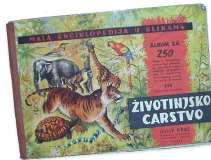
Slika 7. Životinjsko carstvo

Oslobađanje Domaćice poklopilo se s Životinjskim carstvom godinu dana. Domaćica, čajno pecivo umotano u čokoladu, trenutno je jedan od najprodavanijih Kraševih artikala.