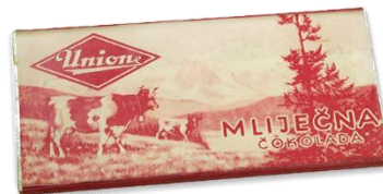
Slika 5. Prva čokolada