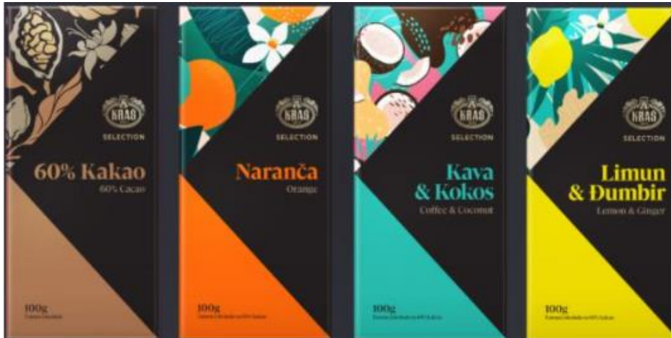
Slika 13. Kraš Selection čokolade

Od 2021. su dostupne tamne čokolade Kraš Selection. One su uvedeni u proljeće 2021. kao odgovor na rastući trend tržišta vrhunske čokolade i potrebu za robom s visokim udjelom kakaovca. Proizvod ima privlačan, suvremen izgled i predstavljen je u četiri okusa.