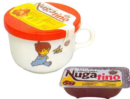
Slika 10. Nugatino