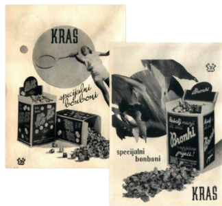
Slika 3. Prvo izdanje Ki-Ki bombona

proizvoda na temelju snage brenda. Brza tehnika berbe voća može se primijeniti ako je proizvod produžetak postojećeg brenda, odnosno ako je proizvod unutar brenda. Postupniji pristup ili dugoročni razvoj i izgradnja proizvoda može se koristiti ako se radi o novom brendu ili proizvodu unutar brenda koji nije toliko uspješan na tržištu. Tri poznata Kraševa proizvoda proizvedena su između 1930. i 1940. godine. Prvi Ki-Ki bomboni napravljeni su 1935. godine. Konkretno, poznatu frazu „Bilo kuda Ki-Ki svuda“ skovao je dječji autor Ratko Zvrko (Kraš, 2024).