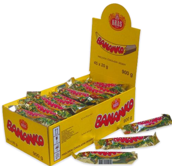
Slika 11. Poslastica Bananko