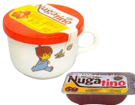
Slika 10. Nugatino