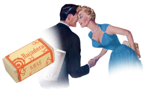
Slika 1. Bombonjera Bajadera

1952. nastaje prva Kraš bombonjera, a Bajadera je uvedena dvije godine kasnije. Kada je 1938. osnovano prvo Životinjsko carstvo, bila je to najtanja čokoladica na svijetu (15 grama). Godine 1956., kada je Kraš počeo tiskati prve albume za kolekciju sličica, promijenili su ime u Životinjsko carstvo.