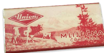
Slika 5. Prva čokolada