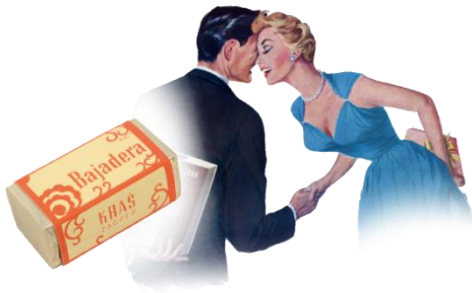
Slika 1. Bombonjera Bajadera

1952. nastaje prva Kraš bombonjera, a Bajadera je uvedena dvije godine kasnije. Kada je 1938. osnovano prvo Životinjsko carstvo, bila je to najtanja čokoladica na svijetu (15 grama). Godine 1956., kada je Kraš počeo tiskati prve albume za kolekciju sličica, promijenili su ime u Životinjsko carstvo.