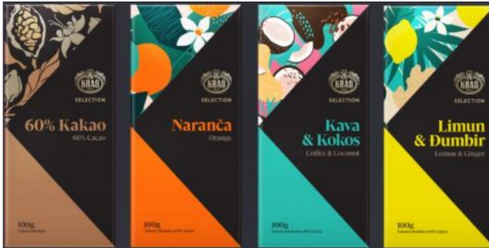
Slika 13. Kraš Selection čokolade

Od 2021. su dostupne tamne čokolade Kraš Selection. One su uvedeni u proljeće 2021. kao odgovor na rastući trend tržišta vrhunske čokolade i potrebu za robom s visokim udjelom kakaovca. Proizvod ima privlačan, suvremen izgled i predstavljen je u četiri okusa.