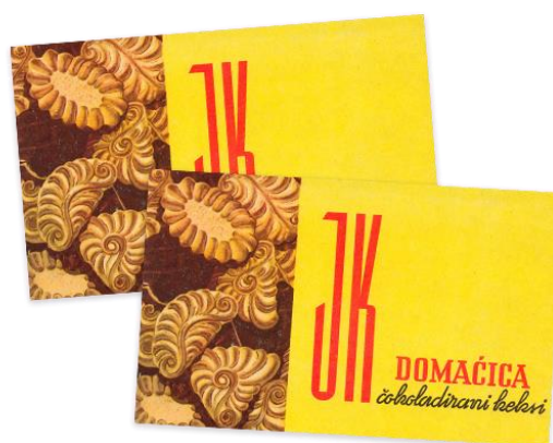
Slika 8. Keksi Domaćica

Oslobađanje Domaćice poklopilo se s Životinjskim carstvom godinu dana. Domaćica, čajno pecivo umotano u čokoladu, trenutno je jedan od najprodavanijih Kraševih artikala.