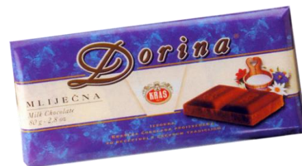
Slika 12. Prva Dorina čokolada