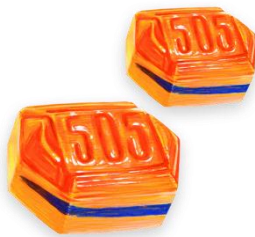
Slika 4. Prvi bomboni s linijom

Prvi bomboni s linijom razvijeni su unutar navedenog vremenskog razdoblja. Naime, oko 1936. godine, a od sada se nazivaju 505 bomboni. Za proizvodnju su nabavljeni specijalizirani strojevi. Prvi brend osnovan je 1946. Čokolada, teška 100 grama, napravljena je posebno za robnu kuću Nama.