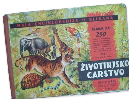
Slika 7. Životinjsko carstvo

Oslobađanje Domaćice poklopilo se s Životinjskim carstvom godinu dana. Domaćica, čajno pecivo umotano u čokoladu, trenutno je jedan od najprodavanijih Kraševih artikala.