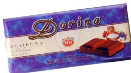
Slika 12. Prva Dorina čokolada