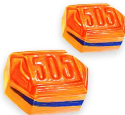
Slika 4. Prvi bomboni s linijom

Prvi bomboni s linijom razvijeni su unutar navedenog vremenskog razdoblja. Naime, oko 1936. godine, a od sada se nazivaju 505 bomboni. Za proizvodnju su nabavljeni specijalizirani strojevi. Prvi brend osnovan je 1946. Čokolada, teška 100 grama, napravljena je posebno za robnu kuću Nama.