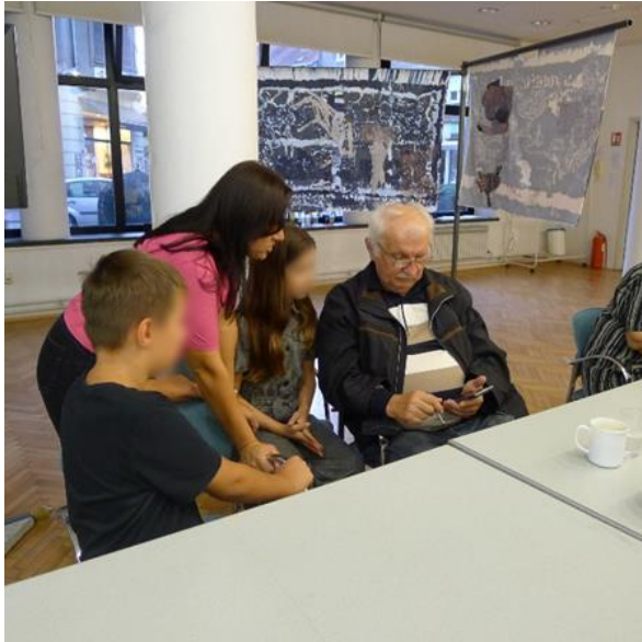
Slika 2. Upoznavanje djece i umirovljenika u projektu „Šah i tehnologija – međugeneracijska suradnja“ u Čitaonici i Galeriji VN