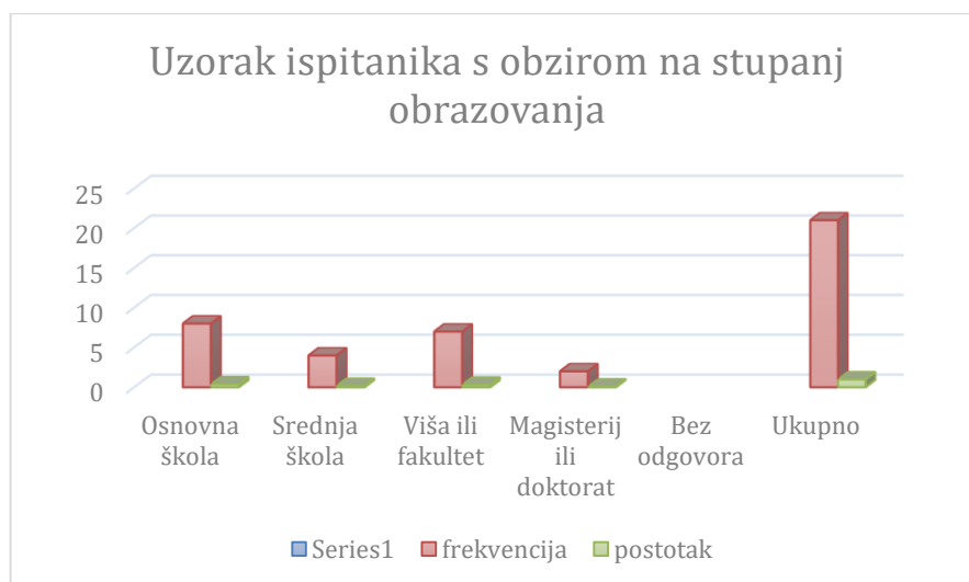
Grafikon 3. Uzorak ispitanika s obzirom na stupanj obrazovanja

U Tablici 3 vidljivo je da je osam sudionika još u osnovnoj školi (38,10%), dok je stupanj obrazovanja osoba starije životne dobi (65 plus) varirao od srednje škole koju je završilo 4 sudionika (19,05%), zatim više ili visoke škole koju je završilo sedam ispitanika (33,33%), dok su magisterij ili doktorat stekli dvoje ispitanika (9,52%).