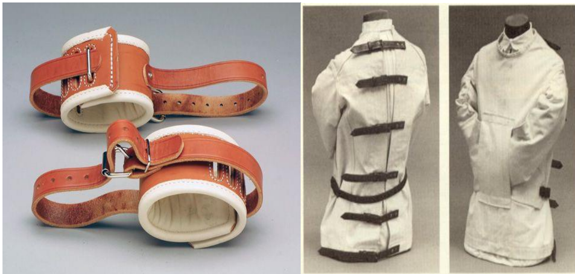
Slika 3.2.1. Remeni za mehaničko sputavanje ruku i stezulja

pričvršćena na tijelo ili uz tijelo bolesnika koja ograničavaju slobodu kretanja bolesnika [12]. Od sredstava za mehaničko sputavanje u praksi se primjenjuju pojasevi, remeni i stezulje (Slika 3.2.1. i Slika 3.2.2.).