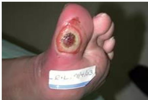
Slika 2.3.1.prikazan je neuropatski ulkus