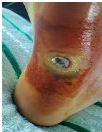
Slika 2.1.1. prikaz gangrene koja se razvila kao komplikacija na mjestu venskog ulkusa na peti

Arterijski ulkus je vrsta kronične rane koja nastaje zbog smanjenog protoka krvi u arterijama donjih ekstremiteta, obično kao posljedica periferne arterijske bolesti. Glavni uzrok arterijskih ulkusa je ishemija – nedostatak kisika i hranjivih tvari u tkivima uzrokovan suženjem ili blokadom arterija, često uzrokovanih aterosklerozom. Ključne karakteristike arterijskih ulkusa prema lokalizaciji su javljanje na područjima s minimalnim mekim tkivom, poput prstiju stopala, pete ili gležnja. Mogu se pojaviti i na mjestima pritiska, primjerice na strani stopala ili na potkoljenici. Prema izgledu su duboki, s jasnim rubovima i nekrotičnim (mrtvim) tkivom unutar rane. Koža oko ulkusa može biti suha, sjajna i hladna zbog nedostatka cirkulacije. Ulkus je često bolan, osobito noću ili kad je noga podignuta, jer je protok krvi još više ograničen u tim uvjetima. Simptomi koji su prisutni kod pacijenata obično su bol, osobito tijekom aktivnosti, jer mišići nogu ne dobivaju dovoljno kisika. Bol može postati stalna i intenzivna kako se stanje pogoršava. Komplikacije koje mogu nastati kod arterijskih ulkusa su sporo ili nikako ne zacjeljivanje zbog loše prokrvljenosti, a visoki rizik od infekcija može dovesti do ozbiljnih komplikacija poput gangrene, kao što je prikazano na slici 2.1.1.[4]