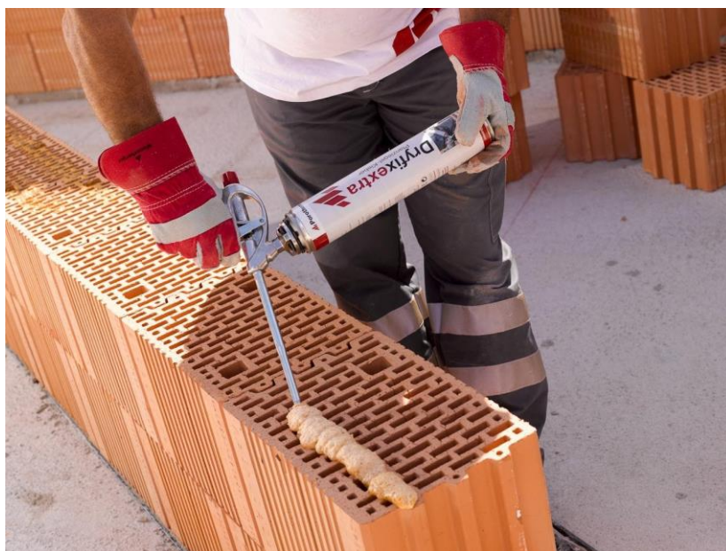
Slika 3.4.2 Aplikacija Dryfix veziva na blok opeku Porotherm 25 Profi