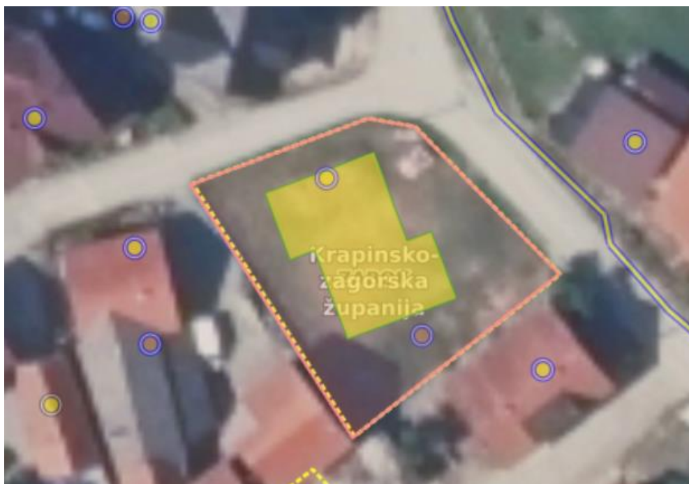
Slika 2.1 Prikaz čestice k.č. 7978 i ucrtane buduće građevine (ISPU)

Na građevinskoj čestici br. 7978 (2051/3) k.o. Zabok prikazne na slici 2.1, smještenoj na adresi Pavlovec Zabočki 16, 49 210 Zabok, stoji značajan zadatak koji predstavlja ključni korak prema transformaciji prostora i poboljšanju stanja stambenog smještaja u regiji. Plan investitora da zamijeni postojeće zgrade s novom višestambenom strukturom s četiri stambene jedinice ne samo da odražava potrebu za modernizacijom i urbanizacijom, već i otvara mogućnosti za poboljšanje kvalitete života lokalne zajednice. S obzirom na karakteristike čestice, topografske uvjete te važeće regulative, ovaj projekt zahtijeva pažljivo planiranje i izvođenje kako bi se osiguralo usklađivanje s urbanističkim i građevinskim standardima te minimaliziranje potencijalnih negativnih utjecaja na okoliš i susjedstvo. U skladu s tim, ovaj rad će detaljno analizirati, planiranje i dizajn nove zgrade, te relevantne aspekte provedbe projekta, s ciljem pružanja uvida u kompleksnost i izazove koje nosi realizacija ovog građevinskog poduhvata.