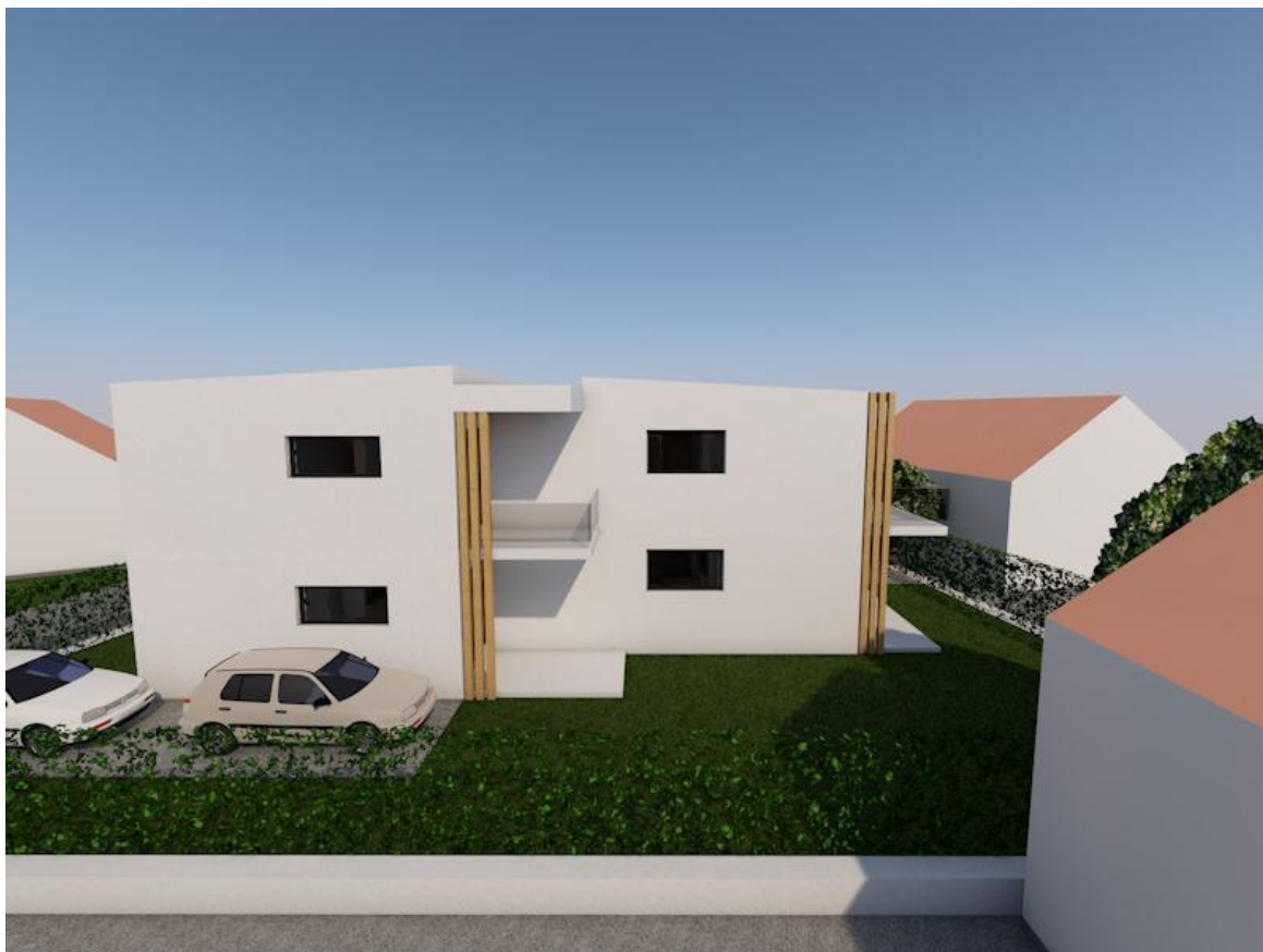
Slika 1.2. 3D Prikaz višestambene jedinice