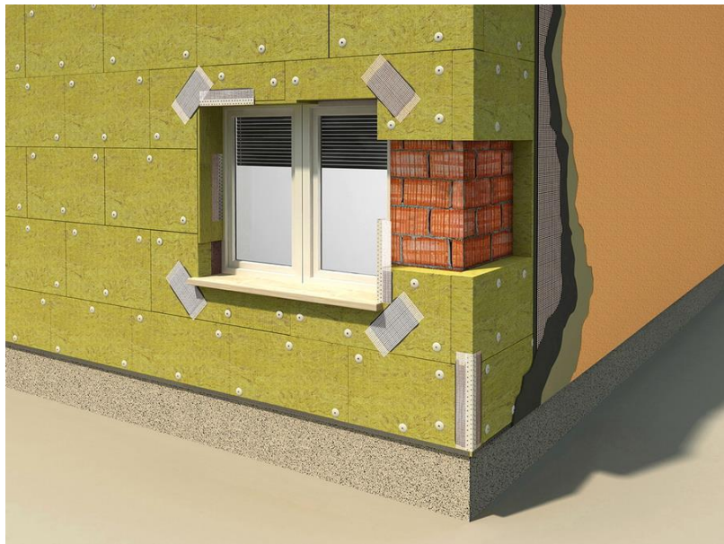
Slika 3.6.1 Demit fasada (ETICS)

Za višestambenu građevinu toplinska izolacija bit će Demit fasade prikazane na slikama 3.6.1 i 3.6.2, poznate i kao ETICS. Demit fasade pružaju izvanrednu toplinsku izolaciju, što značajno smanjuje gubitke topline zimi i pregrijavanje ljeti. Zahvaljujući ovom svojstvu, troškovi grijanja i hlađenja znatno se smanjuju, čime se postiže značajna energetska učinkovitost i dugoročna ušteda na računima za energiju. Estetski aspekt također je važan faktor pri odabiru fasade. Isto tako Demit fasade nude širok spektar završnih obrada i boja, što omogućuje arhitektima i vlasnicima zgrada da postignu željeni vizualni izgled i sklad s okolinom. Fleksibilnost u dizajnu omogućuje stvaranje jedinstvenih i atraktivnih fasada koje zadovoljavaju različite estetske preferencije.