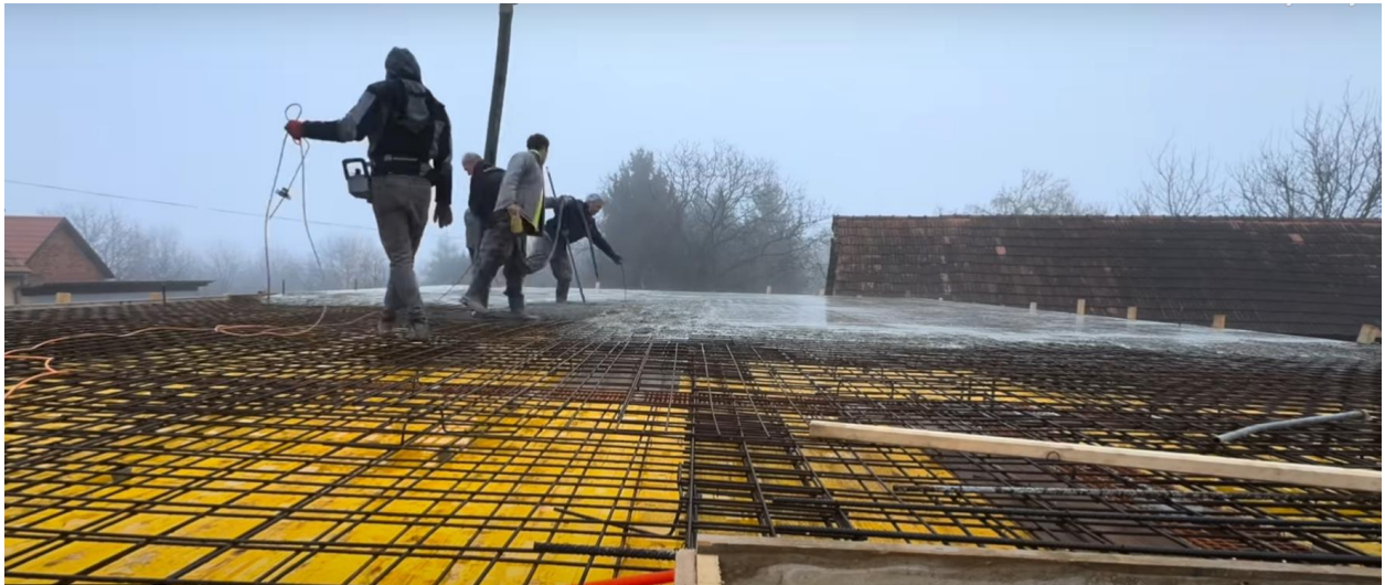
Slika 3.2.3 Prikaz primjera betoniranja AB međukatne ploče

Međukatne konstrukcije debljine 20 cm također će se betonirati s betonom C 25; Dmax16 u glatkoj oplati s podupiračima prikazani na slici primjera 3.2.3. Isto tako, planira se betoniranje AB ploče ravnog krova debljine 20 cm, s betonom C 25; Dmax16 u glatkoj oplati s podupiračima. Na kraju, betonirat će se AB stepenice s betonom C 25; Dmax16 u glatkoj oplati s podupiračima. Slika 3.2.3 služi kao karakterističan prikaz opisanog predviđenog rada te je preuzeta s interneta s obzirom da se objekat još ne izvodi.