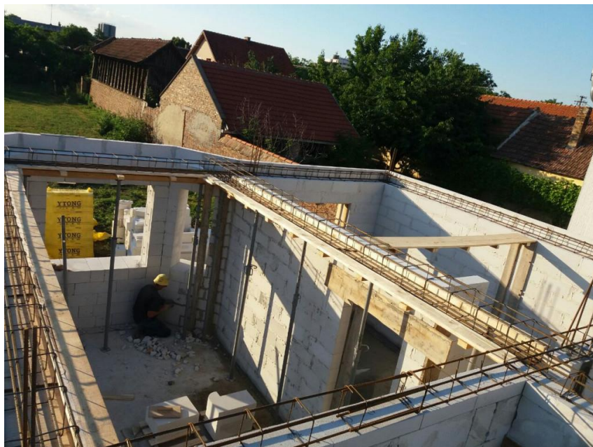
Slika 3.2.2 Prikaz primjera pripreme za betoniranje horizontalnih serklaža

Slično tome, betonirat će se AB horizontalni serklaži presjeka 25x25 cm prikazani na slici kao primjer 3.2.2, s betonom C 25; Dmax16 u glatkoj dvostranoj oplati. I za ove radove armiranje će se izvoditi prema statičkom proračunu i planu savijanja armature, dok su armatura i oplata zasebne stavke. Betonirat će se i AB horizontalne grede presjeka 25x30 cm, koristeći beton C 25; Dmax16 u glatkoj trostranoj oplati. Slika služi kao karakterističan prikaz opisanog predviđenog rada te je preuzeta s interneta s obzirom da se objekat još ne izvodi.