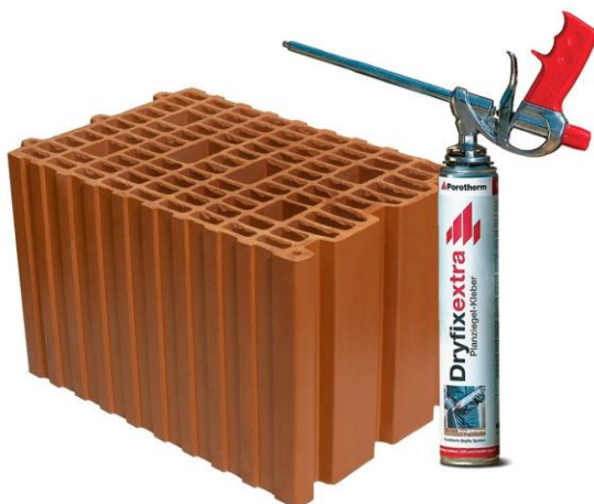
Slika 3.4.1 Blok opeka Porotherm 25 Profi s aplikatorom (ljepilom) Dryfix

Nosivi zidovi bit će izgrađeni od brušene opeke Porotherm 25 profi debljine 25 cm koristeći Dryfix ekstra ljepilo gdje su prikazani na slikama 3.4.1 i 3.4.2. Stropovi od opeke i armiranog betona bit će žbukani grubim cementnim mortom M5, a zatim fino vapnenim mortom M2.5, uz prethodno nanošenje cementnog šprica.