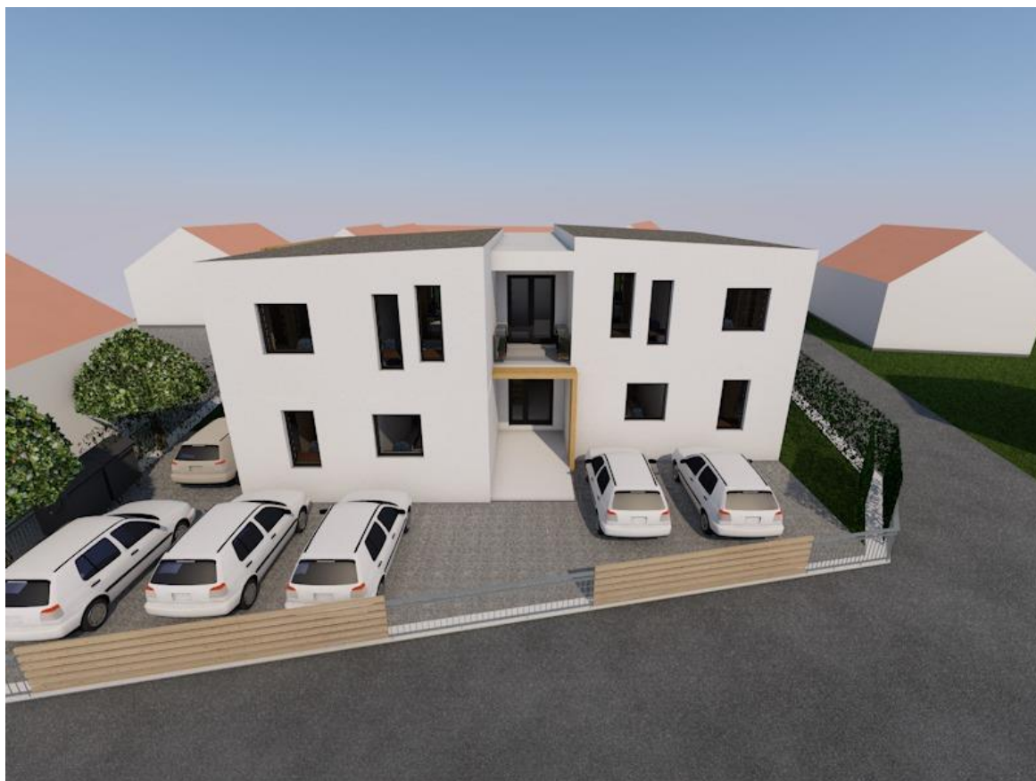
Slika 1.1. 3D Prikaz višestambene jedinice

Važno je napomenuti da projekt još nije započeo s gradnjom te je planiran početak gradnje u jesen tekuće 2024. godine. U ovom radu bit će obrađeni podaci iz glavnog projekta, koji će poslužiti kao temelj za izradu organizacije građenja. Analizirat će se cijene materijala, troškovnik, kalkulacije cijena te tehnički opis građevine s pratećim grafičkim priložima. Cilj je stvoriti detaljan plan gradnje koji će osigurati uspješno izvođenje projekta u skladu s zadanim vremenskim, financijskim i kvalitativnim ciljevima. 3D prikaz građevina možete vidjeti na slikama 1.1, 1.2, 1.3,