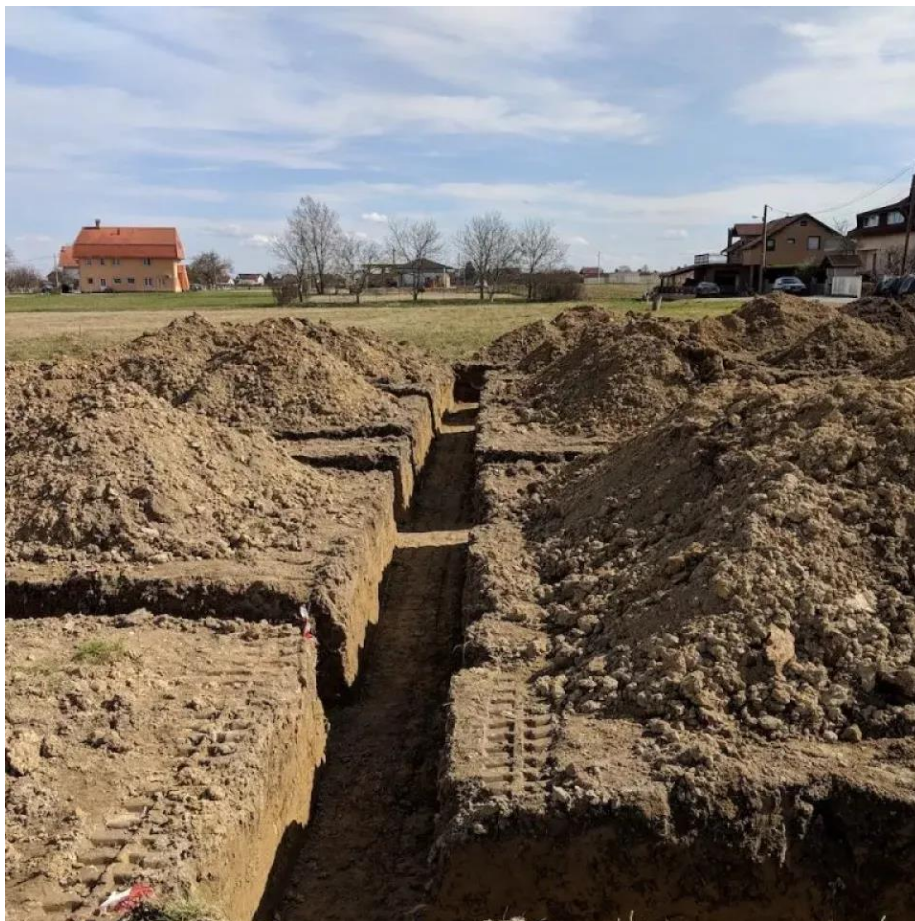
Slika 3.1.1 Prikaz iskopa trakastih temelja

Sav iskopani materijal treba prevesti do mjesta utovara radi odvoza na gradsku deponiju, ili do mjesta gdje će se ponovo koristiti za ugradnju. Materijal za sloj ispod betonskih podloga dobiva se prosijavanjem šljunka kroz sito, tako da se ukloni pijesak i sitniji šljunak (manji od 10 mm). Može se koristiti i tucanik veličine 10-80 mm. Sloj batude ili tucanika treba fino nivelirati i nabiti. Slika 3.1.1 služi kao karakterističan prikaz opisanog predviđenog rada te je preuzeta s interneta s obzirom da se objekt još ne izvodi.