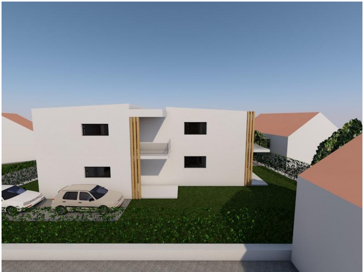
Slika 1.2. 3D Prikaz višestambene jedinice