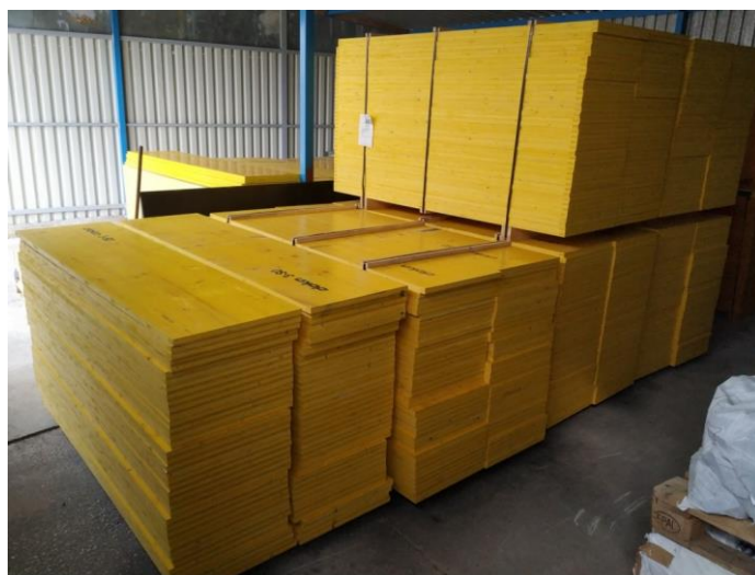
Slika 3.5.1 Doka daščana oplata

Kod izrade temelja koristiti će se daščana oplata. Izričito bih preporučio korištenje DOKA oplate prikazane na slikama 3.5.1 i 3.5.2, koja je poznata po svojoj izdržljivosti, preciznosti i lakoći montaže, što značajno može povećati efikasnost i sigurnost na gradilištu. DOKA koristi visokokvalitetne materijale i inovativne dizajne kako bi osigurala da oplate mogu izdržati visoki pritisak svježeg betona bez deformacija ili pomicanja.