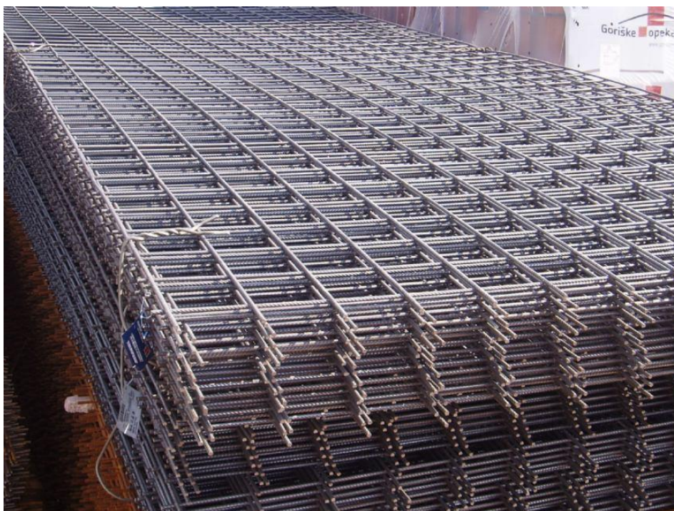
Slika 3.3.1 Armaturna mreža Q188 za armiranje podnih ploča

Ravnanje armature osigurat će se pravilna geometrija elemenata, a postava i vezivanje provodit će se na licu mjesta, prema planu armature. Svi ovi koraci su ključni za postizanje željene čvrstoće i stabilnosti konstrukcije, te će se izvoditi uz strogu kontrolu kvalitete kako bi se osigurala usklađenost sa statičkim i izvedbenim zahtjevima projekta.