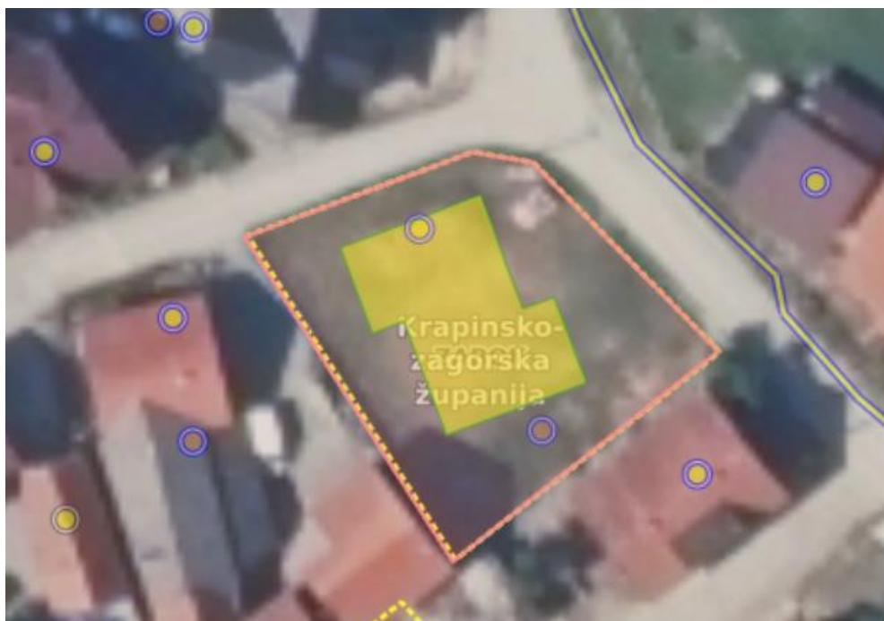
Slika 2.1 Prikaz čestice k.č. 7978 i ucrtane buduće građevine (ISPU)

Na građevinskoj čestici br. 7978 (2051/3) k.o. Zabok prikazne na slici 2.1, smještenoj na adresi Pavlovec Zabočki 16, 49 210 Zabok, stoji značajan zadatak koji predstavlja ključni korak prema transformaciji prostora i poboljšanju stanja stambenog smještaja u regiji. Plan investitora da zamijeni postojeće zgrade s novom višestambenom strukturom s četiri stambene jedinice ne samo da odražava potrebu za modernizacijom i urbanizacijom, već i otvara mogućnosti za poboljšanje kvalitete života lokalne zajednice. S obzirom na karakteristike čestice, topografske uvjete te važeće regulative, ovaj projekt zahtijeva pažljivo planiranje i izvođenje kako bi se osiguralo usklađivanje s urbanističkim i građevinskim standardima te minimaliziranje potencijalnih negativnih utjecaja na okoliš i susjedstvo. U skladu s tim, ovaj rad će detaljno analizirati, planiranje i dizajn nove zgrade, te relevantne aspekte provedbe projekta, s ciljem pružanja uvida u kompleksnost i izazove koje nosi realizacija ovog građevinskog poduhvata.