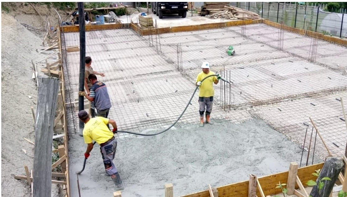
Slika 3.2.1 Prikaz primjera betoniranja AB ploče stambenog objekta Poljine u Sarajevu

Nadalje, planira se betoniranje AB ploče na tlu prikazane na slici primjera 3.2.1, debljine 12 cm, s betonom C 25; Dmax16. U ovaj beton dodavat će se ekološki prihvatljivi aditivi za vodonepropusnost i sprečavanje upijanja. Prilikom betoniranja, ugradit će se svi elementi predviđeni projektom, poput vertikala kanalizacije, dovoda vode i struje. Slika 3.2.1 služi kao karakterističan prikaz opisanog predviđenog rada te je preuzeta s interneta s obzirom da se objekat još ne izvodi.