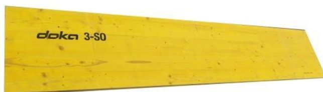
Slika 3.5.2 Doka daska debljine 27mm