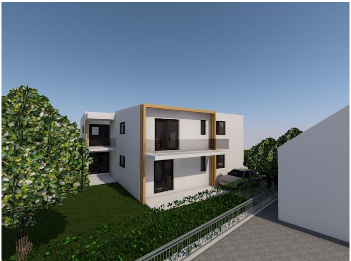
Slika 1.3. 3D Prikaz višestambene jedinice