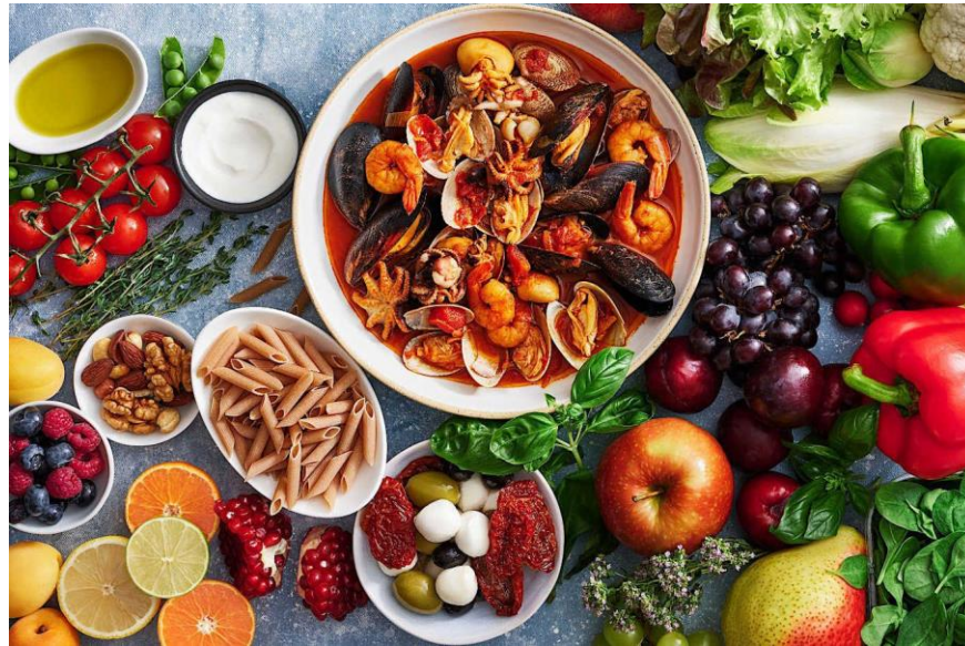
Slika 6.1. Mediteranska prehrana

maslinovim uljem ili orašastim plodovima nego među onima na dijeti sa smanjenim unosom masti (Slika 6.1.) [26].