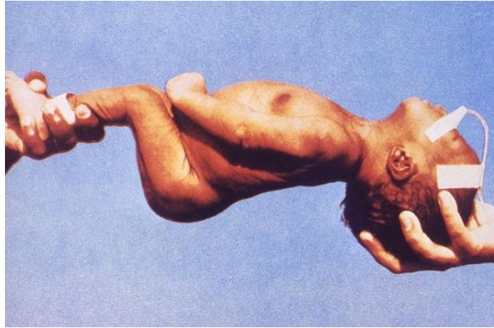
Slika 8. 2. 1. : primjer ukočenosti tijela kod neonatalnog tetanusa