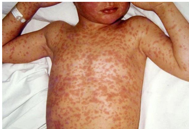
Slika 10. 1. 1. : kožni osip uzrokovan ospicama