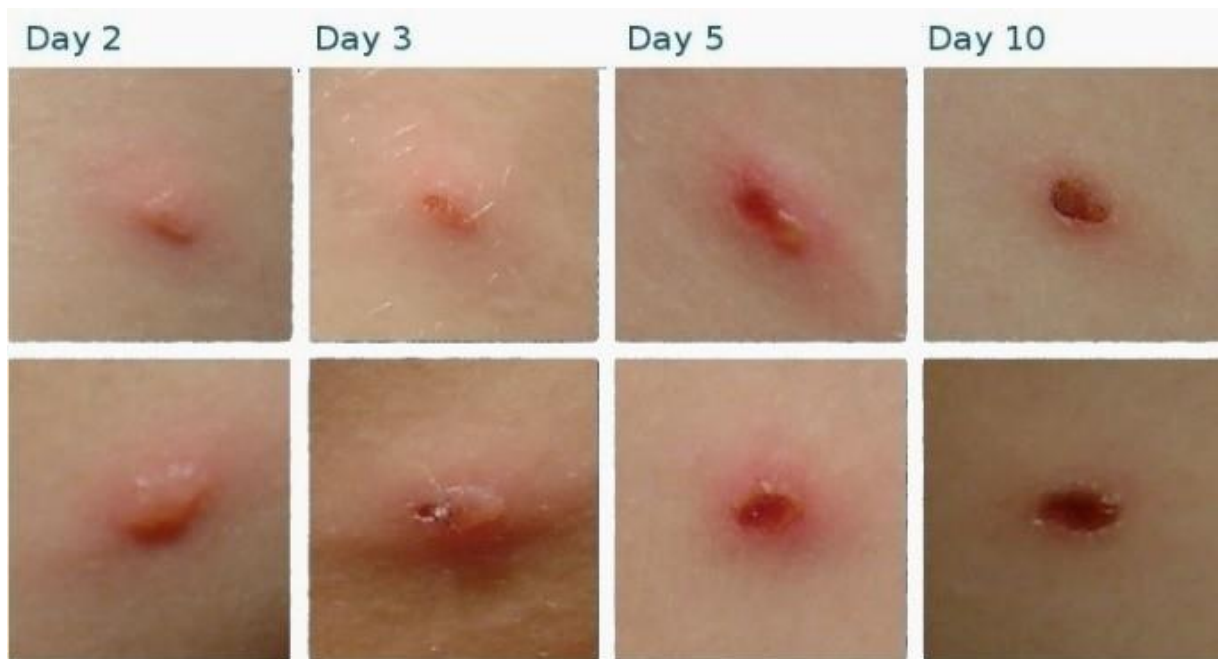
Slika 6. 1. 1. : Razvoj karakterističnog ožiljka nakon primjene BCG cjevica