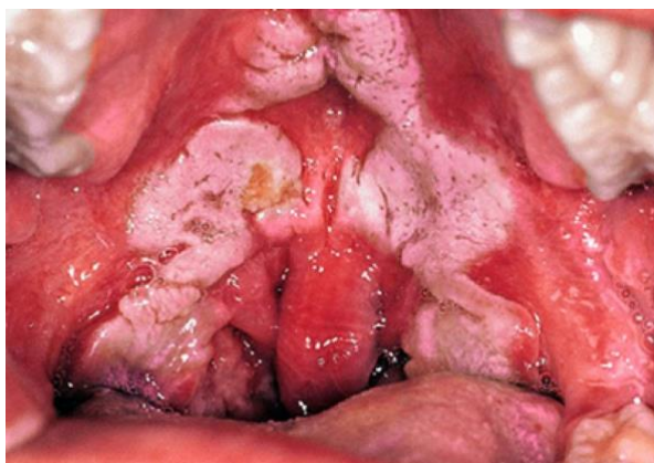
Slika 8. 1. 1. : membrana na tonzilama, karakteristična za difteriju