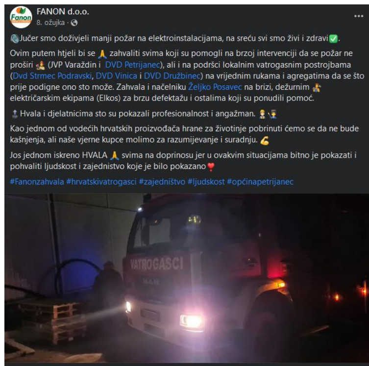
Slika 1 Krizna komunikacija putem društvene mreže Facebook

Što se tiče eksternih korporativnih komunikacija, u tom slučaju sva komunikacija je na direktoru poduzeća koji zatim ciljane javnosti obavještava o potrebnim informacijama. Kako je već navedeno, ovo je poduzeće srednje veličine te kao takvo nema odjel za odnose s javnošću. U takvim situacijama sva komunikacija s javnostima se odvija putem ranije spomenute osobe – direktora poduzeća. Ipak, u slučaju „manjih“ kriza, FANON d.o.o. također komunicira i putem društvenih mreža s javnostima. Kao primjer bih izdvojila požar koji se dogodio na elektroinstalacijama u sjedištu poduzeća. Požar se dogodio 7. ožujka 2023. godine, a poduzeće je o tome obavijestilo javnost putem društvene mreže Facebook sljedeći dan.