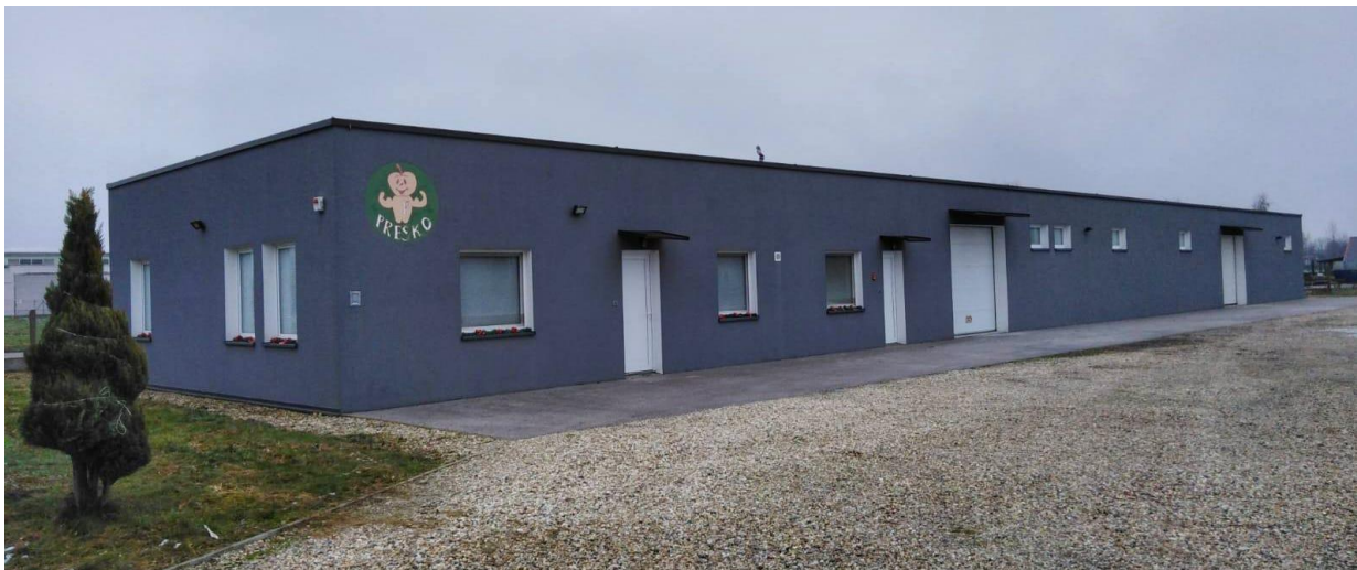
Slika 2.1. Prešaona voća i povrća "Preško"