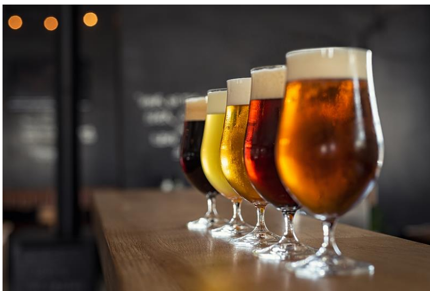
Slika 1. različite vrste piva (Klix, Spoj kvasca, hmelja, slada i vode: Zna li koje vrste piva preporučuju nutricionisti?) [1]

Pivo, još nazvano i tekućim kruhom je pjenušavo, slabo alkoholno piće karakterističnog gorkog okusa i arome hmelja, proizvedeno alkoholnim vrenjem pивske sladovine uz pomoć pivskih kvasaca Saccharomyces cerevisiae , a rjeđe uz pomoć drugih mikrobnih kultura. Pivo se proizvodi i konzumira od početka ljudske povijesti te je nadživjelo brojne civilizacije, a u srednjem vijeku se konzumiralo češće nego voda zbog loših higijenskih uvjeta te se je imalo važnu ulogu u duhovnim obredima i kulturnom razvoju društva [1].