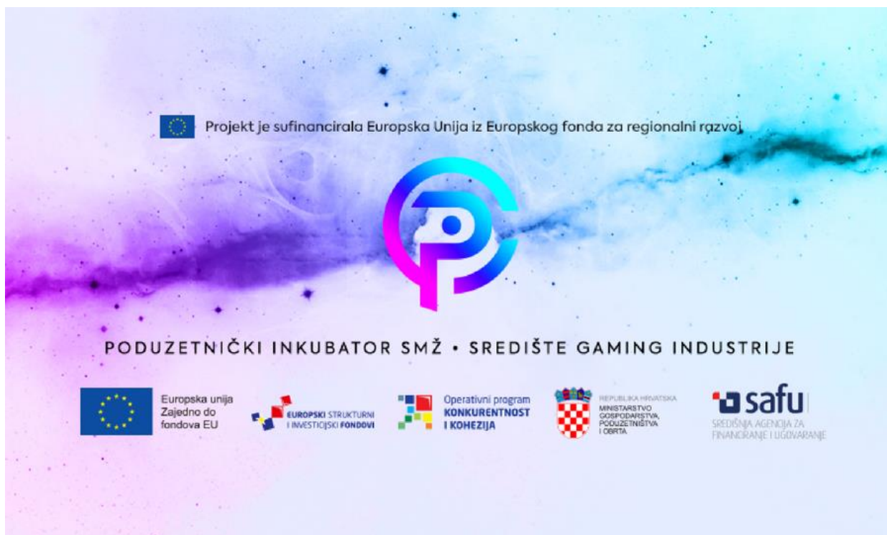
Slika 1. „Stvaranje poticajnog poduzetničkog okruženja u Sisačko-moslavačkoj županiji osnivanjem „Poduzetničkog inkubatora PISMO -Novska“.

Nositelj ovoga projekta je Razvojna agencija Sisačko-moslavačke Županije SI-MO-RA d.o.o., te su partneri na projektu Sisačko-moslavačka županija i Zagrebački inovacijskih centar d.o.o.