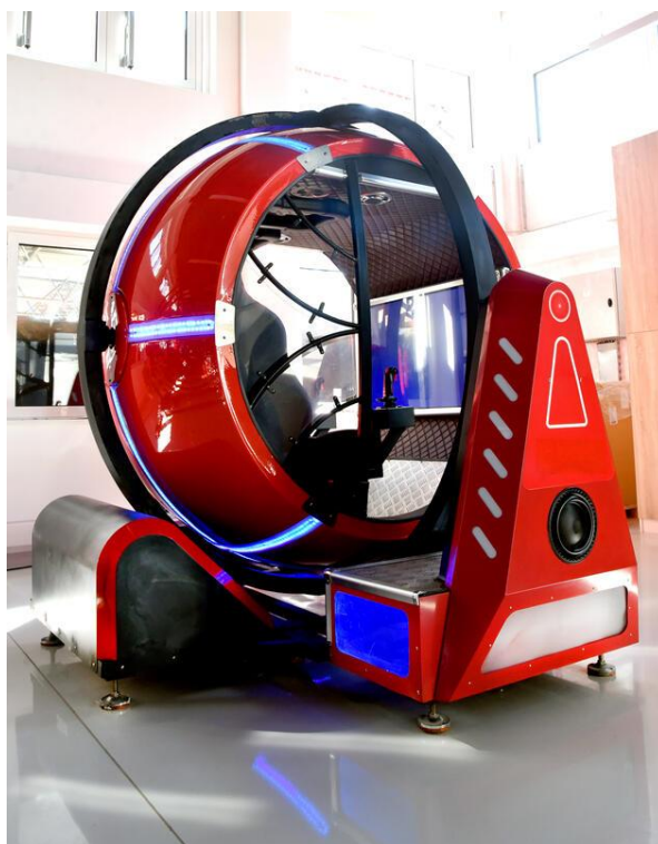
Slika 2. Prostorije inkubatora PISMO opremljene su najmodernijim uređajima.

Povezivanje lokalnih poduzetnika s međunarodnim investitorima, industrijskim stručnjacima i drugim relevantnim dionicima kako bi se olakšalo širenje poslovanja i razmjena znanja.