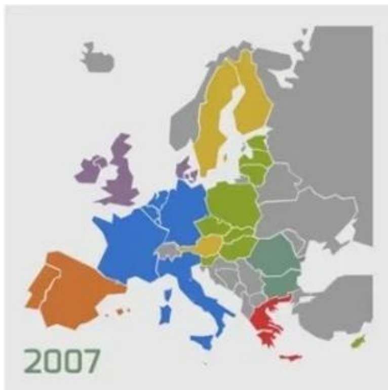
Slika 7: Šesto proširenje Europske unije