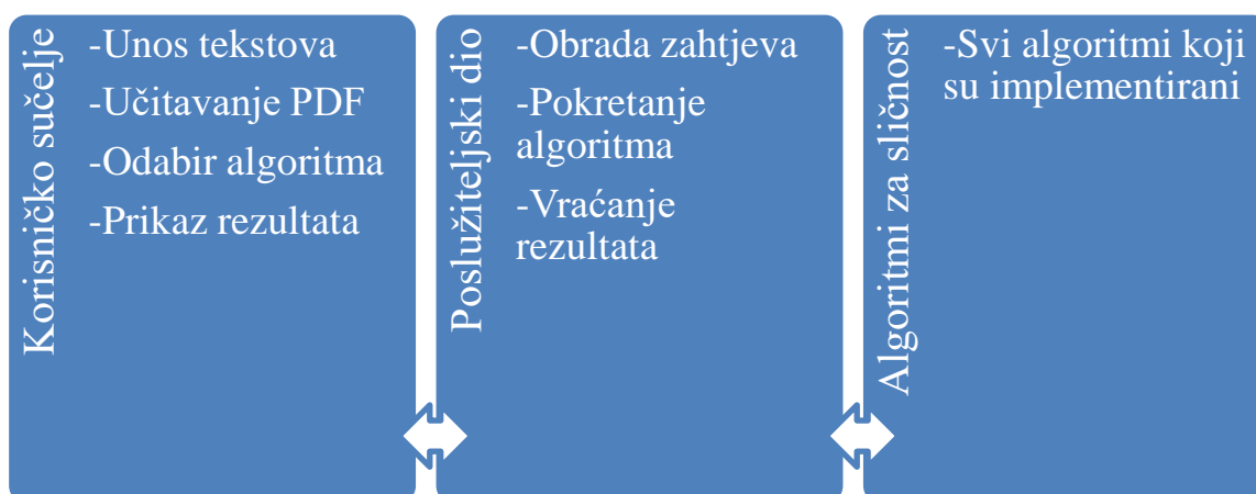
Slika 4.1. Dijagram arhitekture