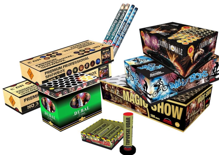
Slika 3. Proizvodi F3 kategorije