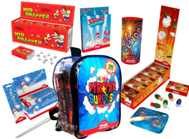
Slika 1. Proizvodi F1 kategorije

streljiva te u maloprodaji i kioscima tokom cijele godine. Kupnja je dozvoljena fizičkim osobama starijim od 14 godina. 5