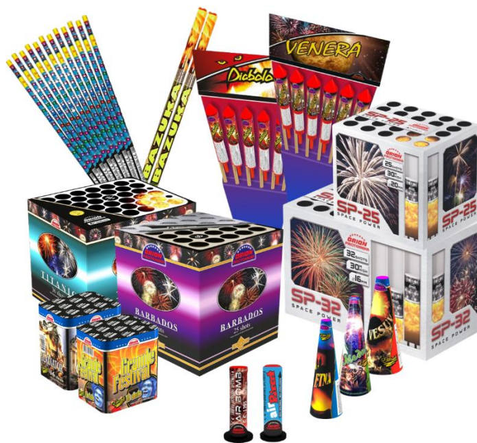
Slika 2. Proizvodi F2 kategorije